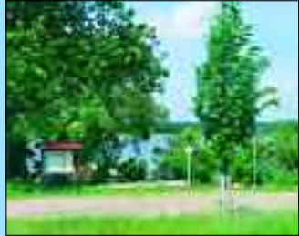
Einwohner: 290 – Fläche: 460 ha

Der heutige Templiner Ortsteil Ahrens Dorf wurde im Jahr 1306 zum ersten Mal urkundlich erwähnt, im Jahre 1320 als „weitläufige Ansiedlung“ längs