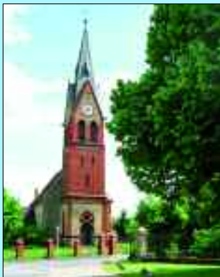
Einwohner: 409 – Fläche: 1580 ha

Am alten Kolonistenweg von Havelburg über Zehdenick und Templin, nach Prenzlau gründeten die Ritter Conradus II. de Hamelspring und sein jüngerer Halbbruder Amelungus de Lippia um das Jahr 1241 die