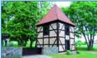
Einwohner: 144 – Fläche: 1664 ha

Als „Beytel“ wurde der Ort 1327 erstmals erwähnt. Im Slawischen bedeutet der Ortsname „Siedlung eines Mannes namens Bytol“. Neu gegründet wurde die Kolonie im Jahre 1749 von Einwanderern aus der Pfalz, aus dem Hunsrück, aus Holstein und Mecklenburg. Damals gab es hier neun Bauernhöfe, neun Büdnerstellen, ein Schul- und Küsterhaus mit Betsaal, das Gemeindegirtenhaus und eine Schmiede. Forst- und Landwirtschaft bildeten von seither die wichtigsten Einkommensquellen vieler Bürger.