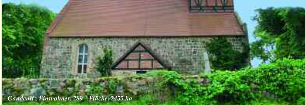
Gandenitz Einwohner: 289 – Fläche: 2455 ha

Erstmals urkundlich erwähnt wurde der wunderschöne Ortsteil Grunewald im Jahre