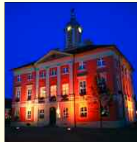
Das Alte Rathaus bei Nacht.

sowie Besuchen der historischen Altstadt von Templin, einer Fahrt mit der Draisine oder für einen Abstecher nach Boitzenburg, wo es in der Hauptsaison seit einigen Jahren Theateraufführungen auf der Freilichtbühne vor malerischen Kulisse der Klosterruine gibt. Besuchern und Einheimischen ist auch eine Tour auf dem Naturpark-Radweg zu empfehlen. Die Strecke führt mit Start und Ziel in Templin über die Stationen Hammelspring, Storkow, Vogelsang, Zehdenick, Himmelfort und Lychen. Besonders erfreulich: Abgesehen von einem kleinen Abschnitt geht es dabei komplett über gut ausgebauten asphaltierten Radwege.