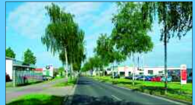
Mit viel Platz und Charme glänzt der Gewerbepark Templin Süd

Der Gewerbestandort Templin ist logistisch komfortabel über die Autobahn A11 Berlin-Stettin oder die Autobahn A24 Berlin-Hamburg zu erreichen. Nur 32 Kilometer von der Anschlussstelle Joachimsthal, 25 Kilometer von der Anschlussstelle Pflingstberg und 65 Kilometer von der Abfahrt Neuruppin entfernt befindet sich der Gewerbepark Templin-Süd, direkt an der Bundesstraße B109 Berlin-Stralsund. Die Bahn verkehrt im Stundentakt von Berlin und Oranienburg und auch per Schiff ist die Stadt über die Havel erreichbar. Darüber hinaus sind der Binnenhafen Schwedt/Oder und der Ostseehafen Stettin/Szczecin verkehrsgünstig erreichbar. Für eilige Geschäftsleute sind der Sonderlandeplatz Groß Dölln/Templin und der Flugplatz Eberswalde-Finow nutzbar. Für internationale Anbindung sorgt der neue Airport Berlin-Brandenburg in 113 Kilometer Entfernung und der Flughafen Stettin/Szczecin im Nachbarland Polen. Der Templiner Gewerbepark Süd ist ein 30 Hektar großes, voll erschlossenes Gewerbegebiet, in dem noch etwa 10 Hektar für Neuansiedlungen zur Verfügung stehen. Seit 1993 haben sich bereits