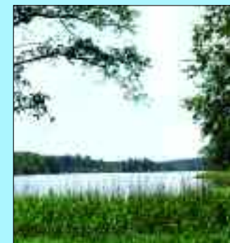
Einwohner: 246 – Fläche: 1903 ha

Der Ortsteil Petznick, zu dem außerdem Kreuzkrug, Henkingshain und Birkenhain gehören, wurde als „Petzenik“