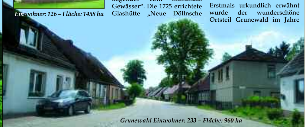
Grunewald Einwohner: 233 – Fläche: 960 ha