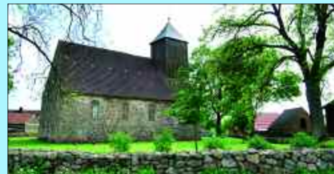
Einwohner: 346 – Fläche: 2318 ha

Zum Ortsteil Klosterwalde gehören außerdem die Ortschaften Metzelthin, Eselshütte,