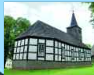
Einwohner: 126 – Fläche: 1458 ha

Zum Ortsteil Gollin gehören auch noch Reiersdorf und Wucker. 1375 wird der Ort erstmals als „Ghollyn“ erwähnt – vermutet wird, dass der Name aus dem Slawischen stammt. Er bedeutet „kahle, unbewaldete Stelle“. Gutsherren waren zunächst die Gebrüder Grifke, Reibold und Bertram von Greiffenberg, ehe das Dorf im 15. Jahrhundert an die von Holtzendorffs zu Vietmannsdorf fiel. Eng verbunden ist die Geschichte von Gollin seit vielen Generationen mit der Nutzung der Schorfheide als Jagdgebiet der jeweils Herrschenden. Die Ortsteile Reiersdorf und Wucker waren ständig Wohn- und Arbeitsstätte von Oberförstern und Förstern. Diese waren für die Wälder der Dörfer Gollin, Grunewald, Vietmannsdorf, Bebersee und Groß Väter zuständig.