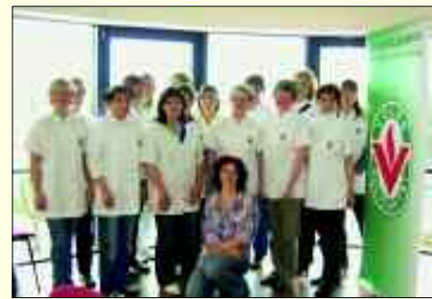
Mit viel Herz und Engagement bilden die Frauen eine „Betreuungskette“

Seit nunmehr 16 Jahren begleitet die Volkssolidarität Sozialstation Templin hilfe- und pflegebedürftige Menschen. In dieser Zeit gelang es der Volkssolidarität eine „Betreuungskette“ zu knüpfen, in der hilfe- und pflegebedürftige Menschen die Möglichkeit haben von den ersten Anfängen einer Hilfebedürftigkeit bis hin zu einer Schwerstpflegebedürftigkeit eine Betreuung und Begleitung aus einer Hand zu erhalten. Die Betreuenden sind so mit den Individualitäten des Betroffenen vertraut und der Betreute kann eine vertrauensvolle Beziehung aufbauen. Die letzte Lücke in der „Betreuungskette“ konnte die Sozialstation in Templin vor gut zwei Jahren mit der Begleitung einer „Ambulanten Betreuung Wohngemeinschaft für Menschen mit eingeschränkter Alltagskompetenzen“ schließen, in der zwölf Bewohner Tag und Nacht professionell betreut werden. Das Angebot der Sozialstation in der „Betreuungskette“ erstreckt sich somit von der offenen Altenarbeit zum Wohnen mit Service, über die punktuelle Betreuung in der Häus-