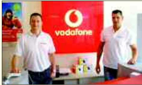
Funkturn – kompetent, zuverlässig, freundlich