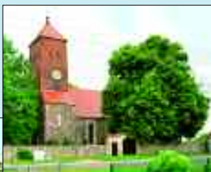
Einwohner: 389 Fläche: 1439 ha

Storkow wurde 1317 als „Storkouue“ erstmals urkundlich erwähnt. Der Ortsname kommt aus dem Slawischen und bedeutet „Siedlung, bei der Pfähle verwendet wurden“. Zum heutigen Storkow gehören Steinfeld und die