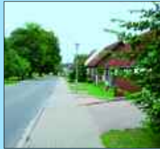
Einwohner: 257 – Fläche: 3421 ha

Densow ist ein ehemaliges Kolonistendorf und wurde im Jahr 1307 erst-