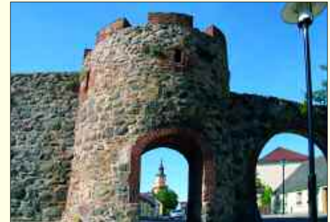
Einst durch die Stadtmauer gut geschützt – die Stadt Templin.

Der Name der Stadt dürfte sich aus den germanischen Sprachen herleiten lassen. Dort bedeutet das Wort timpen, tempen oder tempel „Spitzer Hügel“. Von den slawischen Stämmen, so wird vermutet, wurde die Endung „lin“ angefügt, was so viel bedeutet wie „am Wasser gelegen“. „Templyn“ wird erstmals am 2. Oktober 1270 auf einer Urkunde genannt. Die erste in Templin ausgestellte Urkunde datiert aus dem Jahre 1287, und am 30. August 1314 wurde eine Urkunde ausgestellt, in der erstmals die Bezeichnung „Oppidum Templin“ (Stadt Templin) erscheint.