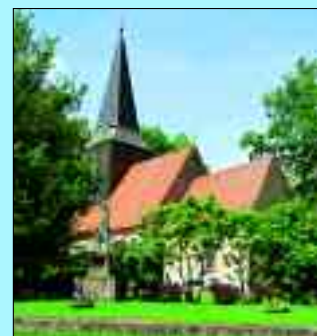
Einwohner: 1241 – Fläche: 737 ha