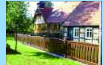
Einwohner: 343 – Fläche: 3916 ha

Hütte“ wurde im Jahr 1744 durch einen Brand vernichtet. Seine Wurzeln hat das spätere Dorf Groß Dölln in einer 1747/48 angelegten Kolonie. Am 18. Oktober 1774 wurde in Berlin die Gründungsurkunde für Dölln unterschrieben. Um 1900 war Groß Dölln die Heimat von etwa 50 Schiffern. Wissenswert – ab 1952 wurden in der Nähe der größte Militär-