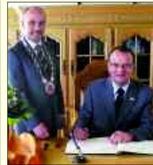
Bürgermeister Detlef Tabbert verewigt sich im Goldenen Buch der Stadt Bad Lippspringe

Zu Pfingsten 2010 war Templins neu gewählter Bürgermeister Detlef Tabbert in offizieller Mission unterwegs. Ziel war Templins Partnerstadt Bad Lippspringe aus Nordrhein-Westfalen. Gemeinsam mit 45 jungen Feuerwehrleuten sowie fünf Vertretern aus der Stadtverwaltung und aus der Stadtverordnetenversammlung war er in die Bäderstadt an der Lippe-Quelle eingeladen worden, um dort das 20-jährige Jubiläum der Städtepartnerschaft würdig zu begehen. Bei seinem offiziellen Antrittsbesuch durfte sich Bürgermeister Detlef Tabbert auch im Goldenen Buch der Stadt Bad Lippspringe verewigen: „Für weitere