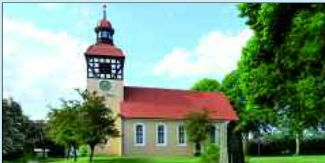
Einwohner: 395 – Fläche: 3762 ha

und später die Herstellung von Teer und Kienöl. Um 1750 wurde Röddelin neu besiedelt. Hohenfelde wurde im Jahr 1857 erstmals erwähnt, das Ackergehöft Schulzenfelde 1862.