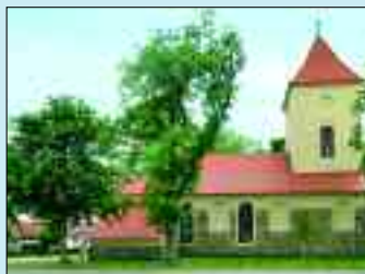
Einwohner: 407 – Fläche: 2002 ha

Röddelin ist von drei Seen umgeben – Röddelinsee, Großer und Kleiner Mahlgastsee. Zu diesem Templiner Ortsteil gehören die Ausbauten Schulzenfelde und Hohenfelde. Die erste Erwähnung stammt aus dem Jahre 1287. Vor der ersten urkundlichen Erwähnung im Jahr 1287 stand hier bereits eine Wasserburg, der Hauptsitz des Wendenhäuptlings vom Stamm Redlin. Deshalb wird vermutet, dass der Ortsname aus dem Slawischen stammt und so viel bedeutet wie „Siedlung eines Mannes namens Rodla“. Haupterwerbszweige waren neben der Landwirtschaft die Weberei