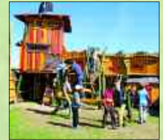
Tollen auf der Räuberburg

ein Dunkellabyrinth dazu, ein 50 Meter Tunnel-Röhrensystem ohne Ausstiege. Gruseln erwünscht, Taschenlampen erlaubt! Ab 10. Juli wird es natürlich auch wieder das beliebte zwei Hektar große Maislabyrinth mit Stempel-suchaktion und Besucherquiz geben, welches für viele Gäste inzwischen zu einem festen Bestandteil ihres Sommer- und Ferienprogramms gehört. Viele weitere Angebote in IRRLANDIA versprechen Spiel, Spaß oder auch Besinnung für kleine und große Leute. Einfache Spielideen wie Riesenseifenblasen, Büchsenwerfen, Klötzerstapeln, Wasserbombenwurfanlagen und Murmelbahnen gehören ebenso dazu wie