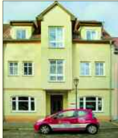
Bestens umsorgt wird man in der Seniorenresidenz „Sonnenschein“

rechten, geschmackvollen und dennoch preiswerten Zimmern, gehört ein eigener Sanitärbereich mit Dusche, WC und Waschbecken. Jedes Zimmer verfügt über einen Telefon- und Fernsehanschluss und kann mit eigenen Möbeln nach Belieben ergänzt werden. Für das leibliche Wohl sorgt die hauseigene Cafeteria. Das Mittagessen wird selbst zubereitet und in Storkow und Umgebung täglich mit „Essen auf Rädern“ geliefert und verwöhnt somit auch manchen außerhalb der Wohngemeinschaft. Die Respektierung der menschlichen Würde und individuellen Persönlichkeit ist das höchste Ziel der Hauskrankenpflege Sonnenschein.