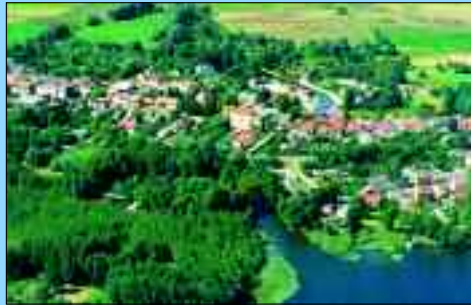
Storkow aus der Luft