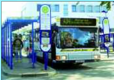
Pünktlich und zuverlässig: Busverkehr Oder-Spree GmbH

Um den aktuellen Anforderungen im Überland- und Stadtverkehr technisch gerecht zu werden, setzt die BOS auf modernste Fahrzeuge. So bieten über 90 Busse ein Höchstmaß an Komfort und Zuverlässigkeit. Insgesamt betreibt die Gesellschaft an fünf Standorten 38 Stadt- und Überlandlinien mit 4,7 Millionen Fahrplankilometern und befördert jährlich um die 7,4 Millionen Personen. Ihr obliegt auch die