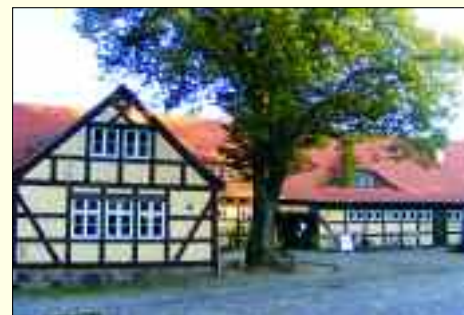
Die Stadtbibliothek befindet sich ebenfalls auf dem Gelände der Burg

Das ansprechende und ständig aktualisierte Angebot sorgt dafür, dass die Bibliothek immer einen Besuch wert ist.