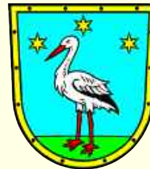
Mittelstandsverein Storkow e.V.

Im Jahr 1992 gegründet, hat der MV die Zielsetzung, die speziellen Interessen der klein- und mittelständischer Unternehmen, Gewerbetreibenden, Händler und Freiberufler zu vertreten und in die lokale Politik einzubringen. Besonderes Anliegen: die Stadt Storkow als Standort mit den Stärken Wohnen, Erholung und Arbeit zu entwickeln. Zur Kommunalwahl 2003 traten die IG Handwerk und der Mittelstandsverein als Wählervereinigung „Neues Storkow“ zum ersten Mal gemeinsam an und wurden sofort zweitstärkste Fraktion in der Stadtverordnetenversammlung. Bei der Kommunalwahl 2008 wurden wieder vier Mandate erreicht. Der Mittelstandsverein engagierte sich