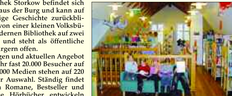
Junge Leseratten in der gemütlichen Kinderbuchabteilung

Die umfangreiche Musik-CD-Sammlung wird regelmäßig um die