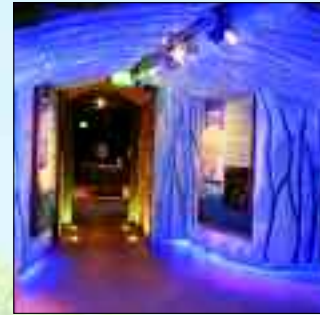
Das Natureum: „Eiszeit“

Die Burg ist der ideale Ort, um Natur und Kultur zu verknüpfen. Seit Juni 2009 ist die Burg Storkow Besucherzentrum des Naturparks Dahme-Heideseen und beherbergt das sogenannte Natureum, die Dauerausstellung „Mensch und Natur – eine Zeitreise“. Interaktive Ausstellungsmedien machen die Kul-