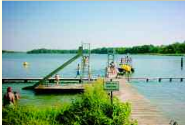
Sonne, Strand und Mehr – im Sommer ist das Strandbad Storkow mit seinen Freizeitangeboten Ziel für Jung und Alt

B eliebt weit über Storkow hinaus und mit hervorragender, kontrollierter Wasserqualität, präsentiert sich das einst 1926 eröffnete Strandbad am Storkower See nach der Rekonstruktion 2001 mit attraktivem Ambiente und großer Service-Palette. Von Mai bis September ist ab 9.00 Uhr durchgängig geöffnet, im Juli und August bis 19.00, ansonsten bis 18.00 Uhr. In der gepflegten Anlage kann man ohne nervende Beschallung wunderbar in Strandkörben oder Liegestühlen relaxen oder sich sportlich bei Schwimmen mit abgegrenztem Nichtschwimmerbereich, Wasserspringen und -rutschen, Beach-Volleyball (zwei gepflegte Plätze), Tischtennis und Kleinfeldfußball betätigen. Der Hit sind alljährlich die Schwimmkurse in den Ferien. Auf dem großen Spielplatz können die Kinder