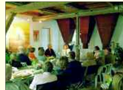
Lesungen gehören zum festen Programm des Freundeskreises

Glücklich schätzen kann sich eine Stadt, in der ein ambitionierter Verein wirkt, der sich mit dem Leben in der Heimatregion mit ihren vielfältigen Traditionen und Entwicklungslinien beschäftigt und darüber auch noch regelmäßig eine anspruchsvolle Zeitschrift herausgibt, die für die Leser sogar kostenlos ist. Ein solches Privileg genießt seit 2006 Storkow (Mark). Im als gemeinnützig anerkannten Freundeskreis „Märkische LebensArt“ wirken Freunde von Kultur, Kunst, Geschichte & Begegnung, um alle die miteinander bekanntzumachen, die etwas tun für die Region. Und „Märkische LebensArt“ heißt auch die Zeitschrift, das Magazin für Scharmützelsee & Oder-Spree-Seenlandschaft, die vom Freundeskreis unter Vorsitz