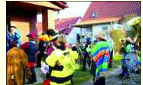
Feste Feste feiern in Limsdorf

Autopflege & Fahrzeugaufbereitung Norbert Helling Görsdorfer Straße 2 • 15859 Klein Schauen Tel. 03 36 78/6 26 36 • Mobil 01 72/7 86 16 84