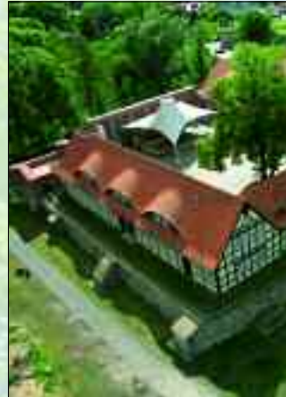
Die Burg aus der Luft

und die Burg in einer Urkunde des Kaisers Otto IV. Über die Jahrhunderte wechselten die Burgbesitzer und veränderten das Bauwerk jeweils nach ihren Vorstellungen. Die Burg war im Besitz der Herren von Strele, der Herren von Biberstein und der Bischöfe von Lebus. Später war die Burg im Pfandbesitz des Königs von Preußen. Das Bauwerk musste mehrere Brände sowie starke Absenkungen über sich ergehen lassen. Mit Hilfe der Brandenburgischen Landesregierung, mit Mitteln der EU und Spenden der Storkower Einwohner und Freunde konnte die Burg Stück für Stück wieder aufgebaut werden. Heute sind aus dem ursprünglichen Gemäuer das ehemalige Brauhaus, die Südmauer und der Gefängnisturm erhalten. Die neue Aussichtsplattform des Turms ist mit einer gläsernen Pyramide ausgestattet, die den Blick in den alten Kerker freigibt. An dem unverputzten Backsteinmauerwerk lassen sich Spuren verschiedenster Bauphasen ablesen.