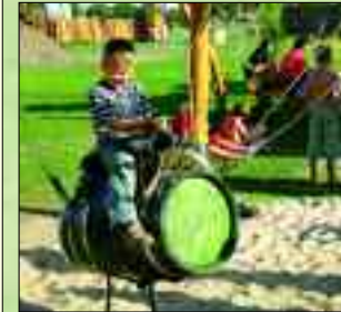
Spaß beim Fassreiten

möchte, ist hier genau richtig. Verirren ist kein Versehen, sondern ausdrücklich erwünscht in IRRLANDIA. Und dafür gibt es viele Gelegenheiten im Türen-, im Hindernis-Hecken-, im Barfuß- oder Kräuter- sowie im Pfählelabyrinth. Großer Beliebtheit erfreut sich auch das Erdlabyrinth – ein Tunnel-system mit oberirdischen Ausstiegen, Hängebrücken und Baumhaus. 2010 kommt noch