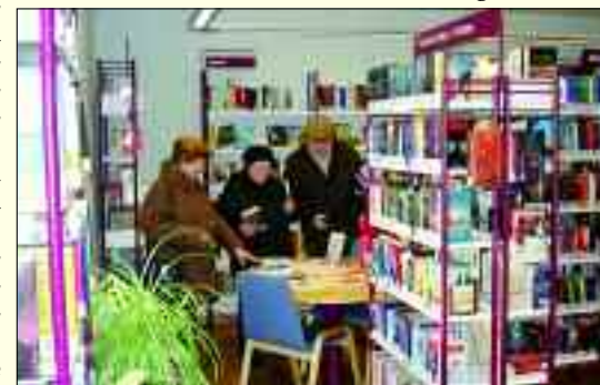
Jedes Genre für jedes Alter hält die Stadtbibliothek für ihre Besucher bereit

aktuellen Musik-Charts erweitert, was vor allem Jugendliche freut. Drei Internet-Arbeitsplätze stehen zur Verfügung und werden gern genutzt. Zwei kompetente Bibliothekarinnen stehen allen Interessenten mit Rat und Tat zur Seite. Schon die Kleinsten machen es sich in gemütlichen