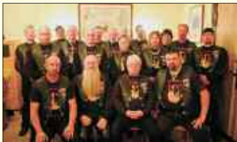
Cruisen, Rock und Chrom sind ihre Leidenschaft

20 Mitglieder hat und im Unterschied zu den „Heizern“ die gemütliche Fahrweise favorisiert, die den „Choppern“ ähnelt und ein typischer Lifestyle für entspanntes Genussfahren ist. Überhaupt: Spaß am Fahren und an der Gemeinsamkeit ist es, was die Truppe motiviert und ihre zahlreichen Ausfahrten an Wochenenden oder im Urlaub charakterisiert, bei denen eben auch der Weg das Ziel ist. In ihrem Klubhaus LOS Rock Beeskov treffen sich die Freunde regelmäßig und wer neu hinzustoßen möchte, kann mit seiner Maschine dort vorfahren.