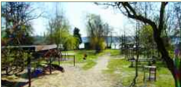
Das Eltern-Kind-Zentrum in der F.-Engels-Str. 5 verfügt über einen großen Garten mit Spielplatz und Badestelle am Storkower See

Im Frühjahr 2010 soll in Storkow das neue „Eltern-Kind-Zentrum“ eröffnet werden, ein Angebot der Stadt Storkow für alle Familien beziehungsweise Eltern. Unsere Gesellschaft fordert Chancengleichheit für alle Kinder, jedes Kind mitzunehmen und stets das Kindeswohl im Vorrang zu sehen. Ein „Eltern-Kind-Zentrum“, das sich als offene Einrichtung versteht, unterstützt diese Forderungen. Standort ist die Station Junger Naturforscher und Techniker in unmittelbarer Anbindung an die benachbarte Natur-Kita „Seepferdchen“. Beide gehören zusammen und der Elternkontakt ist damit optimal. Leiten wird das Eltern-Kind-Zentrum Stationsleiterin Hanna Senkebeil. Als Arbeitsschwerpunkte