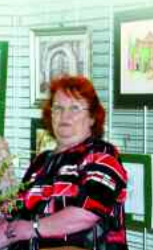
Ausstellung der AG Malen und Zeichnen

den. Alle Mitglieder des Vereins engagieren sich in den verschiedenen Arbeitsgruppen und Veranstaltungen und unterstützen den Verein ganz individuell in seiner Arbeit. Der Arbeitsplan für 2010 ist stramm gefüllt und man darf sich wieder auf eine Vielzahl abwechslungsreicher Kleinveranstaltungen und Events in Storkow freuen.