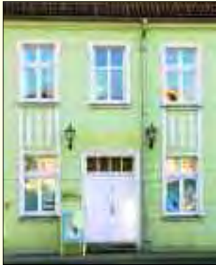
Die städtischen Museen bieten viel Interessantes und Sehenswertes aus der Geschichte

Manchmal geschehen noch richtig spannende Geschichten. Ein Forscher, der sich mit den Beschlägen alter Bücher beschäftigt, machte die Museumsleitung auf eine Auktion aufmerksam. Ein Gebetsbuch der Hohensteiner aus dem Jahre 1586 sollte versteigert werden. Schnell wurden Gelder über die Kulturstiftung der Länder organisiert, einen großen Teil steuerte die Ostdeut-