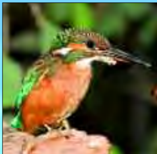
Besonders Vögel sind hier zahlreich anzutreffen

Einer der Gründe für ungebrochene Besucherströme in die Region Schwedt ist zweifelsohne der Nationalpark Unteres Odertal. Er wurde als zwölfter Nationalpark Deutschlands 1995 gegründet und ist der einzige Auen-Nationalpark der Bundesrepublik. Auenlandschaften sind aufgrund ihrer Artenvielfalt Naturerlebnisräume mit besonderem Anschauungs- und Beobachtungswert. Im unteren Odertal hat jede Jahreszeit ihre Reize. Während im Herbst, in tiefen Nebel gehüllt, die großen Gänse- und Kranichschwärme durch die Niederung ziehen, überwiegt in kalten Wintern die Stille unter den mit Reif bedeckten Weiden und der fast lautlose Eisgang auf der Oder. Das erwachende Frühjahr lockt wiederum lär-