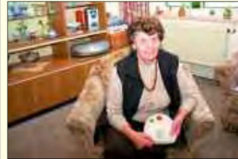
Er wird immer beliebter – der Hausnotruf gibt Sicherheit und er ermöglicht den ständigen Kontakt mit der DRK-Hausnotrufzentrale

che Pflege im Krankheits- beziehungsweise Pflegefall, das Betreute Wohnen, die stationäre Pflege im Seniorenwohn- und Pflegezentrum „Kastanienallee“, der Rettungsdienst, der Fahrdienst und der Hausnotrufdienst. Im Rahmen der Pflege werden die Patienten fachgerecht von ausgebildeten Mitarbeiterinnen beraten, betreut und versorgt. Seit 2008 können Patienten mit Demenz aber auch ihre Angehörigen durch eine erfahrene und speziell geschulte Mitarbeiterin beraten werden. Die mobilen sozialen Dienste umfassen Krankenfahrten, Behindertenfahrten und Wunschfahrten, wofür je nach Bedarf ausgestattete Spezialfahrzeuge, aber auch PKWs rund um die Uhr zur Verfügung stehen.