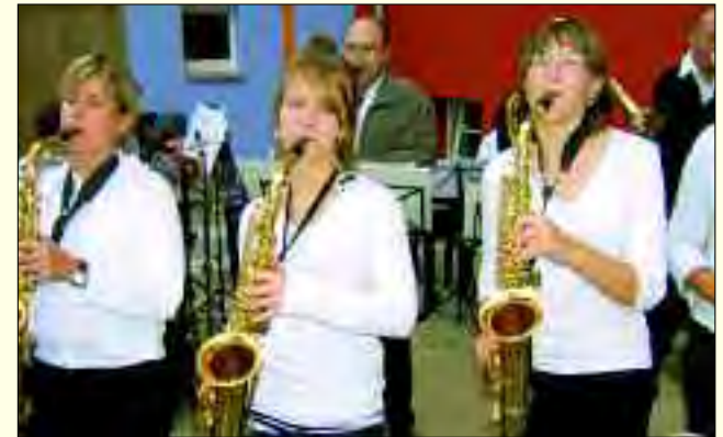
Die Schüler der Musik- und Kunstschule erfreuen die Schwedter und deren Besucher auf Konzerten mit

Für Kunst und Kultur wird viel in Schwedt getan, was eigentlich nicht verwundern sollte, wenn man in solch einer schönen Landschaft wohnt. Da Kunst aber nicht nur Talent ist, sondern im hohem Maße auch Können, muss das gelernt und geübt werden. Dafür gibt es Musik- und Kunstschulen. Die Schule in Schwedt mit dem stolzen Namen „J. A. P. Schulz“ bietet diesen Service rund 1.000 Schülern. Zehn fest angestellte und 24 Lehrkräfte