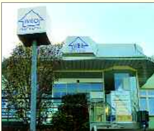
Zentrale der Wohnungsbaugesellschaft