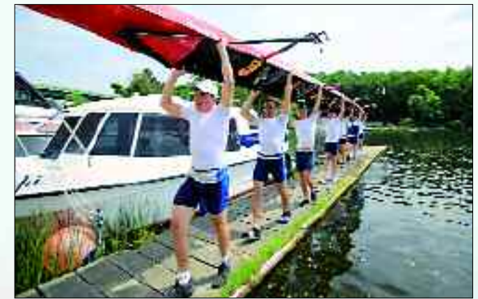
Alle in (unter) einem Boot?