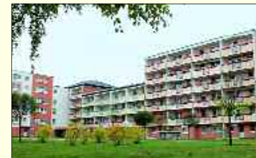
Rüdersdorf, Brückenstraße 82-87 und 88-91

Die Wärmeversorgungsgesellschaft Rüdersdorf sorgt als Tochtergesellschaft der WBG Rüdersdorf in diesem Zusammenhang vor allem für den kontinuierlichen Ausbau der Fernwärmeversorgung in eigenen und fremden Wohnungsbeständen und Einrichtungen. Dafür betreibt sie in Rüdersdorf die mit neuester Technik ausgerüstete Wärmeerzeugungsanlage im Bereich des Friedrich-Engels-Ringes.