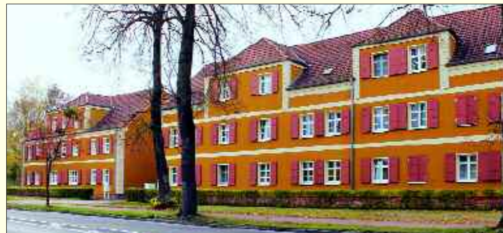
Schönes Wohnen in Rüdersdorf bei Berlin, hier Herzfelde, Möllenstraße 13 und 14

Wohnungsbaugesellschaft Rüdersdorf mbH Rudolf-Breitscheid-Straße 60 • 15 562 Rüdersdorf bei Berlin Tel. 03 36 38/75 70 • Fax 03 36 38/7 57 28 www.wbg-ruedersdorf.de