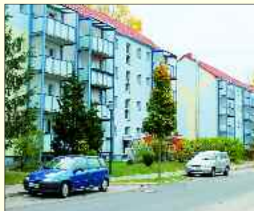
Hennickendorf, WBG Albrecht Thaer 20-33

bezahlbaren Wohnraum in der Großgemeinde Rüdersdorf. Die Lebensqualität für die Bürgerinnen und Bürger stetig zu verbessern ist der Ansporn der Belegschaft. Hierbei stehen der zuvorkommende Service und die kompetente Betreuung der Kunden im Vordergrund. In den vergangenen zwei Jahren wurden viele Wohnungen in der Gemeinde Rüdersdorf saniert und altersgerecht umgebaut.