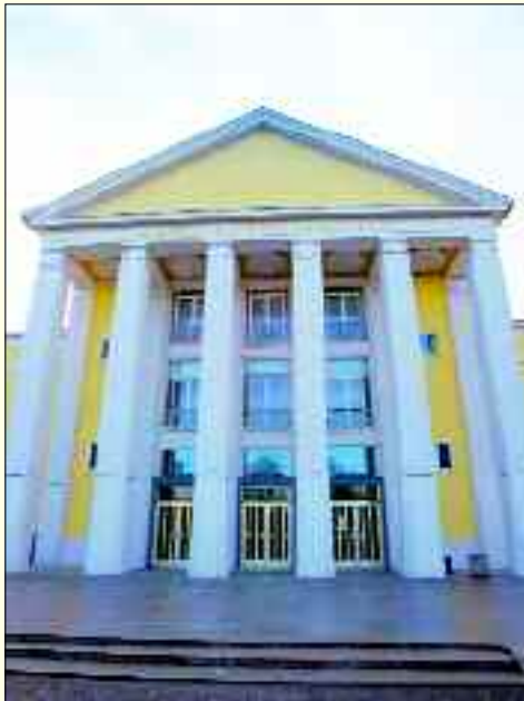
Das Kulturhaus in Rüdersdorf mit langer Tradition – einfach kultig und weithin beliebt bei jung und alt.

Das Kulturhaus ist eine feste Größe in der Gemeinde Rüdersdorf und der Umgebung. In unmittelbarer Nähe der durch Rüdersdorf führenden A 10 – Berliner Ring – erhebt sich der neoklassizistische, unter Denkmalschutz stehende Monumentalbau. Das Kulturhaus wurde 1956 fertig gestellt und wird von den Einwohnern wegen seiner tempelartigen Bauweise auch „unsere Akropolis“ genannt. Es ist das kommunikative Zentrum der Kommune. Die „Akropolis“ hat es in sich: Die Innenräume sind im Original erhalten. Durch die Eingangshalle gelangt der Besucher in ein 272 Quadratmeter großes