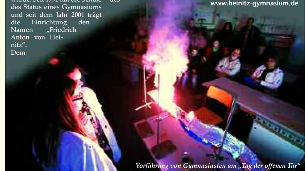
Vorführung von Gymnasiasten am „Tag der offenen Tür“

Gymnasium „Friedrich Anton von Heinitz“ Brückenstraße 80a 15562 Rüdersdorf www.heinitz-gymnasium.de