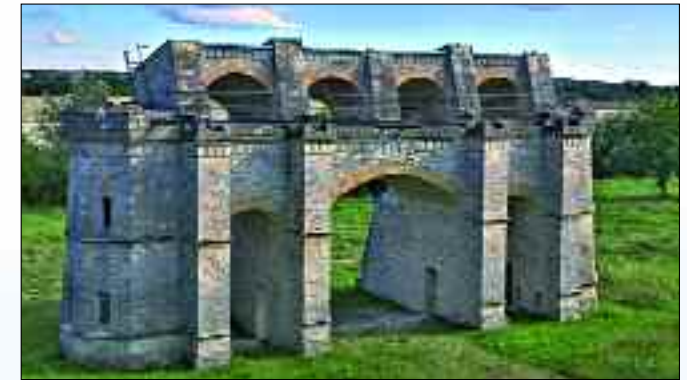
Seilscheibenpfeiler im Museumspark Rüdersdorf

versteinerten Tiere des einstigen Trias-Meeres selbst geborgen werden. Man befindet sich regelrecht auf den Spuren von Geologen denn mit Werkzeug ausgerüstet, gibt es eine Suche in die Anfänge der Erdgeschichte. Und nicht zu vergessen die Land-Rover-Touren entlang der Bruchkante des aktiven Tagebaus. Bei der Tour erfahren Interessierte Fakten über die Geschichte, Gegenwart und Zukunft des Kalksteins – tel. Anmeldung: 03 36 38/79 97 97. Außerdem gibt es während der Hauptsaison von April bis Oktober zahlreiche Veranstaltungen im Museumspark. Der besondere Fokus liegt in diesem Jahr bei 20 Jahren Museumspark Rüdersdorf. So wird es eine Ausstellung geben, Zeitzeugen werden aus dieser Zeit berichten und viele weitere Einzelveranstaltungen werden vorbereitet. Weitere Höhepunkte sind unter anderem am ersten Juliwochenende das Rüdersdorfer Bergfest zum Beispiel mit dem Einzug der Bergleute oder der Schausprengung.