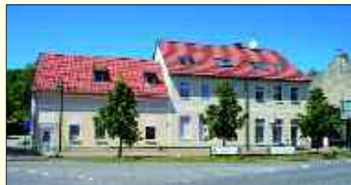
Hennickendorf, Berliner Straße 1

W ohnen in Rüdersdorf und Hennickendorf – natürlich in Wohnungen der WBG Rüdersdorf GmbH und der Kommunalen Wohnungsverwaltungsgesellschaft Hennickendorf mbH. Diesen Leitgedanken haben sich die Mitarbeiterinnen und Mitarbeiter der beiden Wohnungsgesellschaften zu Eigen gemacht und schaffen somit bereits seit über 20 Jahren guten und