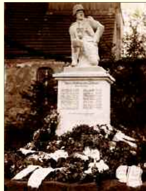
Das alte Kriegerdenkmal in den Dreißigern des vorigen Jahrhunderts.

Übrigens werden noch Sponsoren für die Restaurierung des Gedenksteins gesucht.