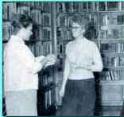
Die Bibliothek in den Sechziger Jahren