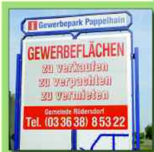
Noch sind Flächen frei: Gewerbegebiet am Ortseingang von Hennickendorf

Die Gemeinde Rüdersdorf bei Berlin ist aufgrund ihrer Lage, der vorhandenen Infrastruktur, seiner Bedeutung als Industriestandort, flächenmäßigen Ausdehnung und der ausgewiesenen Entwicklungsmöglichkeiten bestens geeignet, neuen Industrieprojekten eine erforderliche solide Grundlage zu geben. Die Gewerbegebiete sind durch ihre verkehrsgünstige Lage besonders interessant und bieten zukunftsorientierten Anbietern vielfältige Möglichkeiten. Das Gewerbegebiet Pappelheim liegt direkt am Ortseingang von Hennickendorf. Die Bruttofläche beträgt 15,30 Hektar, die Nettofläche 12,70 Hektar und die noch verfügbare Nutzfläche momentan 4,93 Hektar. Damit liegt ein Auslastungsgrad von derzeit 61,2 Prozent vor. Stromanschluss, Gas und Wasseranschluss wie auch Abwasser und Telekommunikation sind vorhanden. Das Gewerbegebiet Tasdorf-Süd liegt direkt an der Bundesstraße B1/5 und ist nur knapp 4 Kilometer von der Autobahn A10 entfernt. Gas-, Strom-, Wasser-, Abwasseranschluss sind wie auch Telekommunikationsmöglichkeiten vorhanden. Die Bruttofläche beträgt 20,24 Hektar. Derzeitiger Auslastungsgrad des Gewerbegebietes liegt bei 100 Prozent. Ebenfalls direkt an der Bundesstraße B1/5 liegt das Herzfelder Gewerbegebiet. Holzverarbeitung, Baumaschinenvermietung und das „Baggerland“ sind hier zu finden.