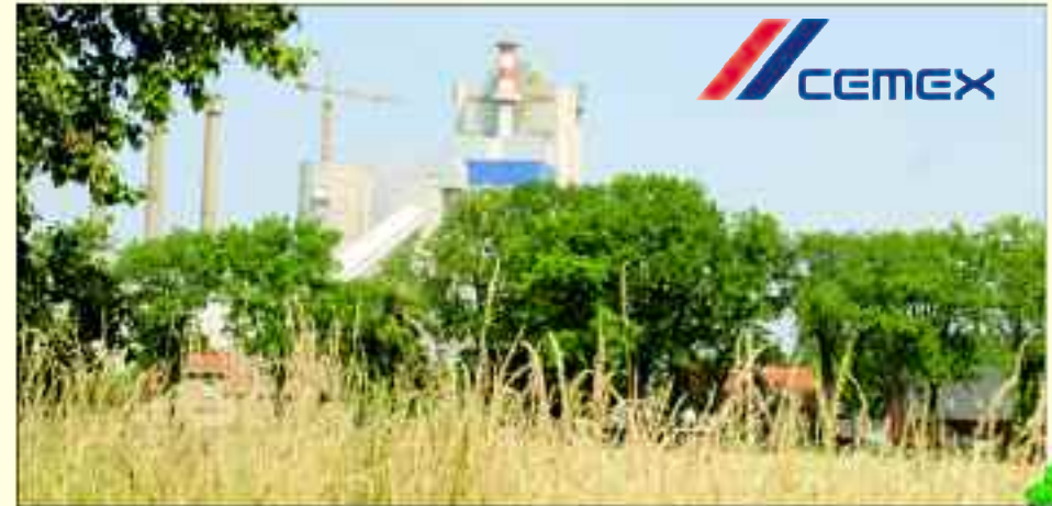
Das Gelände der CEMEX in Rüdersdorf liegt verkehrsgünstig an der Bundesstraße

Nach dem Abschluss der Ausbildung wird den leistungsbereiten Auszubildenden die Möglichkeit geboten, in einer befristeten Anstellung von sechs Monaten im Unternehmen zu verbleiben. Eine dauerhafte Anstellung im Unternehmen nach der Berufsausbildung ist nur in seltenen Fällen möglich. Sollten die jungen Leute flexibel auf andere Angebote, die ihren beruflichen Voraussetzungen entsprechen, reagieren, haben sie bei entsprechendem Bedarf die Möglichkeit, innerhalb der CEMEX-Gruppe auch in anderen Bundesländern eingesetzt zu werden. Durch ihre komplexe Berufsausbildung haben die Absolventen aber auch gute Möglichkeiten in anderen Bereichen der Wirtschaft, des Handwerks oder der Dienstleistungsbranche zu arbeiten. So konnte in den vergangenen Jahren der überwiegend größte Teil ehemaligen Auszubildender in eine Weiterbeschäftigung gehen. Auch in Zukunft ist man bemüht, nach einer erfolgreichen und engagierten Ausbildung, den Ausbildungsabsolventen beim Einstieg ins Berufsleben behilflich zu sein.