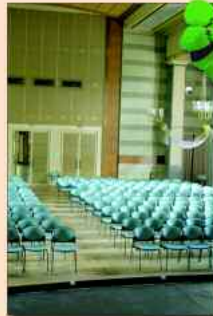
Hier traten schon einige Prominente auf – allerdings vor vollen Rängen

Zur Erhaltung des inzwischen denkmalgeschützten Gebäudes hat sich ein Förderverein gegründet, der den bezeichnenden Namen VivaK trägt. „Viva-Kulturhaus oder es lebe das Kulturhaus!“