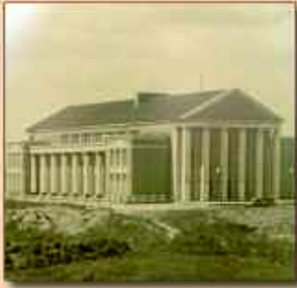
Das Kulturhaus kurz vor der Fertigstellung im Jahre 1956

Viele waren hier und viele hatten Erfolg. Viel hat sich im Laufe der Jahre geändert, nur eines ist gleich geblieben, der Name des Hauses: „Martin Andersen Nexö“. Kein anderes Haus polarisiert die Rüdersdorfer so wie ihr Kulturhaus. Es gibt eigentlich nur zwei Gruppen. Die einen lieben es, die anderen mögen es nicht so.