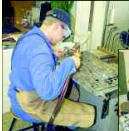
Die Ausbildung bei der CEMEX garantieren einen guten Start ins Berufsleben

Im Zementwerk Rüdersdorf hat die Berufsausbildung eine jahrzehntelange Tradition. Ob zu DDR-Zeiten oder nach der Wende bei Readymix – Schulabgänger dieser Region hatten stets eine Chance eine qualifizierte Berufsausbildung zu erhalten. So wird man auch in Zukunft jungen Leuten bei CEMEX Ausbildungsplätze anbieten können. Im März 2005 wurde die RMC-Group p.l.c. und damit auch die deutsche Tochter Readymix AG, von dem weltweit tätigen Unternehmen