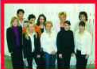
Geschäftsstelle Rüdersdorf 15562 Rüdersdorf Puschkinstr. 4 Tel.: 033638 150-0