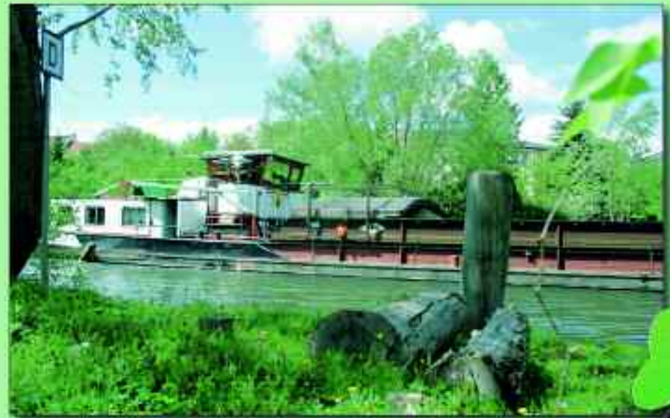
Idylle pur – egal ob man sich für einen Ausflug an die Kanäle, den Kalksee, den Stienitzsee oder an eine der vielen reizvollen Ecken in der Gemeinde Rüdersdorf bei Berlin entscheidet