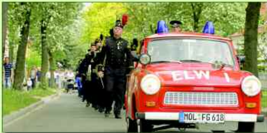
„Unvergesslicher Tag in Herzfelde: Mit einem großen Festumzug durch den Ort wurde auch der Umzug in das neue Feuerwehrdepot der Herzfelder Kameraden würdig begangen.“