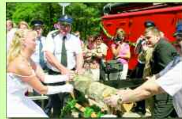
Eine zünftige Feuerwehrhochzeit, so wie im Frühjahr 2006 in Rüdersdorf bei Berlin, ist unvergesslich