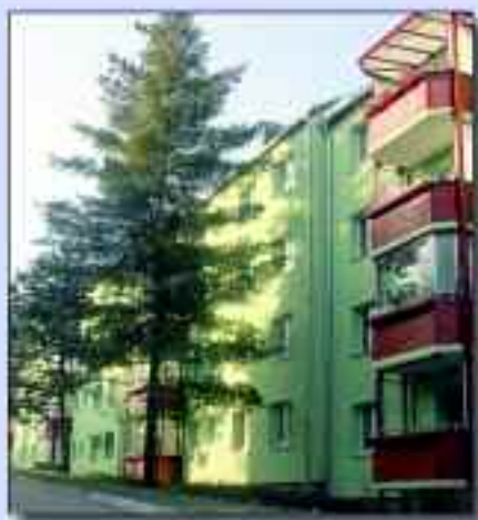
Modern Wohnen in Rüdersdorf bei Berlin am Kalkberger Platz

Das Wohnen in Rüdersdorf verbindet sich in erster Linie mit den Wohnungsbaugesellschaften Rüdersdorf mbH WBG und der KWVG Hennickendorf mbH.