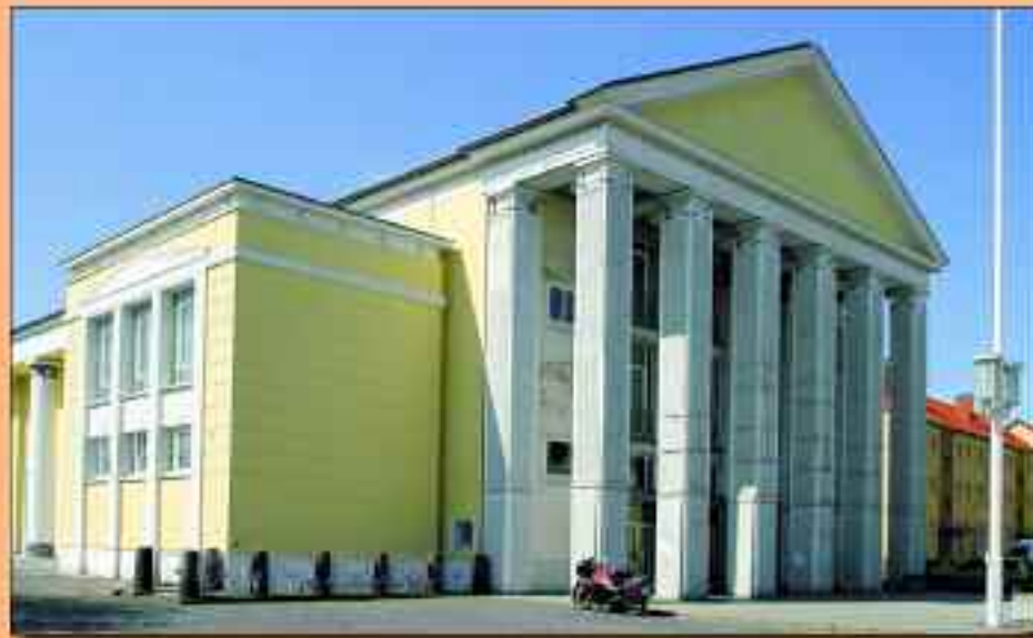
Im Laufe der Zeit hat sich viel geändert. Eines ist allerdings geblieben: Das Kulturhaus trägt auch im Jubiläumsjahr seinen ursprünglichen Namen „Martin Andersen Nexö“

Der Grundstein für das Haus wurde bereits 1954 gelegt und zwei Jahre später, am 12. Oktober 1956 war es so weit: Nach 27 Monaten Bauzeit wurde das Kulturhaus „Martin Andersen Nexö“ eröffnet und als Haus für die Werktätigen, wie es damals hieß, seiner