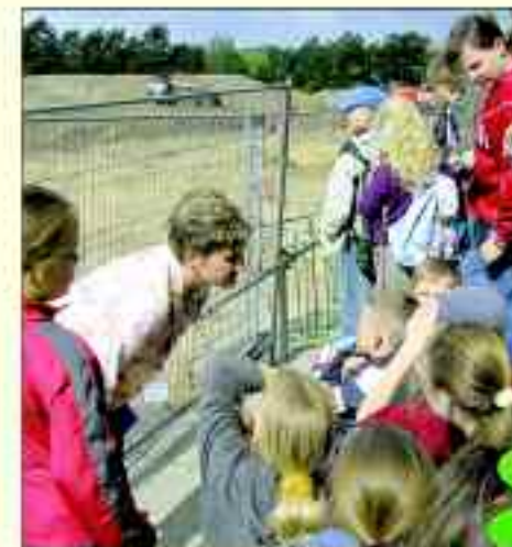
Rüdersdorfer Schüler bei der Besichtigung der Krankenhaus-Baustelle

gion, wie zum Beispiel den Besuch einer Rüdersdorfer Schulklasse im Mai 2006. Die von den Schülerinnen und Schülern selbst angefertigte Ausstellung zum Thema „Gesundheitsschäden durch Rauchen“ wird im Krankenhaus öffentlich gezeigt. Die Mitarbeiterinnen und Mitarbeiter eines gesundheitsfördernden Krankenhauses sind sich dabei ihrer Vorbildfunktion bewusst, was 2005 eine Befragung nachwies. Ihnen sind die schwerwiegenden gesundheitlichen Folgen von Sucht bekannt. Nur zu oft haben Sie mit deren Auswirkungen zu kämpfen.