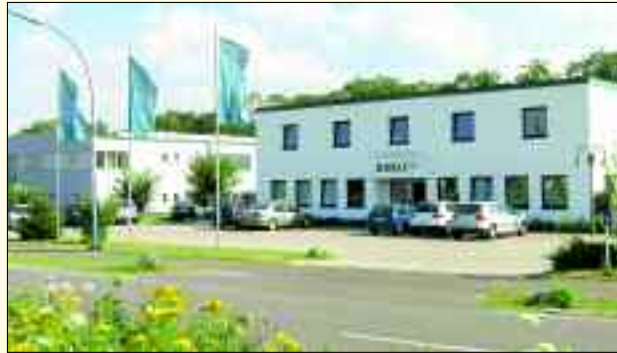
Die DAKU Fensterbau GmbH liegt verkehrsgünstig an der B1 in Herzfelde

DAKU Fensterbau GmbH Buchenstraße 11 15 378 Herzfelde Im Gewerbegebiet an der B1 Tel. 03 34 34/48 60 Fax 03 34 34/4 86 30 www.daku-fenster.de info@daku-fenster.de