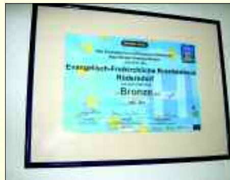
Das Krankenhaus erhielt die Auszeichnung „Bronze“ für das Nichtraucher-Engagement

können Patienten und Besucher auf den Stationen und an den Rezeptionen erhalten. Das Büro für Qualitätsmanagement und Gesundheitsförderung nimmt gern Hinweise und Anregungen von Bürgern zum Thema: „Rauchfreies Krankenhaus“ entgegen. Gestalten Sie mit, helfen Sie, die Schritte auf dem Weg zum Rauchfreien Krankenhaus gemeinsam zu gehen. Ein schwedisches Sprichwort sagt: „Gesundheit ist ein Geschenk, dass man sich selber machen muss.“