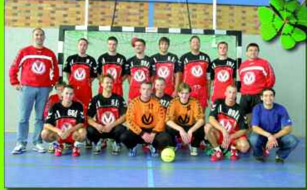
Die Handballer des Handballclub Hennickendorf haben sich längst in der Handball-Landesklasse etabliert und sind langsam auch für höhere Aufgaben bereit.