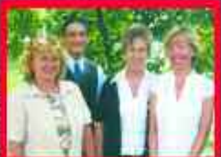
Geschäftsstelle Hennickendorf 15378 Hennickendorf Berliner Straße 3 Tel.: 033434 409-0

Nähe ist bei uns kein Zufall, sondern Absicht.