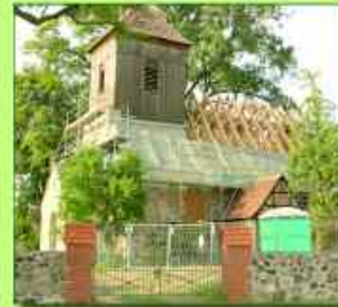
„Sie erhält in den nächsten Jahren ein neues Gesicht und beginnt somit ein neues Leben – die Dorfkirche in Lichtenow“

now. Dieser letzte offizielle Tag wurde zu einem kleinen Fest genutzt und bei diesem gleichzeitig auch der Baubeginn gefeiert.