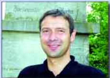
André Schaller ist seit Oktober 2003 Bürgermeister der Gemeinde Rüdersdorf bei Berlin mit den Gemeindeteilen Hennickendorf, Herzfelde, Lichtenow und Rüdersdorf

Wenn ich die Schönheiten der Gemeinde Rüdersdorf preise, denke ich zuerst an die lieblichen Seen, die zum Baden, Angeln, Rudern oder Segeln einladen. Freizeitkapitäne finden hier ein wahres Paradies. Die ausgedehnten Mischwälder, Naturschutzgebiete und Feuchtbiootope locken gestresste und Erholung suchende Einheimische wie Besucher zu Ausflügen zu Fuß oder mit dem Fahrrad. Rüdersdorf mit seinen Ortsteilen Hennickendorf, Herzfelde und Lichtenow ist eingebettet in eine reizvolle Umgebung.