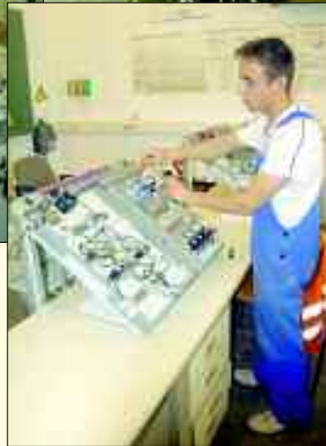
Elektroniker im Betriebspraktikum

Die Ausbildung ist praxisnah gestaltet und den Azubis steht modernste Technik zur Verfügung