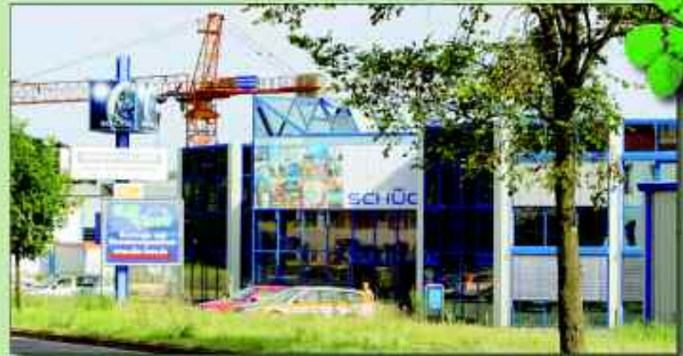
Bisher sehr gut ausgelastet ist das Gewerbegebiet in Tasdorf. Hier macht sich insbesondere die gute Verkehrsanbindung bezahlt