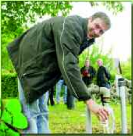
„Noch nicht als Trinkwasser offiziell zugelassen, aber kosten, das muss erlaubt sein.“

Man stellt fest: Es tut sich etwas in der Gemeinde Rüdersdorf bei Berlin. Täglich sind Veränderungen festzustellen und jeder Ort für sich wird immer attraktiver – also vier Orte zum Leben. Da der Schwerpunkt dieses Heftes immer wieder im Ort Rüdersdorf liegt, werden in diesem Abschnitt die wichtigsten Ereignisse in den drei anderen Ortsteilen beleuchtet.