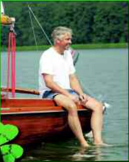
Einfach einmal die Seele baumeln lassen, sich erholen und richtig abschalten

Der große Dichter Theodor Fontane hat auf seinen Wanderungen bereits erkannt, wie schön das Land ist. Die Märkische Schweiz, das Oderbruch, das Barnimer Land – alles reizvolle Gegenden, die geradezu nach Tourismus und Erholung rufen.