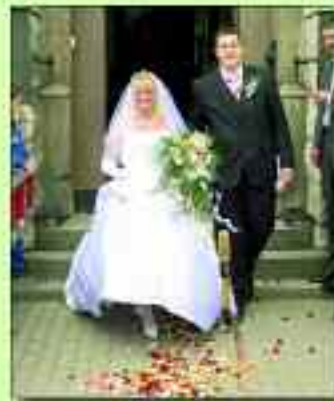
Soeben das „Ja-Wort“ gegeben – im Standesamt im Rathaus

Sprechzeiten: Montag, Mittwoch, Donnerstag von 9 bis 17 Uhr, Dienstag von 9 bis 19 Uhr und Freitag von 9 bis 15 Uhr. Eheschließungen sind von Montag bis Freitag oder am Samstag nach Vereinbarung möglich.