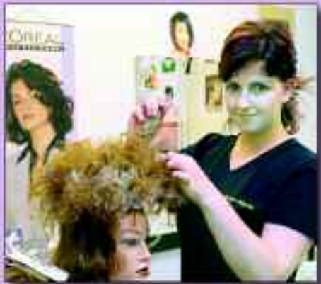
Ausbildung im Christlichen Jugenddorfwerk

Kita „Rappelkiste“ Freier Träger JUH e.V. Haus 1 Brückenstraße 77a 15 562 Rüdersdorf bei Berlin Tel. 03 36 38/33 02 Kita „Sonnenschein“ Freier Träger JUH e.V. Hort Brückenstraße 78 A 15 562 Rüdersdorf bei Berlin Tel. 03 36 38/33 35 (gehört zur Einrichtung Kita „Rappelkiste“)