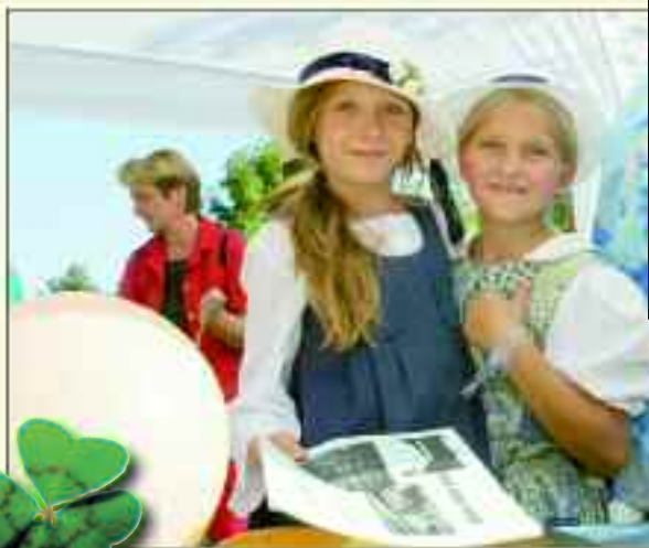
Bei den Stienitzseetagen feiern insbesondere die Hennickendorfer, obwohl inzwischen auch die Ortsnachbarn gern einmal rüberkommen.