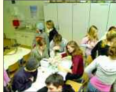
Das Rüdersdorfer Gymnasium gehört zu den 100 Besten in Deutschland

Im 2005er Heft stand noch: „Als einziges Gymnasium in Brandenburg bietet das Heinitz-Gymnasium eine Additive Ganztagschule an.“ 2006 ist man schon weiter. Seit März ist die Einrichtung darüber hinaus ein staatlich zugelassenes Ganztagsgymnasium. Trotz sinkender Schülerzahlen im Land ist die Schule stark gefragt. Zukünftige Schülergenerationen können – genau wie die derzeit 50 Lehrer – von einem sicheren Schulstandort