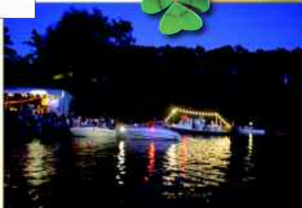
Wasserfest auf dem Kalksee. Jubel, Trubel Heiterkeit und erst zu später Stunde, nach dem traditionellen Bootskorso zieht langsam ein wenig Romantik über dem See ein. Ein Fest das inzwischen viele Fans gefunden hat.