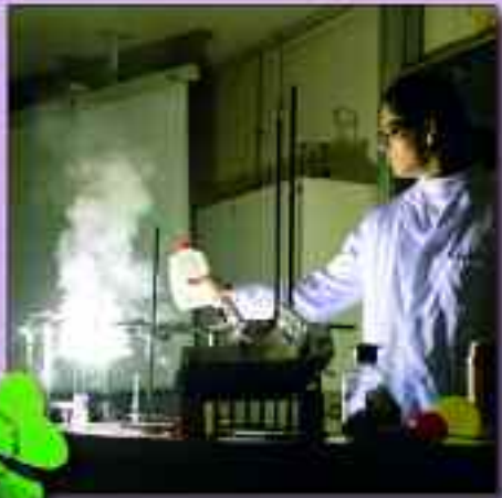
Wenn es knallt und zischt... – Experimente machen Zusammenhänge anschaulich

Wer Statistiken verfolgt, wird feststellen, dass zur Altersstruktur von Rüdersdorf nahezu 30 Prozent Senioren gehören. Doch die Gemeinde Rüdersdorf bei Berlin unternimmt in jedem Jahr gleichzeitig große Anstrengungen um für die Kinder und Jugendlichen in den Orten umfangreiche Betreuungsmöglichkeiten zu schaffen. Kindertagesstätten, Hort, Schulen und das Gymnasium, dazu weitere Ausbildungsstätten wie das CJD, das Christliche Jugenddorfwerk Deutschlands e.V., und die Cemex Ost-Zement GmbH als größte Ausbildungsbetriebe sind wichtige Bestandteile der Gemeinde.