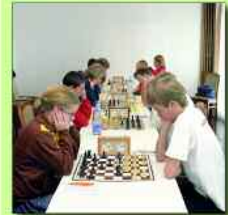
Im Leistungsstützpunkt des Sportvereins „Glück Auf“ wachsen viele Talente heran

2006 erlebte Rüdersdorf bereits die 52. Ruderregatta, auf dem Rüdersdorfer Kalksee ausgetragen. Ein riesiges Teilnehmerfeld von insgesamt 1.060 Aktiven aus 179 Rudervereinen und Rengemeinschaften fanden sich rund um das Bootshaus des Rüdersdorfer Ruder-