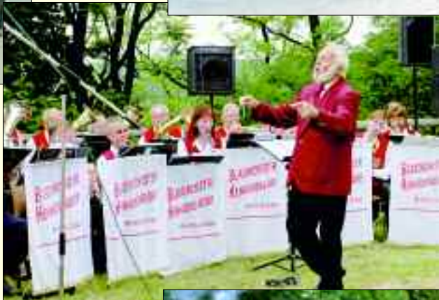
Die Auftritte des Hennickendorfer Blasorchesters sind aus dem kulturellen Leben der Gemeinde nicht weg zu denken – Garant für gute Laune und Stimmung bei vielen Festen