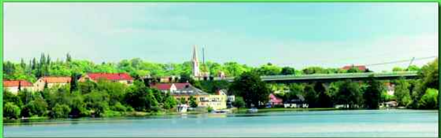
Rüdersdorf bei Berlin ist landschaftlich reizvoll gelegen und hält touristisch vom Wassersport bis zum kulturellen Angebot eine ganze Menge bereit

nen geschichtsträchtigen Orte sind es wert erkundet zu werden. Die Heimatfeste, wie das Bergfest, Wasserfest, die Dorffeste in Lichtenow und Herzfelde, das Wachtelbergfest oder auch inzwischen international bekannte Veranstaltungen wie der Stienitzsee-Crosslauf sind jedes für sich wichtige Bestandteile, um die Region auch nach außen hin weiter bekannt zu machen. Damit wird die Marke S5-Region immer bekannter und noch viel wichtiger – auch beliebter!“