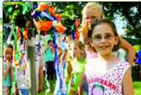
Traditionen, Traditionen und so lassen es sich die Herzfelder auch nicht nehmen, ihr jährliches Sommerfest zu feiern.