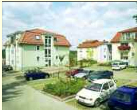
Die Wohnanlage „Zum Seeblick“

So lautet der Slogan der 1992 gegründeten Kommunalen Wohnungsverwaltungsgesellschaft Hennickendorf mbH. Und die KWVG, wie sie im Kürzel heißt, hat Erstaunliches zu bieten. 564 Wohn- und sechs Gewerbeeinheiten werden betreut, dazu kommen Verwaltungen für Dritte und ein paar Garagen. Die Wohnqualität kann sich sehen lassen, und es lebt sich in der 3.300-Seelen-Gemeinde überhaupt ausgesprochen gut.