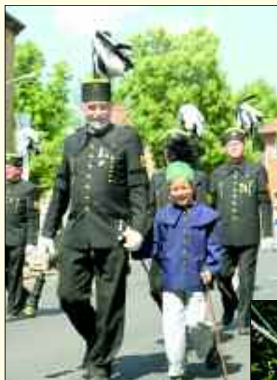
Höhepunkt eines jeden Bergfestes ist die so genannte Bergparade. Bergbauverein und Bergmannskapelle ziehen durch den Ort. Auch andere Vereine des Ortes beteiligen sich regelmäßig jedes Jahr an dem bunten Zug.