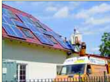
Die Photovoltaikmodule erzeugen aus Sonnenlicht elektrische Energie, die ins Netz eingespeist wird

Photovoltaik (PV) heißt das Zauberwort, und wer träumt nicht auch davon, seinen eigenen Strom preiswert herzustellen? Mit dem Slogan „Werden auch Sie Energieerzeuger!“ wirbt die OWK Umwelttechnik und Anlagenbau GmbH dafür als Partner. Mit ihren maßgeschneiderten Produktlösungen und der Technik-Kompetenz ist man immer auf der sicheren Seite, denn das Komplett-Paket beinhaltet Beratung, Konzeption, Anmeldung beim Energieversorgungs-Unternehmen, Ausführung und Service. In Zeiten von stark steigendem Energiebedarf und ständig steigenden Energiepreisen kann ein Teil der Sonnenstrahlungs-Energie sinnvoll und mit technisch geringem Aufwand durch eine PV-Anlage genutzt werden, in der elektrischer Strom erzeugt wird. Wichtig zu wissen, dass auch kleinste Solar-Anlagengrößen bereitgestellt werden können, weil sich die Anlage im Baukastensystem schrittweise beliebig erweitern lässt. Im Vergleich zu einigen anderen regenerativen Energiequellen genießt die Photovoltaik eine sehr hohe Akzeptanz, ist überaus umweltfreundlich, langlebig und verzeichnet eine stark steigende Nachfrage. Der große gesellschaftliche Rück-