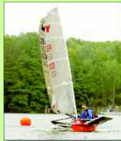
Der Stienitzsee ist ein regelrechtes Segelparadies

besten Bedingungen für das Gelingen der Meisterschaft geschaffen. Leider gab es keine Rüdersdorfer Erfolge zu feiern. Ein weiteres sportliches High-light: Im Rüdersdorfer Kulturhaus fanden die diesjährigen Landeseinzelmeisterschaften im Schnellschach statt. Nicht zu vergessen sind die Volleyballer des SV Glück Auf Rüdersdorf, die bereits zum