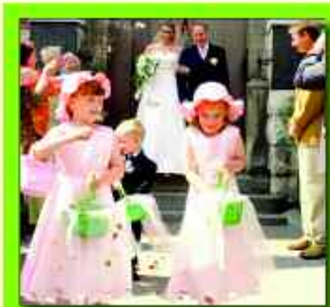
Hochzeit in Rüdersdorf bei Berlin

Ganz anders, aber mindestens ebenso attraktiv, ist eine Eheschließung im Rathaus der Gemeinde Rüdersdorf bei Berlin. Das denkmalgeschützte Foyer des Hauses ist zudem behindertengerecht ausgebaut. Der Raum, der allerdings nur für einen kleinen Besucherkreis gedacht ist, befindet sich im Erdgeschoss des Rathauses. Der verbindende Moment wird in dem wunderschönen Gebäude unvergesslich.