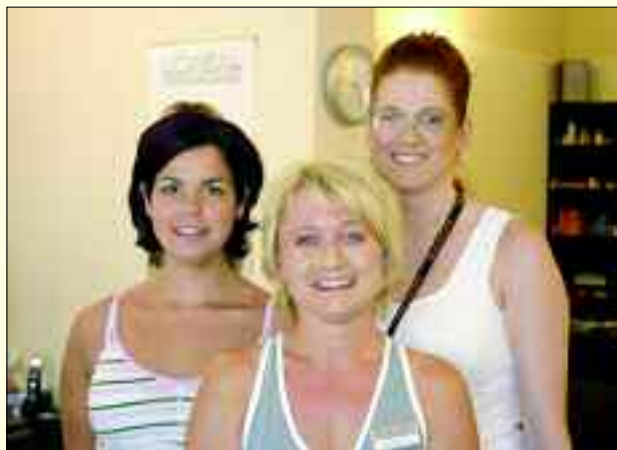
Das Team der neuen Hennickendorfer Filiale

Zum Angebot gehören die Produkte von L'ORÉAL sowie die dekorative Kosmetik von Alcina, dazu gehört speziell auch das professionelle Make up für besondere Anlässe. „Es können kurzfristige Termine vergeben werden. Also ein Tipp für Schnellentschlossene!