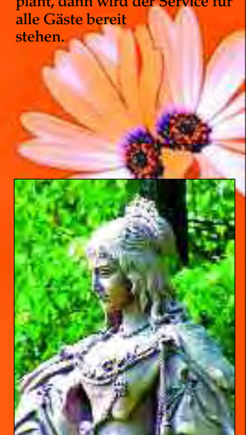
Louise-Henriette von Oranien

die zentrale Datenbank Brandenburg für September geplant, dann wird der Service für alle Gäste bereit stehen.