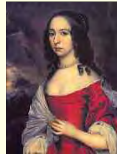
Gemälde von Louise Henriette von Oranien-Nassau – Namensgeberin der Stadt Oranienburg

Wie viele Orte in der Mark Brandenburg erhielt auch Oranienburg seinen heutigen Namen Jahrhunderte nach seiner Gründung. Ursprünglich ist die Stadt aus einer slawischen Siedlung entstanden und trug den Namen Bothzowe, später Bötzow. Aber wie wurde aus Bötzow Oranienburg? Durch eine Frau – Louise Henriette von Oranien. Sie wurde am 27. November 1627 in Den Haag geboren und war die erste Tochter des niederländischen Prinzen Friedrich Heinrich von Oranien und seiner Frau Amalie von Solms-Braufels. Mit Sicherheit hatte sie eine unbeschwerte Kindheit, denn die Familie der Oranier war sehr wohlhabend und in der niederländischen Gesellschaft sehr angesehen. Mit 19 Jahren heiratete sie Friedrich Wilhelm Kurfürst von Brandenburg. Der Große Kurfürst war sich der besonderen Stellung der Oranier bewusst und erhoffte sich durch die Heirat von Louise Henriette das politische Ringen um Pommern für sich entscheiden zu können. Louise Henriette gebar nach einigen Fehlgeburten sechs Kinder, von denen nur Friedrich den Vater überlebte und somit das Erbe antre-