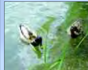
Auch sie fühlen sich wohler