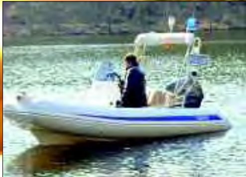
Klein, schnell und wendig