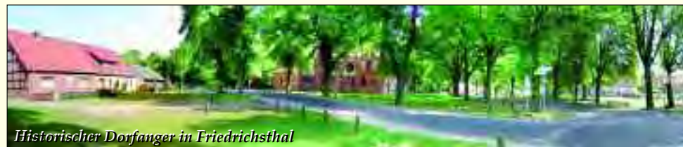
Historischer Dorfanger in Friedrichsthal

einen Schulze lebten. Durch den Bau des zweiten Finowkanals änderte sich auch das Tätigkeitsfeld der Malzer. 1826 wurde der Malzer Kanal gebaut, um verschiedene Waren schneller und einfacher nach Liebenwalde zu befördern. Bis heute hat Malz seinen Charme als Schifferdorf nicht verloren. Besonders für Angler sollte dieser idyllische Ort ein Paradies sein.