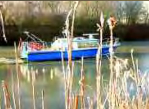
Eisfahrt mit einem Typ-1-Boot

der Zugmaschine zur Verfügung. Um bei der WSP den Dienst aufnehmen zu können muss zuerst eine normale polizeiliche Ausbildung absolviert werden. Erst dann kann man an einer drei monatigen Spezialausbildung in Hamburg teilnehmen um schließlich auf dem Wasser tätig zu werden. Es ist ein langer Weg, aber es lohnt sich diesen zu gehen. Dennoch – wilde Verfolgungsjagden mit Piraten werden auch in Zukunft nicht auftreten.