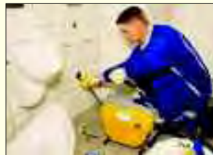
Die Mitarbeiter bei RUN 24 lösen Probleme fachmännisch

anlagen sowie die Erstellung von Dichtheitsgutachten. Mit seinem 24-Stunden-Notdienst bedient das Unternehmen jedoch nicht nur Kommunen und die Industrie. Auch Kleinstaufträge aus dem privaten Bereich, und sei es nur eine Rohrverstopfung, werden zuverlässig ausgeführt. „Zudem haben wir beschlossen, in diesem Jahr erstmals zwei Ausbildungsplätze anzubieten. Ab August bilden wir in den Berufen Kauffrau/-