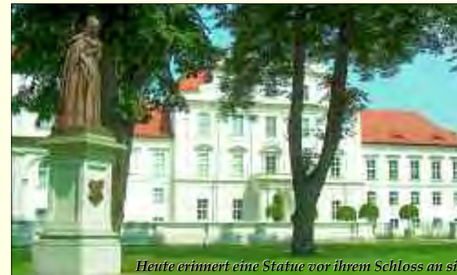
Heute erinnert eine Statue vor ihrem Schloss an sie