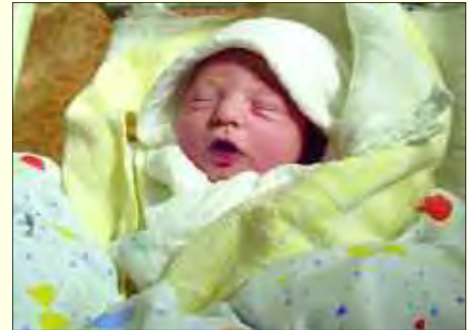
Sind die Kleinen erst einmal da, ist alles Andere um uns vergessen