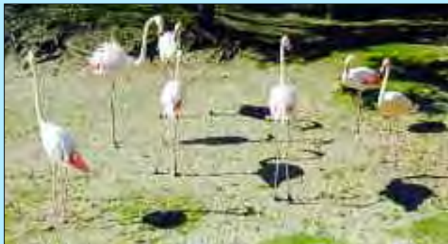
Auch die Flamingos haben neben jeder Menge einheimischer Tierarten im Tier- und Freizeitpark Eichholz ein Zuhause gefunden

Viele verschiedene Tierarten findet man im Tier- und Freizeitpark in Germendorf, nordöstlich von Berlin direkt an der B 273 und B 96a Oranienburg gelegen. Der Weg durch die schöne Seenlandschaft führt vorbei an den Tiergehegen mit den exotischen und einheimischen Bewohnern sowie einer Spielplatzanlage mit Minibike und Autoscooter. Seit 2000 wurde