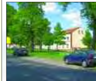
Alte Gebäude in Wensickendorf