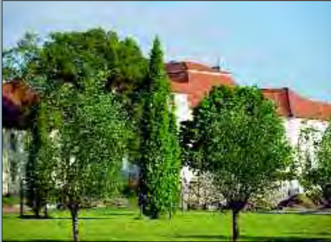
Zur LAGA 2009 wird es auf dem Gelände farbenreich blühen

Wenn am 25. April 2009 in Oranienburg die vierte Brandenburger Landesgartenschau beginnt, erwartet die Besucher unter dem Motto „Traumlandschaften einer Kurfürstin“ eine gärtnerische Verbeugung vor der wichtigsten Frau in Brandenburgs Geschichte: Louise Henriette, niederländische Prinzessin und Gemahlin des Großen Kurfürsten, dem Begründer der preussischen Monarchie. Ohne Louise Henriette gäbe es Oranienburg nicht. Als sie kurz nach dem Ende des Dreißigjährigen Krieges in den damals noch Bötzw genannenen Ort kam, gab der Umbau des