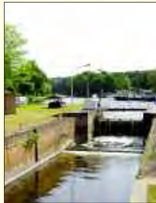
Die Schleuse in Malz