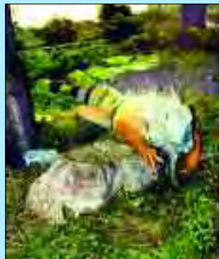
Hier warten viele exotische Bewohner darauf, von den Besuchern entdeckt zu werden

kleinen Hunger zwischen-durch, bieten mehrere Imbisse eine große Auswahl an Snacks und Getränken. Idyllische Strände laden zum Baden und Verweilen ein und bei schönem Wetter sind auch die Grillplätze gut besucht. Für die vierbeinigen Freunde ist ein separater Hundebadestrand vorhanden. Übrigens: die gesamte Anlage ist behindertengerecht gestaltet!