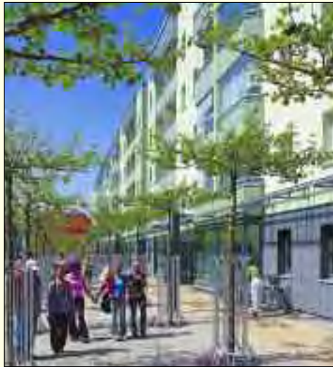
Der Boulevard in der Oranienburger City – mit vielen Geschäften in den modernisierten WOBA-Häusern lädt er zum Bummeln ein

Die Wohnungsbaugesellschaft mbH Oranienburg (WOBA) ist ein Unternehmen der Stadt Oranienburg. Sie wurde im Jahre 1990 gegründet. Sie verwaltet, vermittelt und schafft Wohnraum, in dem sich die Mieter auf Dauer wohl und gut aufgehoben fühlen. Wichtig ist ihr dabei eine vertrauensvolle Partnerschaft mit den Mietern. An vielen Standorten in Oranienburg hat die WOBA bereits deutliche Zeichen gesetzt. Gemeinsam mit regionalen Baubetrieben und anderen Dienstleistern hat sie in den vergangenen Jahren einen Großteil ihrer bestehenden Immobilien saniert und ein angenehmes Wohnumfeld geschaffen. Im Bereich der altengerechten Wohnungsversorgung verfügt sie über ein besonderes Angebot für Senioren. Wohnungssuchende informieren sich am besten im Internet auf www.woba.de über das aktuelle Wohnraumangebot.