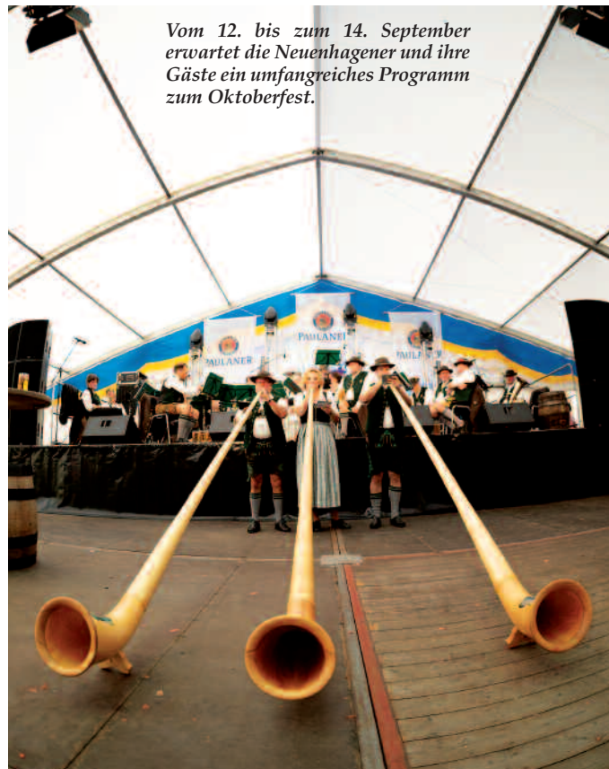
Vom 12. bis zum 14. September erwartet die Neuenhagener und ihre Gäste ein umfangreiches Programm zum Oktoberfest.

gelstraße. Von 10 bis 14 Uhr kann jeder seinen „Grünen Daumen“ zeigen oder sich Anregungen holen. Darüber hinaus stehen auch in diesem Jahr wieder der Tag der Familie am 28. Juni, der Tag des offenen Denkmals am 14. September sowie das große Halloween-Spektakel am Marktplatz Bolensdorf auf dem Plan. Wer sich auf dem Laufenden halten will, sollte die Internetseite der Gemeinde www.neuenhagen-bei-berlin.de nutzen. Dort ist ein Veranstaltungskalender eingerichtet.