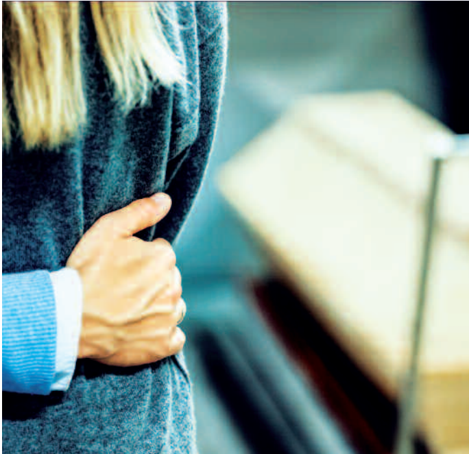
Das Bestattungshaus D. Schulz ist bekannt für seinen einfühlsamen Beistand in schweren Stunden.