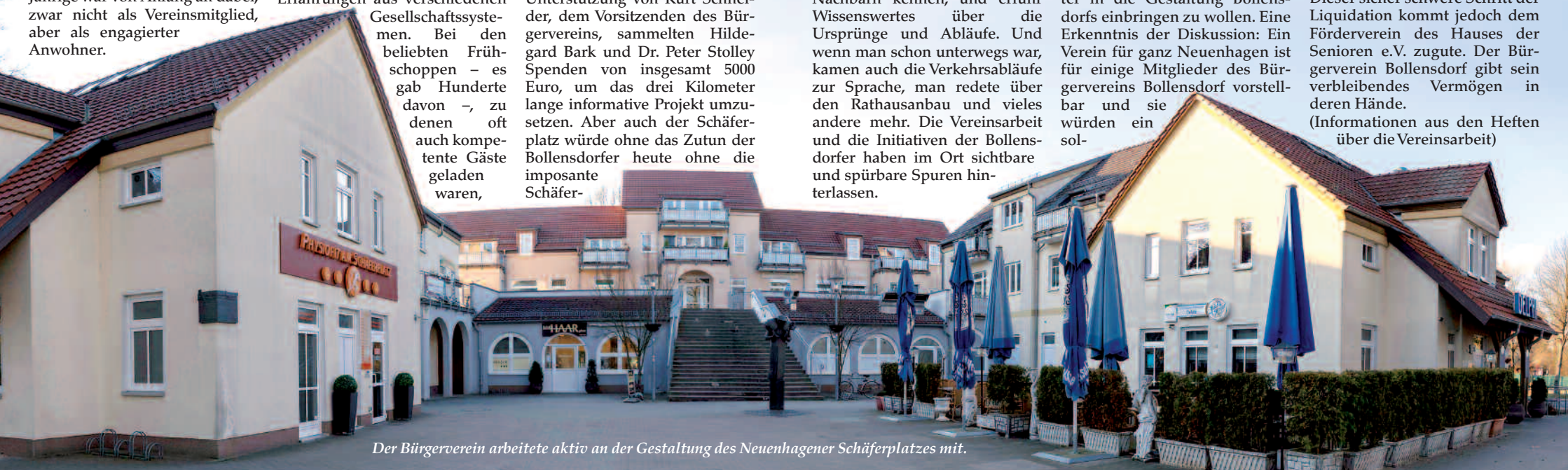
Der Bürgerverein arbeitete aktiv an der Gestaltung des Neuenhagener Schäferplatzes mit.

(Informationen aus den Heften über die Vereinsarbeit)