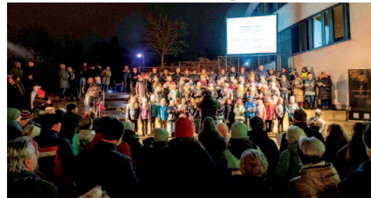
Auch das wird es sicherlich im Jahr 2025 wieder geben: das traditionelle Weihnachtssingen vor dem Rathaus.

Im Mittelpunkt, und die Vorbereitungen laufen längst auf Hochtouren, steht auch in diesem Jahr wieder das Oktoberfest. Drei Tage (vom 12. bis 14. September) gibt es wieder ein volles und buntes Programm. Bereits zum 33. Mal wird auf dem Platz der Republik gefeiert. Punkt 12 Uhr wird am 13. September das Fass mit dem Festbier angestochen. Übrigens: Am 5. Oktober 1991 gab es die Premiere: das 1. Neuenhagener Oktoberfest, das auf Anregung der Bürgerinitiative Grünwald für Neuenhagen e. V. gemeinsam mit dem Freundeskreis Neuenhagen-Grünwald e. V. veranstaltet wurde. Allerdings hat Neuenhagen viel mehr zu bieten. Am 29. März von 9 bis 13 Uhr wird es einen Frühjahrsputz zusammen mit der NABU-Ortsgruppe geben.