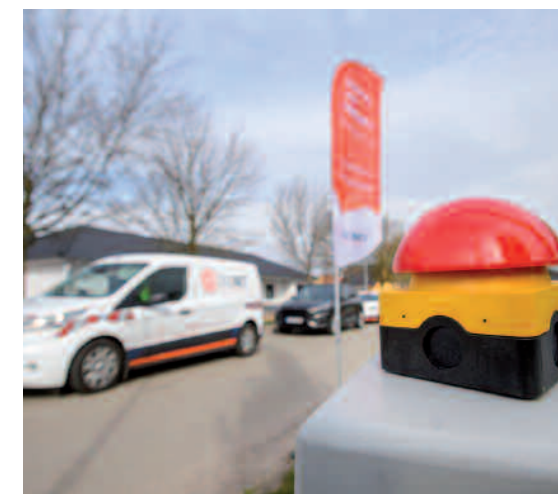
Aufbau von Technikstandorten in ganz Brandenburg – Transport der Technikverteiler.