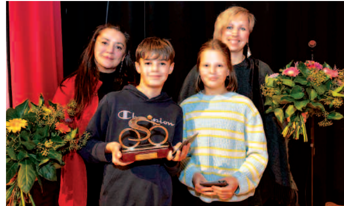
Ehrung für die Schüler der Grundschule am Schwanenteich.

gebeten wurden, ging es aber nicht um ein Ehrenamt. Die Fünftklässler aus der Grundschule am Schwanenteich nahmen stolz einen eigens für ihre Schule angefertigten Pokal entgegen. Sie hatten mit 198 Mitschülerinnen und Mitschülern beim diesjährigen Stadtradeln – vor der Strausberger Hegermühlengrundschule – mit 14 853 Kilometern an 21 Tagen den ersten Platz belegt.