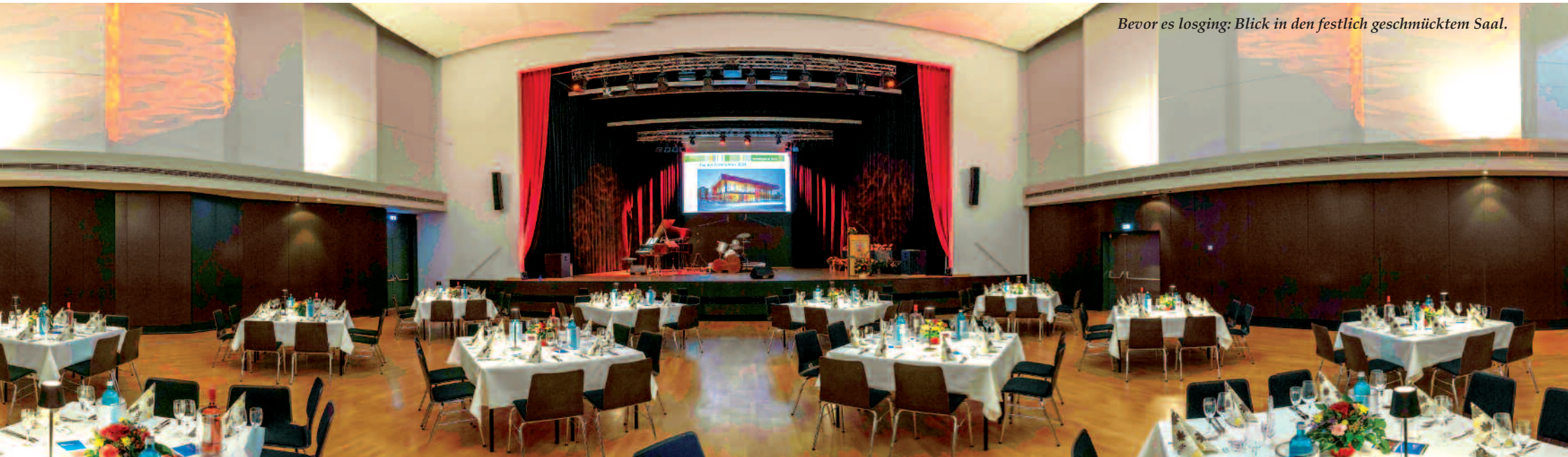
Bevor es losging: Blick in den festlich geschmücktem Saal.

Der festliche Abend klang mit einem leckeren Buffet und Musik der Band Jazz Royal und vielen lebhaften Gesprächen an den Tischen aus.