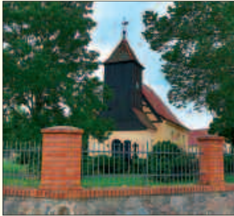
Die Dorfkirche Sankt Anna zu Löwenbruch ließ 1716 der Gutsherr Achatz von Alvensleben an Stelle eines Vorgängerbaus errichten.

Der Name Löwenbruch hat ursprünglich keine Beziehung zum Tier Löwe, auch wenn das Wappen am Feuerwehrhaus einen Löwen zeigt und steinerne Löwen vor verschiedenen Häusern stehen. Der Name ist ein so genannter Flurname und bedeutet so viel wie tiefes Bruch. Der Wortbestandteil „bruch“ steht für das Bruchgebiet als feuchtes, sumpfiges Gelände. „Löwen“ ist eine abgeleitete Form aus dem Mittelniederdeutschen mit der Bedeutung Gehölz, Busch, Waldwiese, Waldaue oder eben Ackerstück, wo früher Wald gestanden hat. Die Landschaft des landwirtschaftlich orientierten Ortes ist von einer Niederung mit Wiesen, Kanälen, Seen und Bruchwäldern geprägt. Die Dorfgeschichte prägen im späten Mittelalter und in der Neuzeit bis in das 20. Jahrhundert märkische Uradels- und Adelsfamilien. In dieser Zeit hatte Löwenbruch eine größere Bedeutung als der heutige Hauptort Ludwigsfelde.