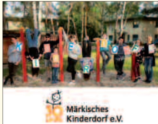
Märkisches Kinderdorf e.V.

Mitten im Zentrum von Ludwigsfelde und doch im Grünen bietet das Märkische Kinderdorf seit 31 Jahren bis zu 45 Kindern und Jugendlichen ein Zuhause auf Zeit. Insgesamt verfügt die Einrichtung über fünf familienanaloge Wohngruppen, zwei Jugendwohngemeinschaften und dem Übergangswohnen. Jedes der einzelnen Häuser ist eine abgeschlossene Erziehungseinheit und beherbergt jeweils eine Gruppe, in der Kinder und Jugendliche die entsprechende Zuwendung, Geborgenheit und Hilfe von sozialpädagogischen und therapeutischen Fachkräften erhalten. Aufgenommen werden Mädchen und Jungen, die aufgrund von familiären Belastungs- und Konfliktsituationen vorübergehend nicht bei ihren Eltern leben können. Der Erhalt des Elternhauses und die Rückführung der Kinder und Jugendlichen ist dabei erklärtes Ziel. Die Vermittlung von eigenem Wohnraum ist die Alternative, wenn eine Rückkehr nicht möglich wird.