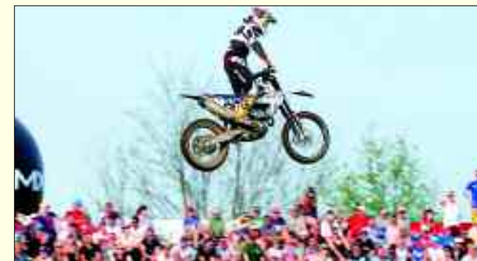
Motocross hat eine gute Tradition in Fürstlich Drehna.

Geburts-Jahrgänge von 1997 bis 2004 mit bis 250 ccm Zwei- oder Viertakt-Maschinen sowie der ebenfalls altbewährte ADAC MX Junior Cup für Jugendliche der Jahrgänge 2003 bis 2008 und 85-ccm-Zweitaktern kam die Klasse ADAC MX Junior Cup 125 in diesem Jahr neu hinzu.