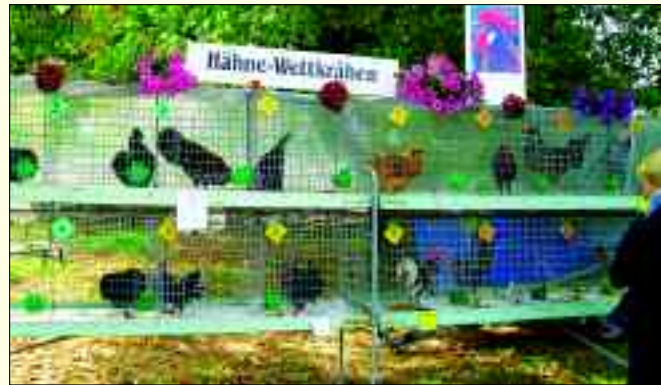
Hähne-Wettkrähen beim Erntefest 2017

Des Öfteren hört man, dass Vereine vor allem Nachwuchsprobleme haben. Wie sieht es bei Ihnen aus?