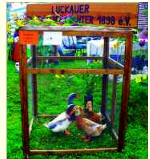
Werbeschau des Vereins zum Erntedankfest

Vielen Dank für das Gespräch und weiterhin viel Erfolg.