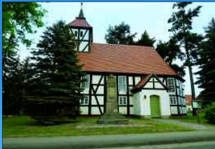
Sehenswert in der kleinen Fachwerkkirche ist der historische Innenraum.

gebiet entstanden. Neben diesem wurde im Dezember 2004 die Justizvollzugsanstalt Luckau-Duben ihrer Bestimmung übergeben. Im Gemeindeteil Alteno befindet sich ebenfalls ein Industriegebiet, welches eine Photovoltaik-Freiflächenanlage beinhaltet. Urprünglich gab es dort einen Fliegerhorst, der im Zweiten Weltkrieg von der Wehrmacht und später von der NVA genutzt wurde. Der kleine Gemeindeteil Kaden wurde bereits 1345 urkundlich erwähnt und liegt direkt nördlich von Duben an der Autobahn. Dass der kleine Ort früher eine größere Bedeutung gehabt hat, wird klar, wenn man erfährt, das hier einmal gleich zwei Windmühlen gestanden haben. Bauern aus Alteno errichteten 1613 „Frei im Felde“ nördlich von Alteno eine Schäferei mit Wohngebäude, Stall, Scheune und Brunnen,