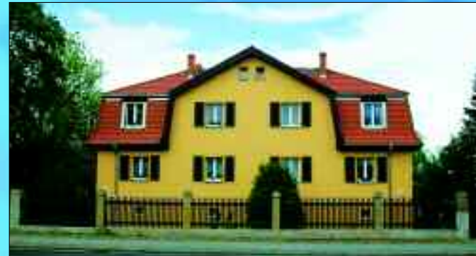
Beispiele für die Komplettanierung von Häusern nach Leerstand: oben Calauer Straße 24, links Lange Straße 32

Wohnungsbau- und Verwaltungsgesellschaft mbH Hauptstraße 24 15 926 Luckau Tel. 0 35 44/5 01 00 Fax 0 35 44/5 0 10 13 www.wobau-luckau.de