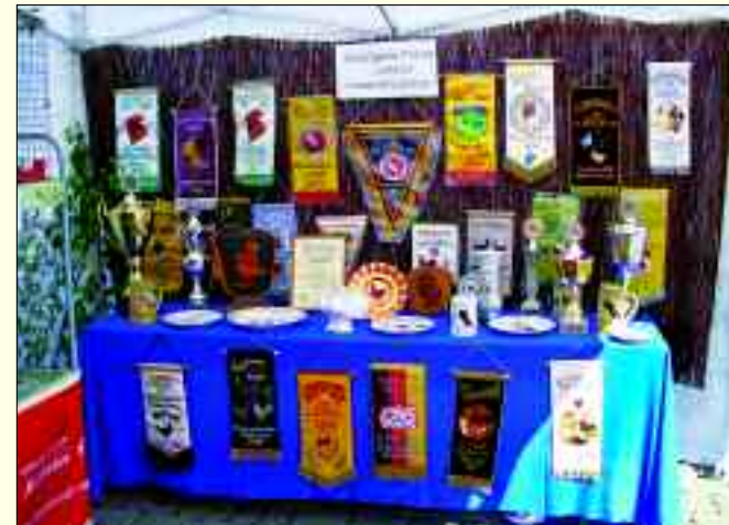
Die Trophäensammlung des Vereins ist beeindruckend.

In unserem Verein haben wir eine Vielzahl von Geflügelrassen. Beim Groß- und Wasser- geflügel haben wir eine Putenzucht und eine Zucht Sachse- nenten. Unser Bestand an großen Hühnerrassen beschränkt sich auf Barnevelder, Vorwerkhühner, Seidenhühner und Thüringer Barthühner. Zwerghühner sind schon stärker vertreten, da diese einen geringeren Platzbedarf erfordern und leichter zu handhaben sind. So haben wir folgende Rassen in den Beständen: Federfüßige Zwerg- hühner, Zwerg-Amrocks, Zwerg-Rhodeländer, Zwerg- Welsumer, Zwerg-Australorps, Zwerg-Barnevelder und