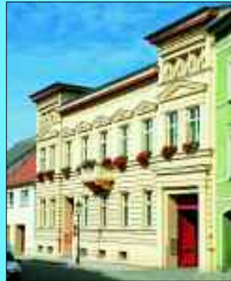
Sitz der Wohnungsbaugesellschaft in der Hauptstraße 4

Die Erstellung und Erhaltung von komfortablem und bezahlbarem Wohnraum in Luckau und Umgebung zeichnet die Wohnungsbaugesellschaft der Stadt schon seit 27 Jahren aus. Damit übernimmt das Unternehmen eine wichtige Rolle bei der Wohnraumversorgung im Rahmen der Daseinsvorsorge der Kommune. Die Wohnungsbaugesellschaft versucht mit attraktiven Wohnungen der Wohnstandort Luckau weiter zu