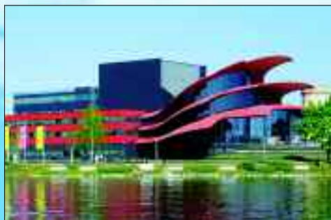
Beredtes Beispiel für Erfolg am Bau – das Hans-Otto-Theater in Potsdam.