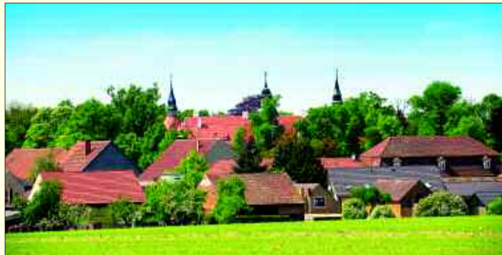
Blick auf die bezaubernde Silhouette von Fürstlich Drehna.

fahren gebraut. Und natürlich gilt auch das Deutsche Reinheitsgebot, das aus dem Jahre 1516 stammt. Im April 1516 trat der Bayerische Landständetag unter Vorsitz von Herzog Wilhelm IV. in Ingolstadt zusammen. Dieses Gremium billigte eine vom Herzog vorgelegte Vorschrift, dass zur Herstellung