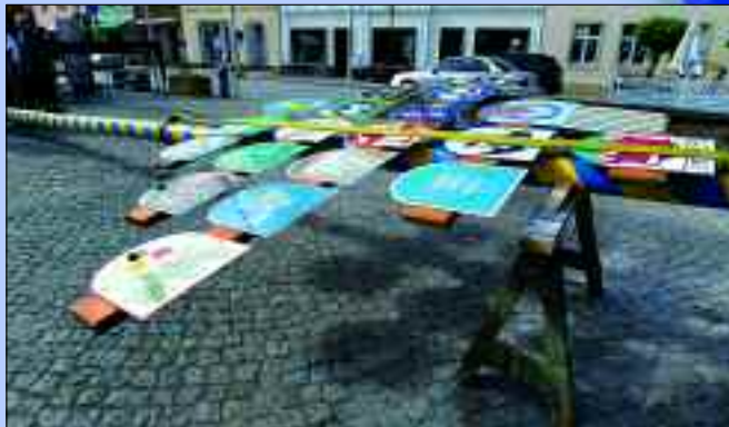
Auf dem Maibaum sind Handwerker mit ihren Wappen vertreten – der Verein würde sich über eine noch stärkere Beteiligung freuen.

denen sich Vereine einquartieren und mit allerlei köstliche Spezialitäten aufwarten. Der Luckauer Weihnachtsmann steigt aus dem Roten Turm herab – das ist jedes Jahr ein mit größter Spannung erwartetes Spektakel für die Kinder. Bühnenprogramme laden zum Zuschauen und Mitmachen ein und das Bastel- und Märchenzelt hat magische Anziehungskraft. Wenngleich der Verein recht erfolgreich arbeitet, bleibt dennoch viel zu tun. Priorität hat die Erkenntnis, die Kunden und Besucher der Stadt möchte nicht mehr nur die bloße Einkaufsmöglichkeit, sie suchen das Innenstadterlebnis. Sie wollen die Identität einer Kleinstadt wie Luckau erleben und erfahren. Sie wollen sich in schöner gepflegter Umgebung aufhalten, unkompliziert etwas speisen oder trinken und möchten schnelle, einfach erreichbare Informationen. Der Aufgabe, dass die Besucher und Kunden hier in Luckau ihr „Wohlfühlerelebnis“ bekommen, hat sich der Verein gestellt. Mut und Ausdauer bei der Umsetzung bleiben aber eine Herausforderung.