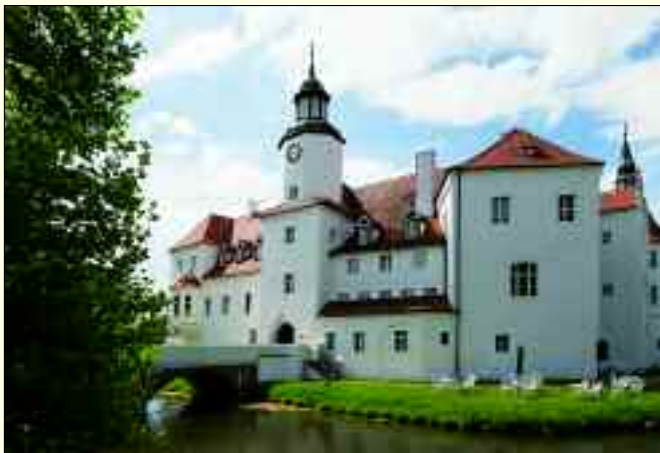
Das über 500 Jahre alte Schloss Fürstlich Drehna – nun ein Hotel.

Vieles hat man im Ort so belassen und sehr liebevoll sowie detailgetreu restauriert. Wie zum Beispiel die Zufahrt zum markanten Schlosshotel. Vorbei an imposanten Hirschskulpturen, fährt der Besucher durch eine Allee auf den Lindenplatz, von wo aus sich ein freier Blick auf das über 500 Jahre alte, von einem Wassergraben umgebene Schloss bietet. Eigentlich ist die Durchfahrt mit dem Auto viel zu schnell erledigt. Bevor man hier entlang fährt, oder wie gesagt besser läuft, lohnt der Blick über den Marktplatz. Die Kirche und das Gasthaus „Zum Hirsch“ machen diesen Platz markant.