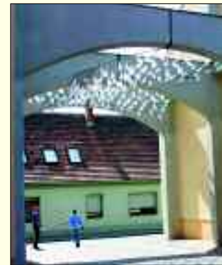
Alice Bahra: „Netzwerk“

bewegliche Installation geschaffen, die sich als Metapher für die Verbindung zwischen dem traditionellen Handel der Vergangenheit und dem allgegenwärtigen Online-Handel, den blitzartigen Austausch von Ideen rund um den Globus und die damit verbundene Mobilität versteht.