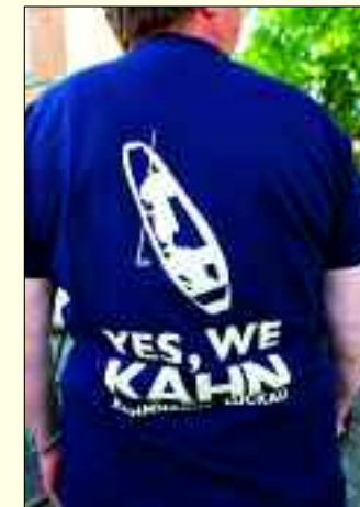
„Yes, we Kahn“