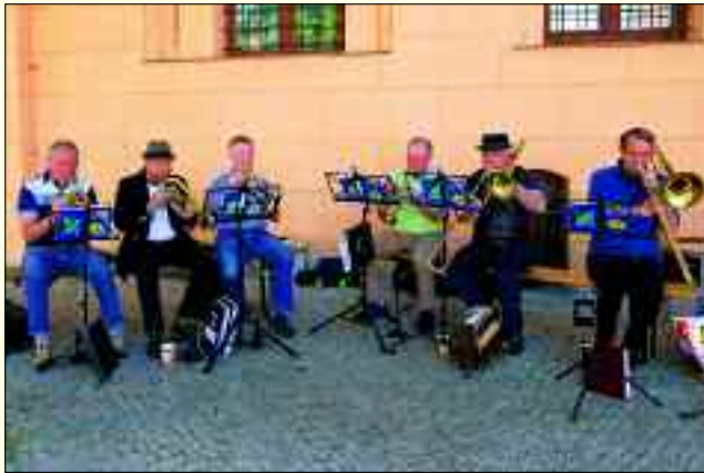
Der 1961 gegründete Posaunenchor Gießmannsdorf ist ein gern gesehener Gast auf den Veranstaltungen in und um Luckau.

Knapp 200 Jahre sollte das Kloster bestehen bleiben, bevor die letzten Mönche nach der Reformation es verließen oder starben. Das Gebäude wurde vom böhmischen König Maximilian II. an die Stadt Luckau übergeben, die es aber auch nach 200 Jahren keinem Nutzen zuführen konnte. Erst als die Stadt es der Landesregierung des Markgrafentums Niederlausitz, den „Ständen“, verkaufte, erhielten die Gebäude des ehemaligen Klosters einen neuen Zweck. Es wurde zu einem Zucht- und Armenhaus. Hier brachte man neben Armen und Züchtlingen auch Geistesranke, Waisen und alte Menschen unter. Das Gefängnis blieb bis 2005 bestehen, zuletzt als Frauen- und Untersuchungshaftanstalt. Mit dem Umbau zur Kulturkirche fand neben der Ninnemann-Stiftung, verschiedenen Vereinen und dem Tourismusverband Niederlausitzer Land e. V. auch das Niederlausitz-Museum 2008 ein neues Zuhause.