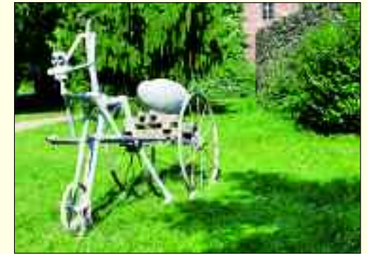
Steffen Mertens „Troika impossibile“

Ausdruck menschlicher Kunstfertigkeit vertraut erscheinen.