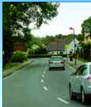
Duben ist schnell durchfahren, doch ein Stopp an der Kirche lohnt sich.

also ein so genanntes Vorwerk. In der Mitte von Duben fällt die Kirche auf, die seit 1820 ein Filial von Terpt, was damals dem Kreis Calau zugehörig war, ist.