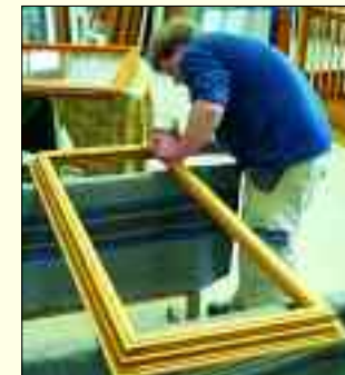
Präzision ist bei der Herstellung eines Fensters wichtig.