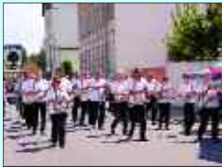
Mit Pauken und Schalmeien wurde das Maifest eingeleitet