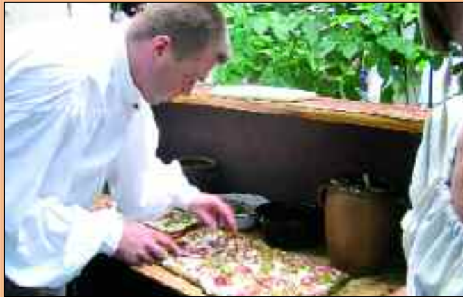
Im Dorf 1813 gibt es natürlich auch Verpflegung, die der Tradition entspricht

Liebertwolkwitz? Ist das nicht das Dorf, auf dessen Territorium vor den Toren Leipzigs 1813 die Völkerschlacht besonders heftig tobte? Der Ort, wo alljährlich Hunderte historisch Uniformierte unter den gespannten Blicken zahlreicher Gäste diverse Gefechte der Napoleo-