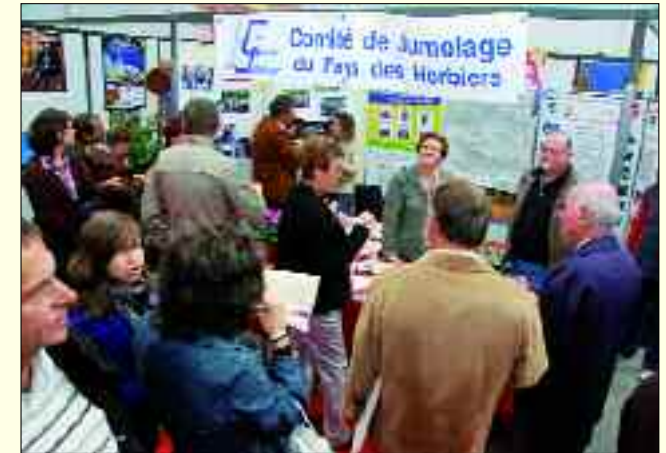
Die deutsch-französischen Treffen in Wolks – damals noch wegen des Krieges, Heute wegen herzlicher Freundschaft

Wenn nun zum Heimatfest am ersten Juliwochenende 2011 wieder zahlreiche Gäste aus der französischen Partnerregion nach Sachsen kommen, erwartet sie nicht nur ein abwechslungsreiches Besuchsprogramm, sondern auch eine sehr persönliche