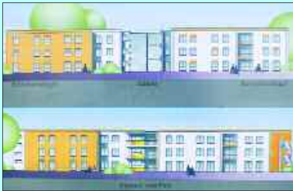
Das Bauvorhaben der AWO – ein Sozialzentrum

Weil Leipzig es bis heute nicht gelernt hat, mit den zugewonnenen Randgemeinden zu leben und diese differenziert zu