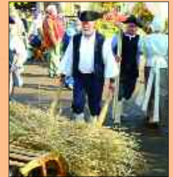
Selbst die Alltagsgegenstände, wie diese Schubkarre, werden nicht durch neuere ersetzt

Webseite: www.liebertwolkwitz-1813.de – oder kommen Sie vom 21. bis 23. Oktober 2011 nach Liebertwolkwitz und überzeugen sich selbst.