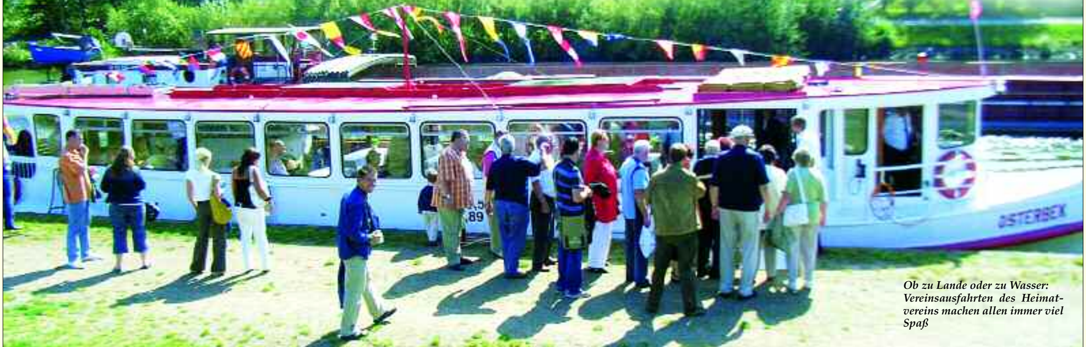
Ob zu Lande oder zu Wasser: Vereinsausfahrten des Heimatvereins machen allen immer viel Spaß

etwa 70 km lange Tour vorbereitet, auf der bestimmte Aufgaben gelöst werden müssen. Kleiner Tipp: Die Windräder entlang der Strecke sind wohl in diesem Jahr wieder nicht zählbar... Versprochen ist jedoch, dass auch 2011 auf das beste Team wieder ein hochwertiger Wochenend-Hotelgutschein für zwei Personen wartet. Am 3. Advent, lädt der Heimatverein traditionell zum Weihnachtsmarkt in der Scheune ein. Neben diesen Höhepunkten für alle Wolkser und ihre Gäste sorgt der Verein auch für vereinsinterne Veranstaltungen, wie Exkursionen und im Herbst das Schlachtfest. Es ist ganz deutlich: Für Mitglieder des Liebertwolkwitzer Heimatvereins ist Langeweile ein Fremdwort!