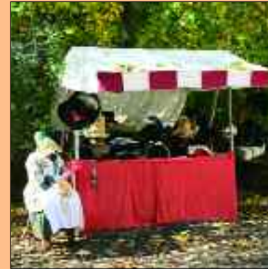
Hier kann man sich eine Originalgetreue Kopfbedeckung ergattern