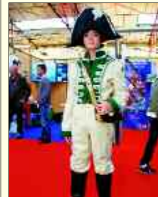
Der kleine Napoleon glänzt mit seiner Uniform, ganz wie damals