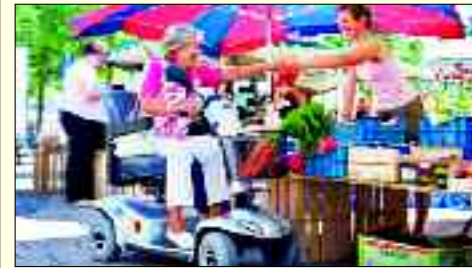
Wann testen Sie einmal dieses neue Gefühl der Unabhängigkeit im Alter?