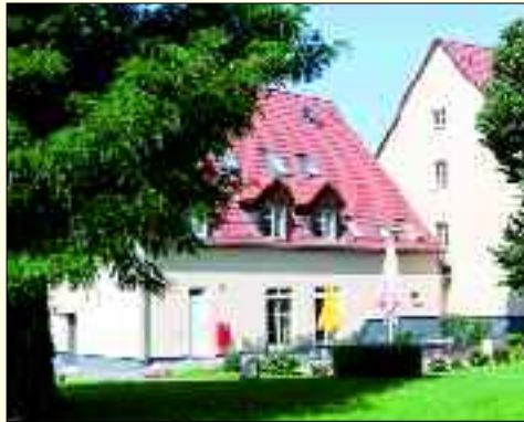
Alles in allem ist die Pension Völkerschlacht 1813 eine Unterkunft in der es einem, trotz des historischen Namens, an nichts fehlt

Wo vor knapp 200 Jahren entscheidende Kämpfe der Völkerschlacht tobten, können heute bis zu 56 Gäste ihr müdes Haupt zur Ruhe betten. Das mit viel Liebe zum historischen Detail eingerichtete 3-Sterne Garni