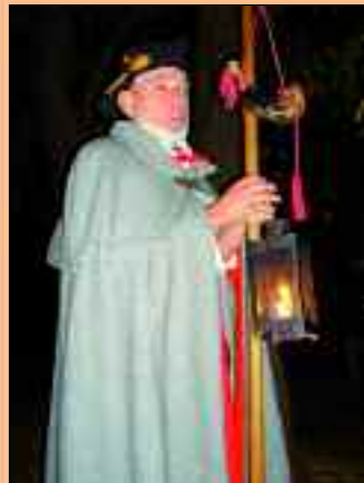
Sobald es dunkel geworden ist, kann man mit dem einheimischen Nachtwächter eine Runde durch das Dorf drehen