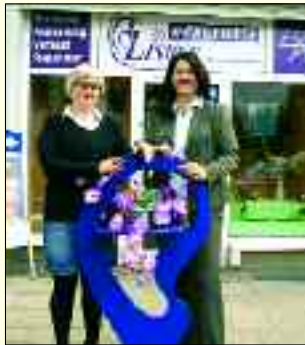
Überzeugend durch Qualität