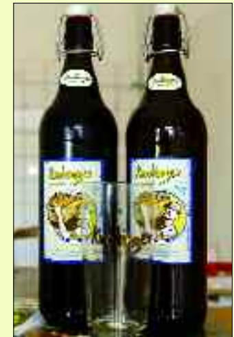
Jüterbogger Bier nach dem Deutschen Reinheitsgebot.