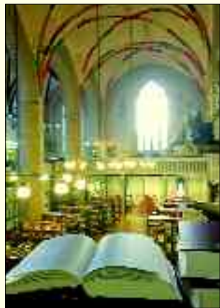
Im Mönchenkloster feiert die Bibliothek Jüterbog am Samstag, 12.11.2016 mit einer „Langen Nacht in der Bibliothek“ ihren 140. Geburtstag.

Stadtinformation Jüterbog Möchenkirchplatz 4 14913 Jüterbog Tel. 0 33 72/ 46 31 13 stadtinformation@jueterbog.de www.jueterbog.eu