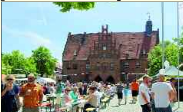
Jüterbog, die Hauptstadt des Flämings, ist eine Reise wert.

Als Träger des Europäischen Kulturerbesiegels ist Jüterbog einer der wichtigsten Schauplätze der Reformation. Mehrfach wurde in der über 1.000 Jahre alten Stadt Geschichte geschrieben. Noch heute kann in der Nikolaikirche der berühmte Tetzl-Kasten besichtigt werden, in dem die Erlöse aus dem Ablasshandel aufbewahrt wurden. Eben jener Ablasshandel des Mönchs Tetzl aus Jüterbog war es, der Luther öffentlich aufbegehren ließ. Auch der wertvolle Cra-