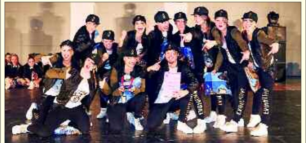
Die Sieger des JazzDancePokal, Kategorie HipHop 2015: Evolution7 aus Jüterbog.

Wir sind wieder beim DDP-Cup vertreten, wo wir 2012 den 1. Platz holten. Des Weiteren möchten wir uns bei der Norddeutschen UDO HipHop Meisterschaft für die Deutsche, die Europäische und wenn möglich, sogar für die Weltmeisterschaft dieser Urban Dance Organisation (UDO) qualifizieren. Und da haben wir keine so schlechten Karten, sind wir doch schon zweimal Sieger der Ostdeutschen DTHO HipHop und Videomeisterschaft geworden. Ein weiteres Highlight wird in diesem Jahr die Teilnahme an den Berliner Streetdancemeisterschaften werden, denn dieses Jahr starten wir in der Kategorie Profis. 2014 und 2015 hatten wir hier in der Kategorie Fortgeschrittene jeweils den zweiten Platz geholt.