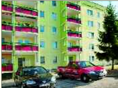
Helle, freundliche Wohnungen der Genossenschaft „Frohes Leben“ eG in JüTerbog

Familiengerechte, günstige Wohnungen in attraktiven Lagen: In Jüterbog denkt man da sofort an die Wohnungsbaugenossenschaft „Frohes Leben“. Knapp 900 weitestgehend sanierte Wohnungen hat das Unternehmen in Jüterbog, Kloster Zinna und Treuenbrietzen in seiner Verwaltung. Seit der Gründung 1956 hat sich das Unternehmen stark gewandelt, gerade steht sozusagen ein Generationswechsel an. Junge Familien beleben die Quartiere, erfreuen sich an den zahlreichen gewachsenen Einrichtungen und den Modernisierungs- und Sanierungsmaßnahmen der vergangenen Jahre. Doch auch die Interessen der Gründungsgeneration stehen weiter im Fokus des Vorstands, der solidarische Ansatz wird hier gelebt. So kann beispielsweise die Gästewohnung bei entsprechender Nachfrage für Spielnachmittage, zum gemeinsamen Häkeln, Stricken, Lesen oder zum Gedächtnistraining genutzt werden. Dazu gibt es auch eine Reihe altersgerechter, barrierearmer Wohnungen. Mieterfeste, eine gelebte Nachbarschaft und eine Verwaltung, die für die Sorgen und Be-