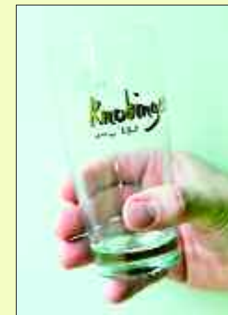
der Knobinger Willybecher.