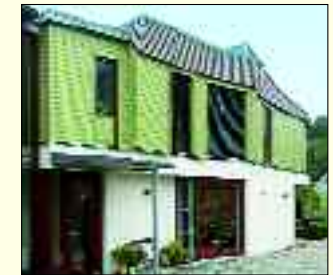
Attraktive Beispiele von Poltermann Architektur.Design

Wünsche ein und entwickelt im Dialog mit den Auftraggebern die entsprechende maßgeschneiderte Lösung. Am liebsten arbeitet er umfassend, vom Bau bis zum Möbel. Unverwechselbarkeit gepaart mit Funktionalität und Wirtschaftlichkeit ist sein Markenzeichen. Für Bauherren bietet er einen Service vom ersten Entwurf über die komplette Planung bis zur Bauüberwachung.