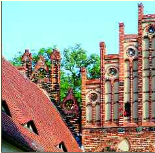
Sehenswerte Details der Backsteingotik am Abts- und am Siechenhaus im Zisterzienserkloster Zinna.

Noch heute kann in der 1488 geweihten Nikolaikirche der Tetzl-Kasten besichtigt werden, in dem die Erlöse aus dem Ablasshandel aufbewahrt wurden. Eben jener Ablasshandel des Mönchs Tetzl aus Jüterbog war es, der Luther öffentlich aufbegehren ließ. Neben der Nikolaikirche stammen auch das mächtige Rathaus und das einstige Franziskanerkloster, das Mönchenkloster, aus der Zeit der Backsteingotik. Gemeinsam mit Jüterbog trat das nah gelegene ehemalige Zisterzienserkloster Zinna in die Europäische Route der Backsteingotik ein. Hier kann man anhand der beiden direkt hintereinander stehenden Abts- und Siechenhäuser sehen, wie sich der Baustil der Backsteingotik im Laufe von 100 Jahren verfeinerte.