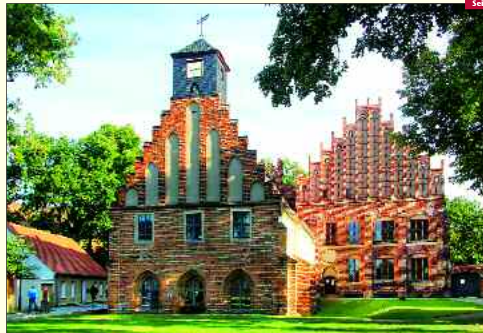
Das Abtshaus und das Siechenhaus in Kloster Zinna sind besonders schöne Beispiele für die Entwicklung der Backsteingotik und jetzt auch Teil der gleichnamigen Europäischen Route.

Das Neumitglied Jüterbog ist der südlichste Reisepunkt des Städtetzwerks. Durch seine Stadtgeschichte ist Jüterbog besonders eng mit der Reformation verbunden.