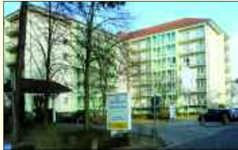
Helle und moderne Zimmer im Senioren-Wohnpark Hennigsdorf

Der Senioren-Wohnpark Hennigsdorf ist auf die Betreuung und Pflege alter Menschen spezialisiert. Professionelle Förderung gibt es in einer Wohngruppe für Betroffene neurologischer Krankheitsbilder wie Schlaganfall, Hirnbluten oder Multiple Sklerose. Ein spezielles Konzept für demente Menschen und eine Hundetherapie gehören ebenfalls dazu, wie eine Physiotherapie mit Bewegungsbad und ein MVZ. Das Haus verfügt über 350 Betten, davon 118 in Einzelzimmern. Das Ensemble liegt in einem großzügig angelegten Park, der zu erholsamen Spaziergängen einlädt. Im Dachgeschoss erwartet zudem eine exklusive Pflegeeinrichtung mit 44 komfortablen Einzelzimmern Senioren mit gehobenem Anspruch. Zum Einrichtungskomplex gehört ebenfalls ein Café, in dem Bewohner und deren Gäste den angenehmen Service genießen können. Eine Bushaltestelle befindet sich in unmittelbarer Nähe, das Stadtzentrum ist fußläufig zu erreichen. Direkt in der Nähe gibt es zwei Märkte mit sehr guten Einkaufsmöglichkeiten, ebenso eine Apotheke und eine Poststelle. Der Senioren-