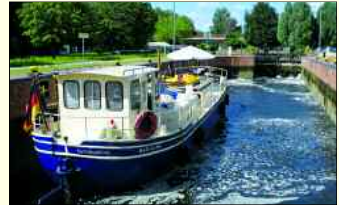
Die „Oranje“ – 101 Jahre alt und als Schiff junger Leute unterwegs

Einen absoluten Schwerpunkt bildet das Thema Musik in der Arbeit und den Angeboten des JFFZ. Ob Konzerte, Karaoke-Abende, das Erlernen von Musikinstrumenten, wie Gitarre oder Schlagzeug, um Bands zu gründen, Räume für Gesangsprojekte zu nutzen oder im Studio eigene Musik aufzunehmen. In der Musikwerkstatt gibt es seit 2013 ein Gesangsworkshop für Mädchen. Sie schreiben eigene Songs, entwickeln unter Anleitung Melodien und Texte und stellen sich damit beim Sommerfest auf „Conny Island“ einem fachkundigen Publikum aus Freunden und Mitschülern vor. Die Musikinitiative aus dem Bandhaus unterstützt selbstständig Teams bei ihren Auftritten, betreut Bands, ist bei den Disco-Aben-