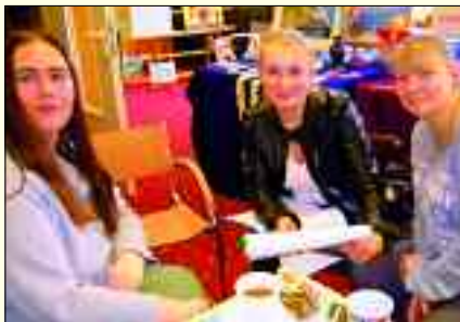
Kreative Gespräche im Schatzhüter-Café