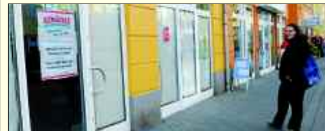
Ab April 2014: Ein neues Frischeangebot in der Havelpassage.

In einer gemütlichen Imbiss-Ecke laden zwanzig Sitzplätze zu den leckeren Snacks ein, im Sommer werden auch vor der Filiale frisch zubereitete Speisen angeboten. Übrigens sucht das Unternehmen jederzeit qualifiziertes Fachpersonal. Die Altmärker Wurstwaren bieten eine intensive Weiterbildung in Stendal und auch in den rund 60 Filialen an.