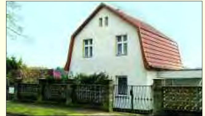
Auch ältere Gebäude, zum Beispiel aus den 20er und 30er Jahren werden oft gesucht, um sie ganz individuell auszubauen

Nordstadt Immobilien GmbH Berliner Straße 137 • 13467 Berlin-Hermsdorf Tel. 030/40 50 88 88 • Fax 030/405 08 88 99 www.nordstadt.com • info@nordstadt.com