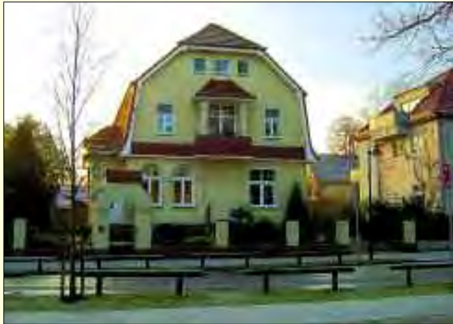
Liebevoll sanierte Häuser zieren das Bild der Gemeinde

Die kleine Gemeinde Glienicke/Nordbahn grenzt im Süden und Westen nördlich an den Berliner Stadtbezirk Reinickendorf, im Norden befindet sich die Stadt Hohen Neuendorf und östlich die Gemeinde Mühlenbecker Land. Glienicke besticht durch seine ruhige, grüne Lage und die Nähe zu Berlin. Es ist eine schöne Mischung aus Historie und Moderne, die besonders für junge Menschen sehr attraktiv ist. Es wundert nicht, dass dieser schöne Ort im März 2007 seinen 10.000 Einwohner begrüßte, Tendenz steigend. Bei einem Spaziergang durch die-