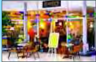
Ein Besuch lohnt sich immer

ser Café für offene Diskussionen zu den unterschiedlichsten Themen nutzen und findet dabei ein interessantes Publikum“, ergänzt Anne Krauleidies. Derzeit sind einige Werke der bekannten, in Rigga geborenen und heute in Israel lebenden Künstlerin Sofia Arav zu sehen. Für diese erste Ausstellung im „Nymindegab“ wurden die Bilder extra aus Tel Aviv eingeflogen. Das Café ist täglich ab 9 Uhr geöffnet, hat einen behindertengerechten Zugang und bietet auch für die kleinsten Gäste eine Kinderspielecke, damit Mama und Papa in Ruhe ihren Kaffee oder Tee genießen können.