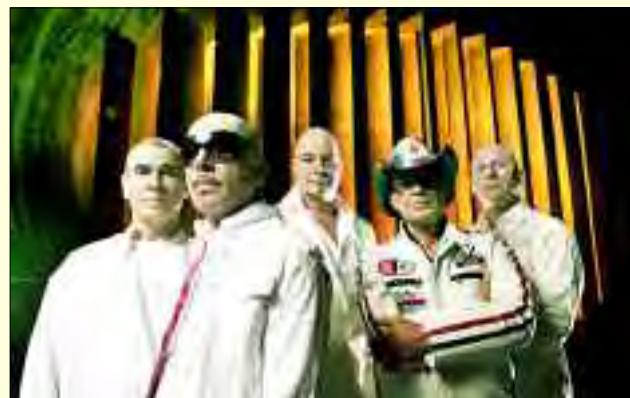
Seit Jahrzehnten rocken sie und ein Ende ist noch nicht in Sicht