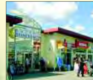
Eine von vielen Einkaufsmöglichkeiten

leibliche Wohl wird in Glienicke gesorgt: Restaurants und Cafés begrüßen herzlich jeden Besucher. Selbst für die Freizeitgestaltung herrschen hier die besten Voraussetzungen. Die vielen Vereine aber auch diverse andere Institutionen, wie das VITADEUM Glienicke bieten ein buntes Programm an Freizeitaktivitäten. Erholung findet man aber auch bei einem Spaziergang oder einer Radtour durch die nahegelegenen Naturschutzgebiete.