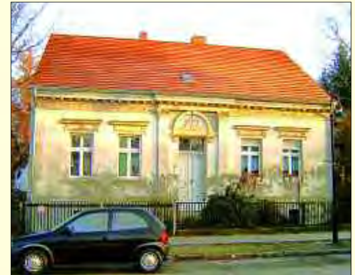
Altes Bauernhaus am Dorfanger, erbaut um 1882

20-30 Minuten vom Berliner Zentrum entfernt ist, muss man nicht unbedingt für seinen Wocheneinkauf oder zum