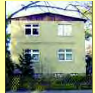
Hier verbrachte Gustav Bauer die letzten Jahre seines Lebens

Jahre seines Lebens, verbrachte er sehr zurückgezogen in der Hohenzollernstraße 174 in Glienicke (heute Karl-Liebknecht-Straße 174). Nach einer Operation verstarb er am 16. September 1944 und wurde auf dem evangelischen Friedhof in Glienicke beigesetzt. Wo er am 3. Oktober 1999 eine ihm würdige Ruhestätte und das kleine Glienicke einen Teil deutscher Geschichte bekam.