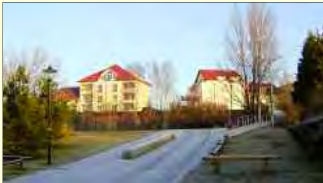
Blick auf das moderne Wohngebiet in der Ahornallee

sen Ort erkennt man an der Architektur vieler Häuser, das Glienicke auf eine lange Geschichte zurückblicken kann. Schon von weitem erkennt man die Dorfkirche. Sie wurde 1864 aus „Birkenwerder Ziegeln“ im neuromantischen Stil erbaut und wird im Moment saniert. Unmittelbar in der