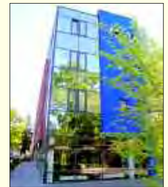
Der Hermsdorfer Firmensitz spiegelt das moderne Konzept des Unternehmens wider

Immobilien GmbH, einen riesigen Kundenkreis in aller Welt. Für Verkäufer von Immobilien wird kostenlos der aktuelle Marktwert der Immobilie ermittelt und durch eine umfassende und professionelle Dienstleistung ein schneller und sicherer Verkauf ermöglicht.