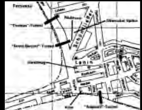
Übersichtskarte mit den eingezeichneten Fluchttunneln

Wer Glienicke/Nordbahn heute erlebt, kann sich kaum vorstellen wie es war, als die Mauer den Ort von Berlin trennte. Bereits 1952 wurde die deutsch-deutsche Grenze von Seiten der DDR mittels Zäunen, Soldaten und Alarmvorrichtungen gesichert und überwacht. So auch in Glienicke/Nordbahn. Als es in der Nacht vom 12. auf den 13. August 1961 zum Bau des „Antifaschistischen Schutzwalls“ kam, machte sich Verunsicherung breit. Es gab viele Gründe die DDR zu verlassen. In den beiden ersten Augustwochen flohen zirka 47.433 Menschen aus der DDR. Auch in Glienicke gab es Republikflüchtlinge. Um Stacheldraht, die Mauer und vielleicht auch Maschinengewehrfire zu umgehen, gruben sie sich wagemutig unter der Mauer durch. Der erste Fluchttunnel der DDR entstand im Januar 1962. In 14 Tagen