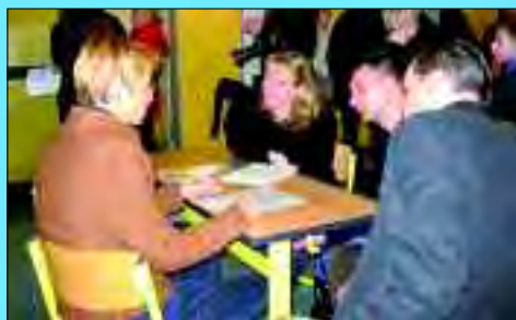
Interessierte Schüler und Eltern nutzen beim Tag der offenen Tür die Gelegenheit sich über das Angebot des Neuen Gymnasium Glienicke zu informieren

Wer sich für das Lernen am Neuen Gymnasium Glienicke interessiert