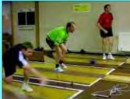
Kegeln sollte nicht unterschätzt und als Sport der Älteren abgestempelt werden – bald werden die Kegel auf der neuen Kegelbahn fallen

Die Bürger der ruhigen Gemeinde Glienicke/Nordbahn können sich über ein reges Vereinsleben und eine bunte Palette verschiedener Vereinen freuen. Heute in dieser schnelllebigen Zeit ist es sehr wichtig soziale Kontakte zu pflegen, Jugend zu fördern und gemeinsam etwas zu bewältigen. Das bieten Vereine. Der wohl größte und vom Angebot an verschiedensten Sportarten umfangreichste, ist der Sportverein Glienicke/Nordbahn e.V. mit seinen sieben Abteilungen. Darunter Badminton, Fußball, Gymnastik, Kegeln, Sportschießen, Tischtennis und Volleyball. Entstanden ist dieser Sportverein 1949, hauptsächlich durch das Engagement der Kegler und Turner. Damals war die einzige Sportstätte die selbsterbaute Kegelbahn, alle anderen Sportarten mussten in öffentlichen Gebäuden, Räumen und auf Plätzen durchgeführt werden. Die ehemalige Kegelbahn fiel dann jedoch der Umgestaltung des Ortskerns zum Opfer. Noch in diesem Jahr wird aus der jetzigen Schützenhalle eine neue Kegelbahn und auf den Anbau wird die Schützenhalle gesetzt. Die erste Turnhalle entstand Anfang der 50er Jahre, nachdem der Rat des Landkreises Oranienburg eingewilligt hatte finanzielle Mittel für den Bau einer Sporthalle zur Verfügung zu stellen. Mit tatkräftiger Unterstützung zahlreicher freiwilliger