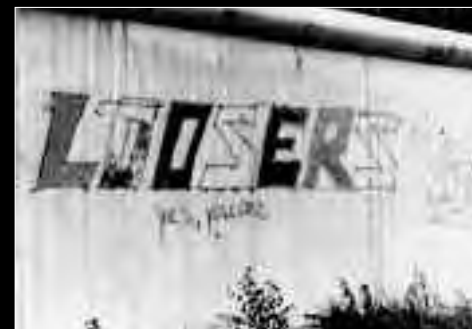
Die Mauer auf der Glienicker Seite in der Jungbornstraße zwischen Glienicke und Hermsdorf kurz nach der Wiedervereinigung 1989