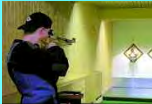
Anvisieren, tief durchatmen und mit ein wenig Geschick genau ins „Schwarze“