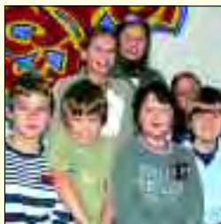
Erfolgreich lernen ab der fünften Klasse

Freies Gymnasium am Pfingstberg Zepernick Spreestraße 2 • 16341 Panketal OT Zepernick Tel. 0 30/94 41 81 24 • Fax 030/94 41 86 96 www.freies-gymnasium-zepernick.de freies_gymnasium_zepernick@t-online.de