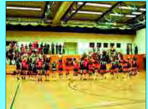
Länderspiel Deutschland gegen die Niederlande in der Dreifeldhalle von Glienicke

Mehr über den Verein und seine einzelnen Abteilungen unter www.sv-glienicke.de