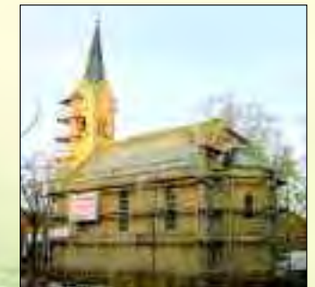
Die Sanierung ist im Gange

shoppen in die Stadt: Einkaufsmöglichkeiten gibt es hier genug. Vom Discounter bis zum Fachmarkt. Auch für das