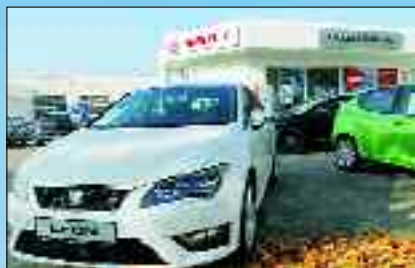
Neue und Gebrauchte in riesiger Auswahl.

Buzziol Mobile GmbH Autofocus 9 • 15 517 Fürstenwalde Tel. 0 33 61/30 10 76 Notruf-Abschleppservice 0 33 61/71 05 09 www.buzziol-mobile.de