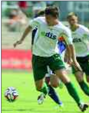
Längst in der Oberliga etabliert – die Fußballer des FSV Union

Fürstenwalde ist auch eine Sportstadt. Zahlreiche Vereine bieten nicht im Freizeit- und Breitensport ein facettenreiches Angebot. Fürstenwalde ist auch im Spitzensport eine gute Adresse. Zu den ganz wichtigen Vereinen gehört der FSV Union Fürstenwalde, der es geschafft hat, sich mit seiner ersten Mannschaft in der