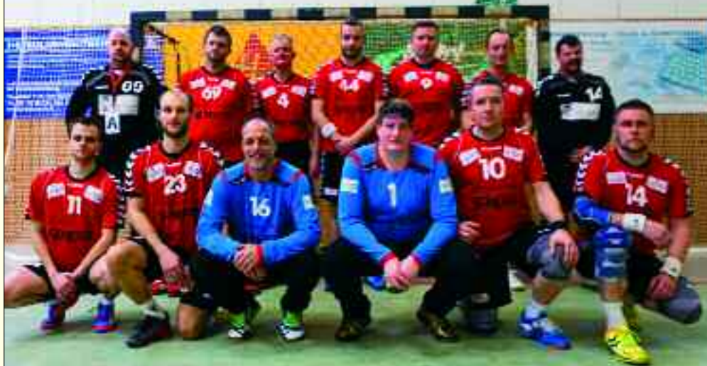
Kreisliga Handballer der BSG Pneumant sind auch 2015 wieder im oberen Tabellendrittel zu finden

Zu den bekanntesten Sportlern aus Fürstenwalde gehört inzwischen Profiboxer Nick Klappert im Halbmittelgewicht. Ein großer Sportler aus Fürstenwalde: Er ist unter anderem IBO-International Halbmittelgewichts-Champion.