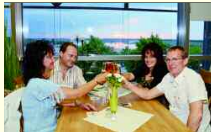
Gemütlich mit fantastischem Blick – Reinhardt's Kartoffelhaus