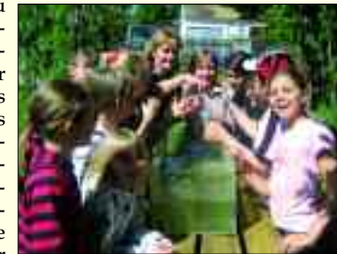
Den Unterricht zu Erlebnis zu machen gelingt den Lehrkräften unter anderem durch Unterricht im Freien

nen und Schulkultur. Durch die Erweiterung der Studentafel (zwei Fremdsprachen, Sprech-erziehung, Schultheater) lässt sich fächerverbindender und fachübergreifender Unterricht sehr gut organisieren und mit unterrichtsergänzenden Ganztagsangeboten verbinden. Die