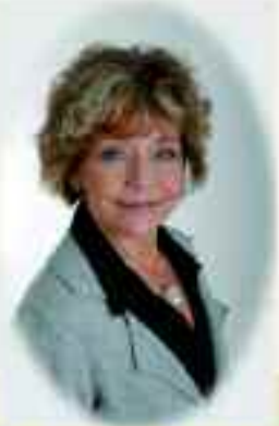
Frau Päschel ist für Sie da!

Bestattungshaus Päschel Meister- & Ausbildungsbetrieb