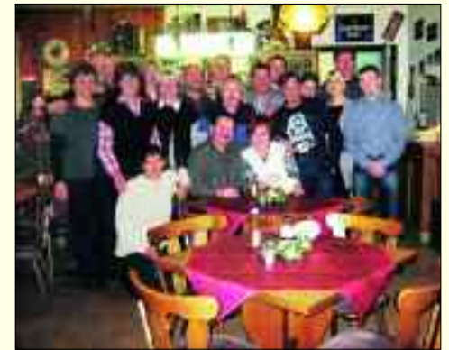
Der Löbschützer Heimatverein

Man muss die Feste feiern, wie sie fallen. Dieser Devise gehorchen auch die Löbschützer. Im Jahr 2012 jährt sich die Ersterwähnung des kleinen Ortes zum 705. Mal, denn im Jahr 1307 tauchte der Ort erstmals unter dem Namen Lobschitz in einer Urkunde auf. Auch wenn es sich nur um ein „kleines Jubiläum“ handelt, nimmt es der Heimatverein zum Anlass, für den 2. und 3. Juni 2012 zu einem zünftigen Dorffest einzuladen. In Vorbereitung auf die 700-Jahr-Feierlichkeiten wurde in den Jahren 2003/2004 erstmals mit der Aufarbeitung der Geschichte des Ortes begonnen. Fakten, Zahlen und Ereignisse wurden zusammengetragen und so entstand 2007 eine erste Ortschronik von Löbschütz. Das 700-jährige Bestehen von Löbschütz war auch Grund genug, um im Jahr 2005 einen Heimatverein zu gründen, den Heimatverein „Löbschützer Auenland 1307“ e.V. gegr. 2005. Die Geschichte des Ortes prägte die Landwirtschaft. Im Laufe der Jahrzehnte entwickelten sich kleine Handwerksbetriebe wie Bäcker, Fleischer, Schmiede, eine Tankstelle, eine Gaststätte, von denen auch heute noch einige Bestand haben. Charakteristisch für Löbschütz sind die drei Sackgassen – ein eindeutiger Hinweis auf eine altsorbische Ortsgründung. Ein Kirchweg führte in Richtung Imnitz, Kotzschbar und Zwenkau, weil es im Ort keine Kirche gibt. Typisch für den ländlichen Raum ist auch, dass es heute noch