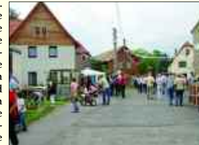
Impression der 700-Jahr-Feier 2007

Heimatverein „Löbschützer Auenland 1307“ gegr. 2005