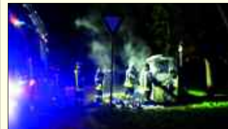
Nachteinsatz bei Containerbrand