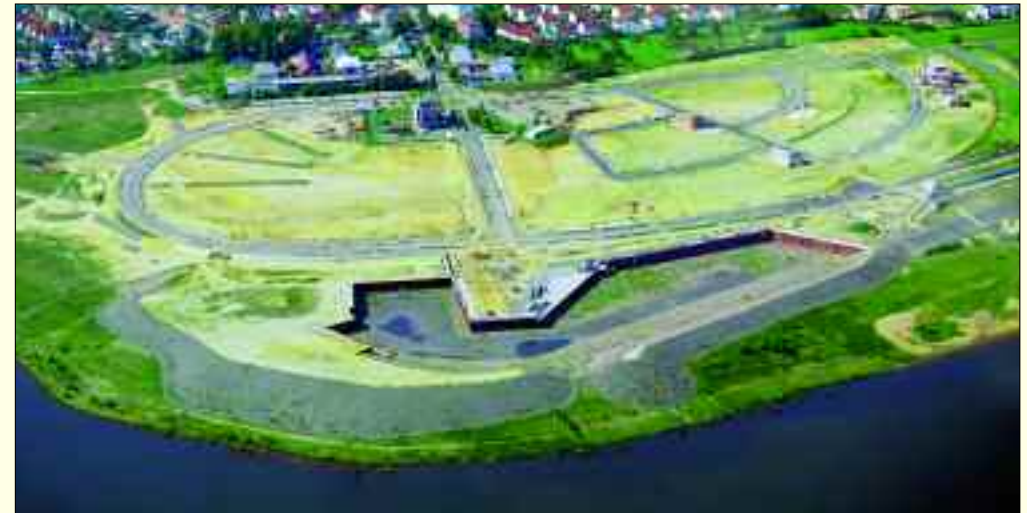
Kap Zwenkau aus der Luft (Juli 2011)

Natürlich geht es auch 2012 weiter mit dem Bauen und die ersten Geschäftshäuser kommen hinzu. So wächst Zwenkau mit dieser unverwechselbaren und besonderen Lage ans Wasser heran.