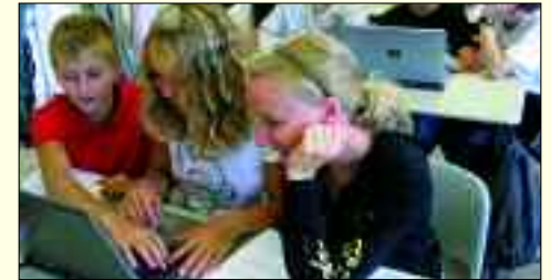
Auch der Unterricht mit modernen Mitteln gehört zum Schulalltag dazu

Die Entwicklung verlief rasant. Begannen im Schuljahr 2006/2007 noch 25 Schülerinnen und Schüler mit drei Lehrern den Unterricht, so werden derzeit 206 Schüler von 19 Lehrern unterrichtet. Und auch der Bescheid der Sächsischen Bildungsagentur, der Schule den Rang einer staatlich anerkannten Ersatzschule zu verleihen, ist für die Schüler und Eltern sehr wichtig. Denn dieser Status ermöglicht es den Schülern, hier in Zwenkau die Abiturprüfungen abzulegen. Natürlich ist die Grundlage des Schulkonzeptes der gymnasiale Lehrplan des Freistaates Sachsen. Aber das Schulleben wird hier vielfältig ergänzt und als Ganztagslernen organisiert. So berücksichtigt das Schulkonzept die neuen Erkenntnisse der Gehirnforschung, der Lerntheorie und die sich daraus ergebenden Empfehlungen für schulisches Lernen.