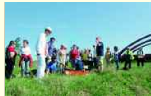
Erlebnissführungen am Nordufer

Natürlich geht es auch 2012 weiter mit dem Bauen und die ersten Geschäftshäuser kommen hinzu. So wächst Zwenkau mit dieser unverwechselbaren und besonderen Lage ans Wasser heran.