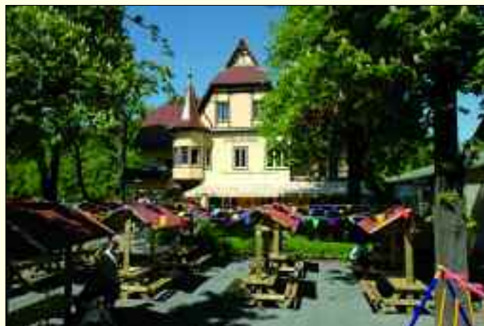
Das Schützenhaus – ein Ort zum genießen

Schatten spendenden Kastanien bilden im Sommer eine Oase für Biergartenfreunde. Doch das ganz besondere Highlight des Hauses ist der historische Erker, der die charakteristische Fassade des Hauses prägt und dem Lokal den umgangssprachlichen Namen „Rothenburger Erker“ einbrachte. Dieses kuschelige Eckchen lädt Jung- und Altverliebte zum romantischen Tête-à-tête ein – ein Ambiente, in dem sich Paare neu verlieben können. Doch was wären die vielfältigen einladenden Räumlichkeiten ohne vorzügliche Küche? Die erfahrenen Gastgeber wissen, was ihre Gäste wünschen und lassen sich zu jeder Jahreszeit überraschende kulinarische Kompositionen der gutbürgerlichen Küche einfallen. Und während der Kaffeezeit können Sie bei frisch gebackenem Kuchen und leckeren Eiskreationen Bekanntschaft mit dem „Schokoladenmädchen“ des Hauses schließen.