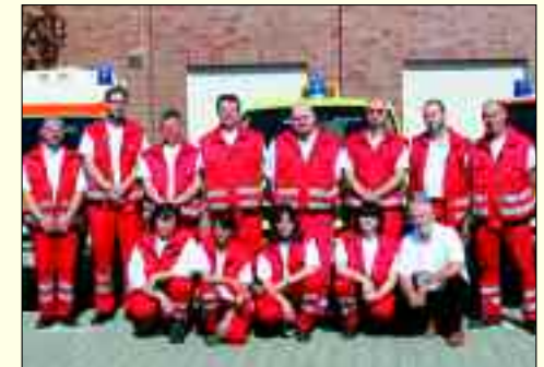
Schnell und zuverlässig: Das Sanitrans-Team

Durch die ständig besetzte Dispatcherzentrale ist es Sanitrans möglich, bei spontanen Transportwünschen eine schnellstmögliche