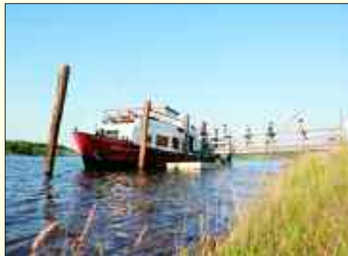
Die „Santa Barbara“ auf dem Zwenkauer See

Rund um den Hafen streben schon jetzt die ersten Wohnhäuser in die Höhe und zeigen, dass die Ansprüche an Städtebau und Architektur die Besonderheit des Standortes unterstreichen.