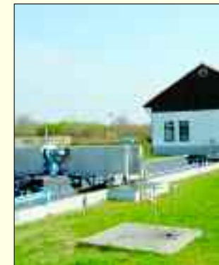
Rechenhaus und Sandfang der Verbandskläranlage

Auf den Spülknopf drücken, den Stöpsel aus dem Abfluss ziehen – und schon ist es weg, das Abwasser. Doch auch wenn das Wasser aus unserem Sichtfeld verschwindet, sobald wir es benutzt haben – irgendwann treffen wir es wieder: im Graben, beim Paddeln oder Segeln. Es kehrt zurück in den Wasserkreislauf, auf die Felder und in unsere Lebensmittel. Zwischen dem Abschied und dem Wiedersehen liegt eine wichtige Aufgabe: Das Reinigen des Abwassers.