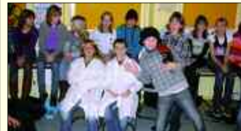
Die zukünftigen Abiturienten zeigen Humor und den Willen zum Lernen

Mit Hilfe der Ganztagsförderung des Freistaates Sachsen gibt die Schule Hilfen und Impulse für die Förderung der Kinder, baut Arbeitsgemeinschaften auf, bietet eine Schülerzeitung