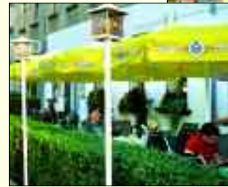
Das gute Essen und die freundliche Bedienung sind in Zwenkau bekannt.

die Inneneinrichtung weiter entwickelt sowie die Dekoration neu gestaltet. Schauen Sie doch mal rein!