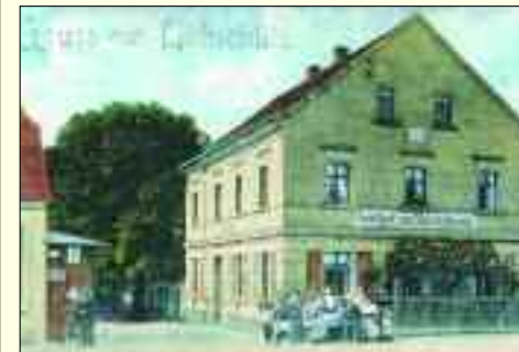
Löbschütz Anfang des vergangenen Jahrhunderts