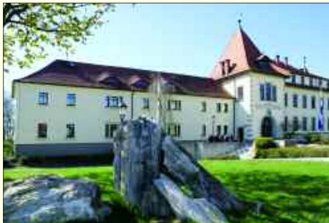
Sitz des Heimatvereins – das Zwenkauer Rathaus