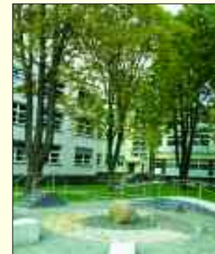
HELIOS Klinik Zwenkau

Die HELIOS Klinik Zwenkau ist ein Krankenhaus der Regelversorgung und im Verbund mit dem HELIOS Klinikum Borna in Trägerschaft der HELIOS Kliniken Leipziger Land GmbH. Die Klinik für Innere Medizin der HELIOS Klinik Zwenkau ist eine Internistische Fachklinik (70 Betten) mit Internistischer Intensivstation (sechs Betten) und Akademisches Lehrkrankenhaus der Universität Leipzig. Neben der Behandlung von Erkrankungen aus allen internistischen Teilgebieten liegen die Schwerpunkte auf Gastroenterologie, Hepatologie, Kardiologie, Diabetologie, Internistische Intensivmedizin sowie die Diagnostik und Behandlung von hormonellen, Lungen- und Infektionskrankheiten.