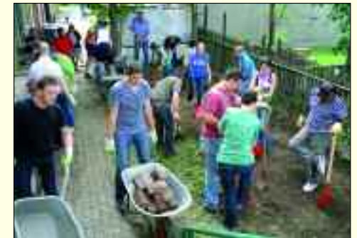
Arbeitseinsatz im Freizeitzentrum

Unterdessen haben die Kinder und Jugendlichen die vielfältigen Angebote ihres Freizeit-zentrums nicht nur dankend angenommen, sondern unterstützen Ausbau und Gestaltung gern aktiv mit. So bleibt allen Beteiligten ein Wochenende Mitte August 2011 in lebhafter Erinnerung. An besagtem Samstag traf sich im Leuchtturm wahrhaftig die Welt! 60 junge Ingenieure der Dow Olefinverbund GmbH, unter anderem aus den USA, Indien, Thailand, Brasilien, Spanien und Mexiko, unternahmen innerhalb eines zehntägigen Fachaustauschs im Konzern einen Arbeitseinsatz im Freizeit-zentrum. Keine Frage, dass auch Zwenkauer Jugendliche nicht nur zur abschließenden Grill-party kamen, sondern zuvor kräftig mitzupackten. Ob bei Dart, Tischfußball, Wii, Playstation oder um gemütlich in den Sesseln beim