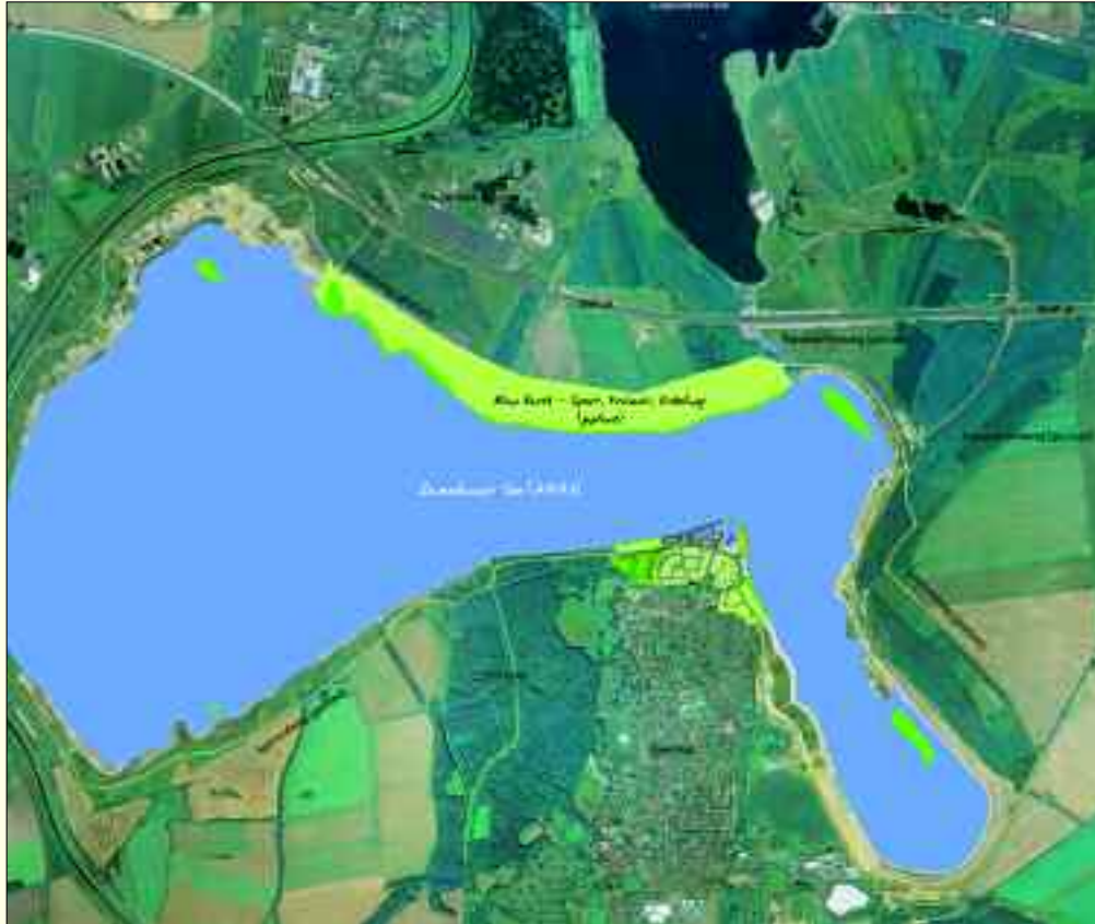
Gesamtübersicht Zwenkauer See

Noch ist das Wasser des Zwenkauer Sees rund zwölf Meter vom Hafenviertel am „Kap Zwenkau“ entfernt. Doch schon 2013 wird der größte – der südlich Leipzigs gelegenen Seen – seine Gesamtfläche von 970 Hektar erreicht haben.