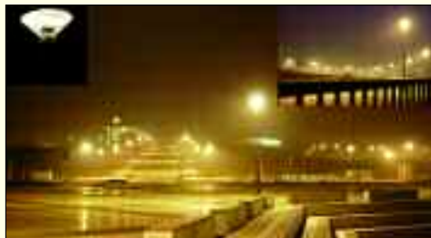
Toller Blick auf das KAP bei Nacht – Dank der Leistung des Ingenieurbüros BERTHOLD

Unter anderem plante das Büro Beleuchtungsanlagen der Wohn- und Gewerbeflächen sowie die elektrotechnische Erschließung des „Technischen Hafens“ am KAP Zwenkau. Auch Projektleitungsaufgaben im Bereich des Flughafens Frankfurt/Main und der bundesweite Einsatz für die Deutsche Bahn und fachliche Betreuung von Einkaufszentren sind Leistungen des siebenköpfigen Teams um Uwe Berthold. Eine gute Zusam-