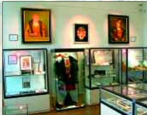
Schriftstücke, Münzen und vieles mehr sind hier in den Vitrinen zu bewundern

te lässt das harte Leben eines Binnenschiffers erahnen. Das mittlere Geschoss ist der Ur- und Frühgeschichte sowie der Stadt- und Schlossgeschichte gewidmet. Waffen, Haushaltgeräte und Werkzeuge, Gemälde oder die Nachbildung eines Kostüms von Herzog Philipp I. lohnen das Kommen. Der Besuch des 1992 sanierten Ratssaales mit dem einmaligen Deckengewölbe aus dem 16. Jahrhundert sollte bei einem Rundgang im Haffmuseum nicht fehlen. Mit jährlich fast 10.000 Besuchern ist das Ueckermünder Haffmuseum eher eine kleine Einrichtung. – Klein, aber oho! – Seit mehreren Jahren organisiert das Haffmuseum mehrmals jährlich Sonderausstellungen zu vielfältigen Themen, wie Malerei, Hobby- und Brauchtumpflege, regionale Geschichte und Handwerk. In der Saison ist das Museum täglich außer Montag geöffnet, von Oktober bis April bleibt das Museum an den Wochenenden geschlossen.