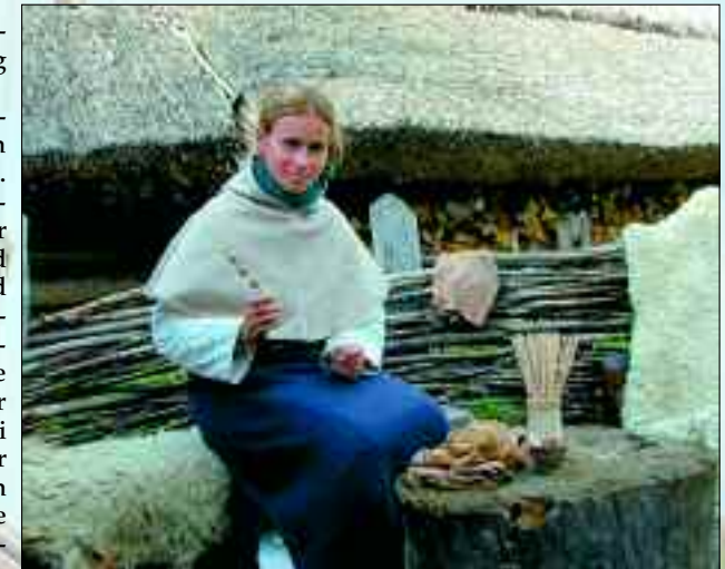
Tonperlen, beliebter Schmuck bei Ukrananfrauen, lassen sich einfach und schnell herstellen

Besonders beliebt sind die historischen Markttage, die immer vom Frühjahr bis zum Herbst Besucher aus Nah und Fern anziehen. Dann ist das urwüchsige Leben unserer slawischen