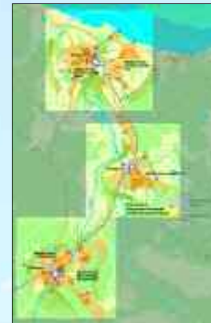
Eine Übersicht über den Wirkungskreis von U.T.E.

halten. Die Suche nach neuen Investoren wird dennoch nicht aufgegeben.