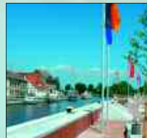
Romantik im alten Stadthafen von Ueckermünde

gen, fast unberührt wirken den Landschaft am Stettiner Haff. Ein 260 Quadratkilometer großes Landschaftsschutzgebiet vereint die Küstenregion mit dem großen Waldgebiet der Ueckermünde Heide. Der liebenswerte, herb erscheinende Landstrich stellt sich mit urwüchsiger Natur, kleinen typischen vor-