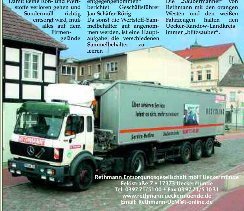
Rethmann Entsorgungsgesellschaft mbH Ueckermünde Feldstraße 7 • 17373 Ueckermünde Tel. 0397 71/51 00 • Fax 0397 71/5 10 31 www.rethmann.ueckermuende.de Email: Rethmann-UEM@t-online.de

und getrennt zu entsorgen. Da nicht alles in die „Tonne“ kommt gibt es auch eine Kompostierungsanlage auf der Grünabfälle gesammelt, geschreddert und kompostiert werden. Wenn bei Bau oder Entrümpelung größere Mengen Abfall anfallen, kann man sich auf den Containerdienst der Rethmann Entsorgungsgesellschaft verlassen. Für Haushalte oder Gewerbe werden Behälter von 1,1 bis zu 33 Kubikmeter auf die Stunde genau angeliefert und abgeholt. Die „Saubermänner“ von Rethmann mit den orangen Westen und den weißen Fahrzeugen halten den Uecker-Randow-Landkreis immer „blitzsauber“.