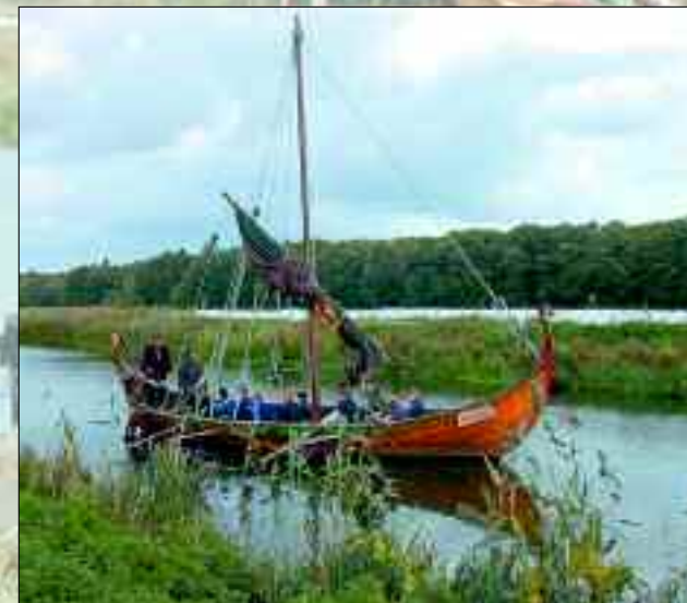
So ein Slawenschiff über die Uecker zu bewegen ist schon etwas besonderes, zumal sie wie kleine Wikingerschiffe aussehen und der Mannschaft einiges abfordern

Vorfahren besonders gegenwärtig. Absoluter Höhepunkt ist natürlich eine Flussfahrt auf der Uecker mit der SVAROG, dem