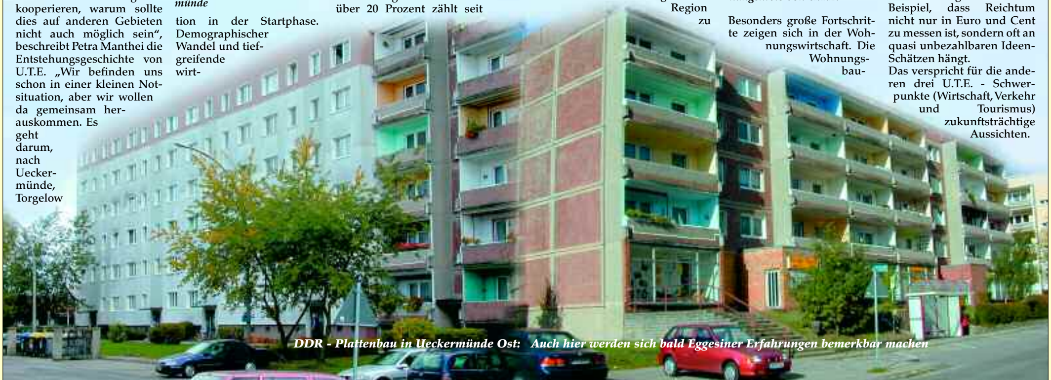
DDR - Plattenbau in Ueckermünde Ost: Auch hier werden sich bald Eggesiner Erfahrungen bemerkbar machen

An der Erarbeitung der Konzepte waren in allen drei Städten rund 10.000 Menschen beteiligt. Ein schönes Beispiel, dass Reichtum nicht nur in Euro und Cent zu messen ist, sondern oft an quasi unbezahlbaren Ideen-Schätzen hängt. Das verspricht für die anderen drei U.T.E. - Schwerpunkte (Wirtschaft, Verkehr und Tourismus) zukunftsreiche Aussichten.