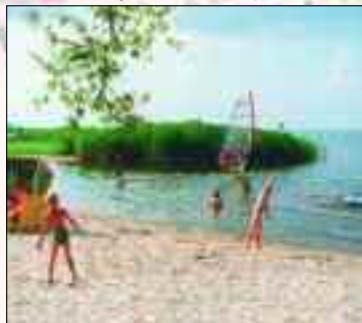
Ferien- und Freizeitanlage Kron Bellin Dorfstraße 8b 17 373 Ueckermünde/Bellin Tel. 03 97 71/5 91 10 • Fax 03 97 71/2 27 51 www.strandferien-am-haff.de

hauseigenen Motorschiff „Milan“ auf dem Haff unterwegs, ob zu Fuß oder mit der Kutsche durch Wald und Heide, beim Billard und Kegeln, in der Blockhaussauna oder beim Countryabend am Lagerfeuer. Selbst für die Ueckermünder Wochenende, um sich mit frisch gefangenen Haffzander verwöhnen zu lassen. Und während die Kleinsten auf dem Spielplatz turnen und toben, können die Teenager den Surfkurs besuchen. Das Restaurant „Kron Bellin“ mit Fischerstube und großem Saal ist eine gute Adresse um mit der Familie, den Freunden, oder mit der ganzen Firma preiswert unvergessliche Feste in idyllischem Ambiente am Haff zu feiern. Es lohnt sich auf alle Fälle mal vorbei zu schauen.