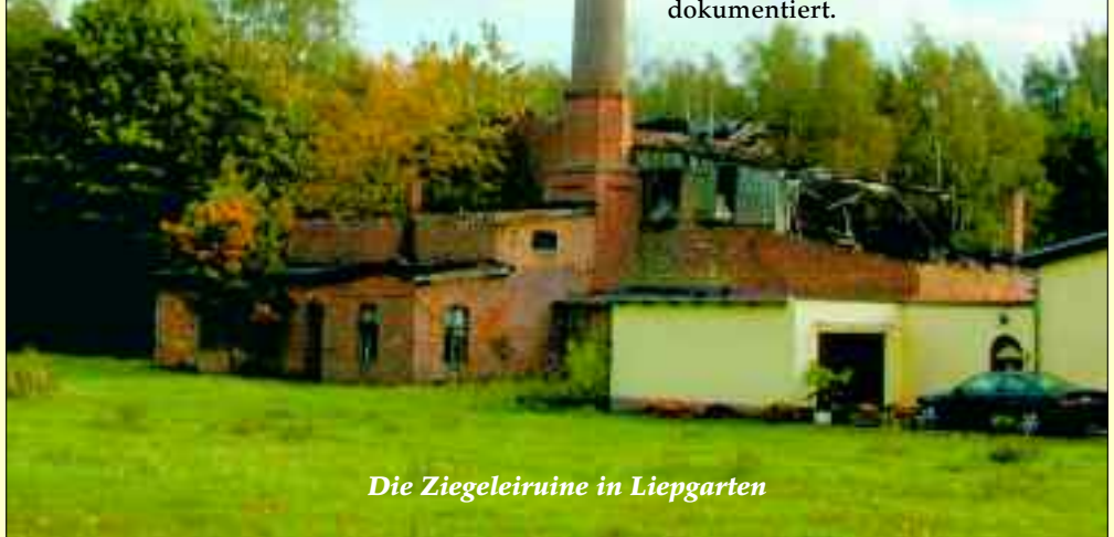
Die Ziegeleiruin in Liepgarten

gesunken. Hauptursache waren vor allem Absatzschwierigkeiten. Gleich nach der Wende wurde modernisiert. Etwa 45 Beschäftigte produzierten im neuen Werk jährlich noch 20 Millionen Steine. Nach der Verschmelzung mit der Wienerberger Ziegelindustrie endete 1997 die Ära der Ziegelerstellung im Kreis Ueckermünde. Im Haffmuseum ist dieser Teil Ueckermünder Geschichte mit viel Liebe und zahlreichen Exponaten dokumentiert.