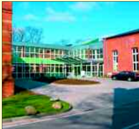
Der Eingangsbereich – eine Symbiose aus Alt und Neu

Dank modernster Technik, wie hier die Computertomographie, lassen sich Krankheiten besser diagnostizieren