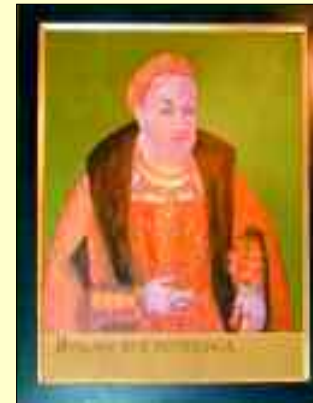
Herzog Bogislaw X. (1454 bis 1523)

Der Pommersche Herrscher Herzog Bogislaw X. hielt sich zu jener Zeit häufig und gern in Ueckermünde auf. Eines Nachmittags war er ganz allein auf Jagd in der Ueckermünder Heide unterwegs. Mit Einbruch der Dunkelheit verirrte er sich in dem weitläufigen Gebiet, das noch