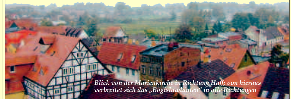
Blick von der Marienkirche in Richtung Haff; von hieraus verbreitet sich das „Bogislawläuten“ in alle Richtungen

Bürger wollten nicht untätig sein und ließen sämtliche Glocken der Stadt läuten. Zufällig stand der Wind in jene Richtung, wo sich Bogislaw aufhielt. Der hörte den Ton der Glocke und fand so den Weg nach Ueckermünde zurück. Aus Freude über die Rettung des Herrschers wurden sämtliche Glocken der Stadt geläutet. Das „Bogislawläuten“ ist auch heute noch im Winterhalbjahr (Mitte November bis Ende März), immer abends um 19.30 Uhr für zehn Minuten von der Marienkirche zu hören. Für weniger romantische Gemüter ist der Glockenton ein schlichtes „Feierabendbimmeln“.