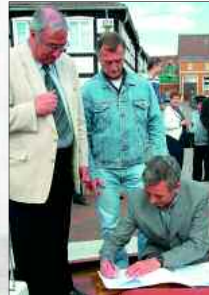
Bei der feierlichen Übergabe des Kasko an den Verein durch Bürgermeister Peter Westphal am 7. Mai 2003 im Hafen von Ueckermünde

Kleingartensparte „Reeperbahn“ Dietrich Metzklaff Am Tierpark 15 17373 Ueckermünde