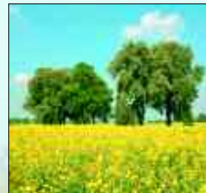
Zum Abschalten und genießen, wandern entlang der Rapsfelder

Die über 740 Jahre alte Stadt Ueckermünde ist eingebettet in die faszinierende Schönheit einer vielfältigen