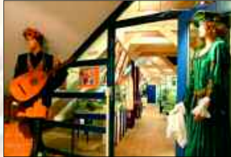
Kostbare Schätze wurden mühevoll von den Einheimischen zusammen getragen

Stadt am Stettiner Haff wichtige Erwerbszweige. Jüngst investierte die Stadt 250.000 Euro für die Erschließung des bisher ungenutzten Dachbodens. Auf über 200 Quadratmeter wird dort die Geschichte des Gießerei- und Bahnwesens, der Produktion von Schiffslaternen oder des Schulwesens anschaulich. Eine original nachgebaute Kajüte