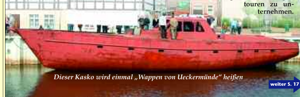
Dieser Kasko wird einmal „Wappen von Ueckermünde“ heißen