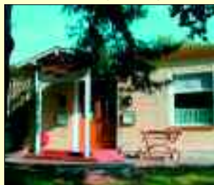
Haff-Hotel Grambin Dorfstraße 67a • 17 375 Grambin Tel./Fax 03 97 74/203 92

Absieits vom alltäglichen Trubel ist das Haff- Hotel Grambin direkt am Stettiner Haff gelegen. Die Hotelzimmer und die Ferienhäuser sind familienfreundlich ausgebaut und komfortabel eingerichtet. Der wunderschöne Sandstrand, fünf Minuten vom Hotel entfernt, lädt zum Relaxen ein. Selbst beim Essen kommt man auf seine Kosten. Die Köche im Café-Restaurant „Rosengarten“ servieren gutbürgerliche Speisen und Fischgerichte. Die Mitarbeiter des Hotels gehen auf jeden Wunsch des Gastes ein, denn der ist ja schließlich König.