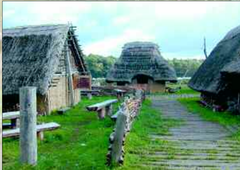
Die hier im Ukrananland stehenden Häuser wurden nach historisch und archäologisch belegbaren Vorbildern, unter Verwendung des damals verwandtem Baumaterial nachgebaut. Auch wenn es nicht wie ein Feriendorf aussieht, sind doch Übernachtungen hier möglich

ist die Vernichtung der letzten slawischen Tempelburg in Arkona im Jahre 1168.