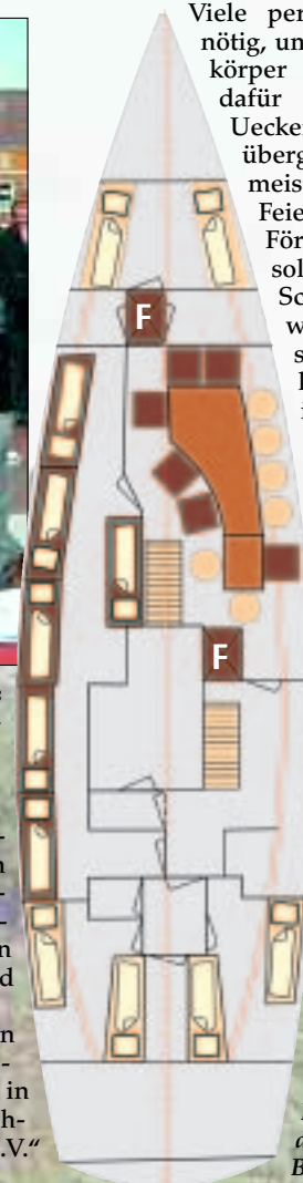
Die geplante Aufteilung unter Deck (dunkelbraun für Behinderte, hellbraun für nicht Behinderte, „F“ sind Fahrstühle); wird ständig aktualisiert