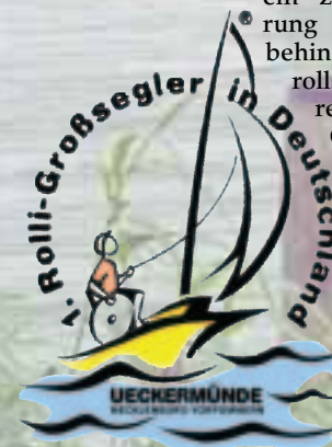
Das Logo des „Verein zur Förderung des ersten behinderten- und rollstuhlgerechten Großsegelschiffs in Deutschland e.V.“

In Holland und Großbritannien funktionieren ähnliche Projekte, warum nicht auch in Deutschland. Ein „Verein zur Förderung des ersten behinderten und rollstuhlfahrergerechten Großsegelschiffs in Deutschland e.V.“ wurde gegründet.