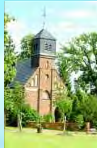
Die Kirche im Ortsteil Pieskow ist gut erhalten und gepflegt

Schriftsteller Maxim Gorki an. Sie alle suchten und fanden hier die besten Voraussetzungen für Genesung und Erholung. Auch das Leben der Bevölkerung wird zum größten Teil durch den Tourismus in der