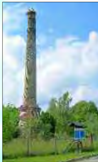
Der Storchenturm in Radlow ist immer einen Besuch wert

Das Amt Scharmützelsee, aus fünf Gemeinden – Diensdorf-Radlow, Langewahl, Reichenwalde mit den Ortsteilen Dahmsdorf, Kolpin und Reichenwalde, die Gemeinde Bad Saarow mit den Ortsteilen Neu Golm, Petersdorf, Pieskow und Saarow – zusammengeschlossen