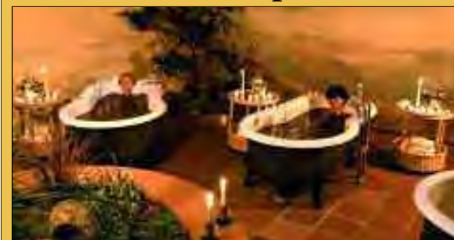
Moorpackungen haben eine heilende und entspannende Wirkung

Im ersten staatlich anerkannten Thermalsole- und Moorheilbad Brandenburgs können Besucher Urlaub vom Alltag nehmen. Das milde Klima und die hohe Anzahl an Sonnenstunden machen Bad Saarow zum perfekten Urlaubs- und Ausflugsziel für gestresste Großstädter, Rheumakranke oder Neurodermitispatienten. Heilung für die Haut erfährt man besonders durch die Anwendung des „Original Bad Saarower Naturmoor“ – ein typisches Niedermoor, welches eine gute Wärmehaltung besitzt. Außerdem können