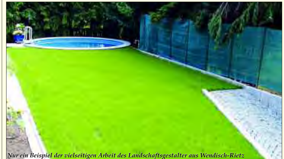
Nur ein Beispiel der vielseitigen Arbeit des Landschaftsgestalter aus Wendisch-Rietz

Dieter Lehmann – Der Landschaftsgestalter Fachbetrieb für Landschaftsgestaltung & Grundstückspflege Neue Mühle, Beeskower Chaussee 17 15 864 Wendisch Rietz www.der-landschaftsgärtner.de Mobil 01 72/9 43 05 97