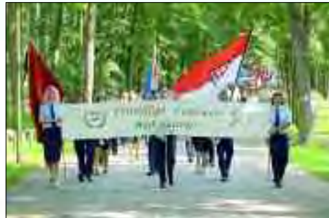
Angeführt wurde der Umzug von den Mitgliedern der Bad Saarower Feuerwehr