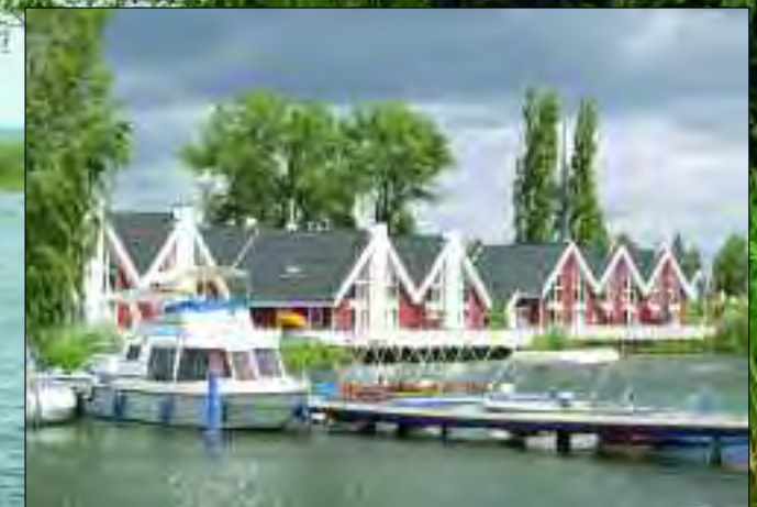
Der Ferienpark in Wendisch Rietz