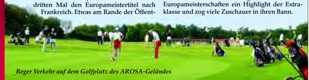
Regel Verkehr auf dem Golfplatz des AROSA-Geländes