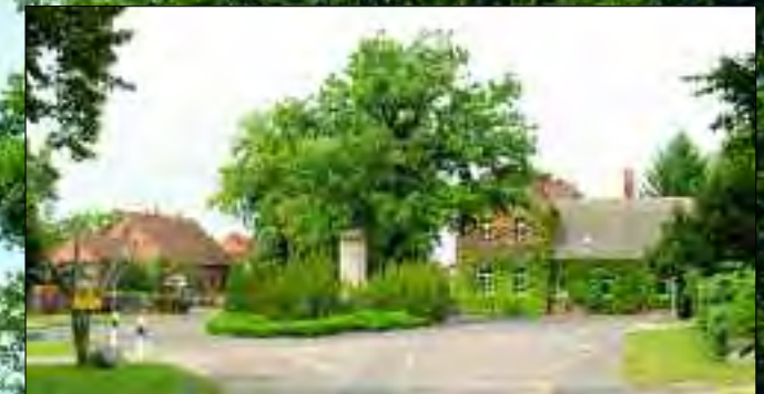
Dorfplatz in Reichenwalde