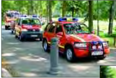
Der Festumzug wurde von vielen Wehren der Nachbargemeinden unterstützt

Als 1906 die Landhauskolonie Saarow-Pieskow auf der Nordseite des Scharmützelsees mit zirka 450 Einwohnern entstand, dachte noch keiner daran, dass es auch mal brennen könnte.