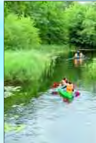
Kanutouren durch die weitverzweigten Wasserwege garantieren ein unvergessliches Erlebnis

sen befindet sich im Herzen Brandenburgs, direkt am Ufer des „Märkischen Meeres“.