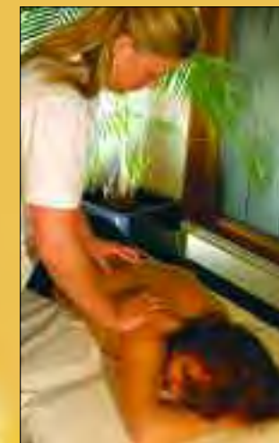
Massagen gehören zu jedem Aufenthalt in Bad Saarow

Im ersten staatlich anerkannten Thermalsole- und Moorheilbad Brandenburgs können Besucher Urlaub vom Alltag nehmen. Das milde Klima und die hohe Anzahl an Sonnenstunden machen Bad Saarow zum perfekten Urlaubs- und Ausflugsziel für gestresste Großstädter, Rheumakranke oder Neurodermitispatienten. Heilung für die Haut erfährt man besonders durch die Anwendung des „Original Bad Saarower Naturmoor“ – ein typisches Niedermoor, welches eine gute Wärmehaltung besitzt. Außerdem können