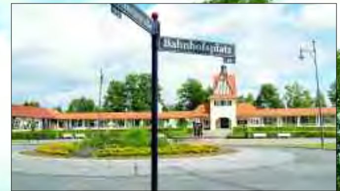
Der liebevoll rekonstruierte Bahnhof in Bad Saarow

In der Region finden sich beste Voraussetzungen für sportliche Aktivitäten wie das Fahrrad- oder Inlinerfahren, den Golfsport, Reiten, Tennis, Wasserski, Angeln oder Paddeln. Auch die Gastschiffahrt auf dem Scharmützelsee hat eine lange Tradition. Moderne Fahrgastschiffe starten von den gut erreichbaren Anlegestellen um den Passagieren die wunderschöne Umgebung vom Wasser aus zu zeigen.