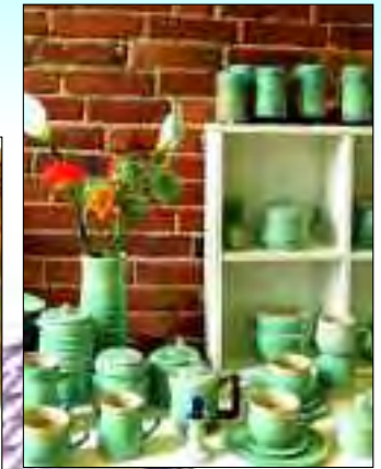
Unikate aus Leder und Keramik werden hier in liebevoller Handarbeit hergestellt