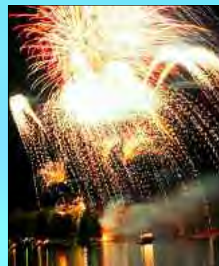
Flammender Scharmützelsee – spektakulärer Abschluss des Kultursommers 2007

Nur wenige Minuten fährt man von der Autobahn 12, Abfahrt Fürstenwalde West, über Petersdorf zum Scharmützelsee. Und wer mit der Eisenbahn kommt, wird fasziniert sein von dem wunderschönen historischen Bahnhof, der dank der großen Spendenaktion des Fördervereins Kurort Bad Saarow e.V. fertig gestellt werden konnte. Bad Saarow als Kurort möchte neben Thermalsolebad, ansprechenden Hotels, Gastronomie- und Sporteinrichtungen und viel gelobter Natur auch eine entsprechende kulturelle Atmosphäre bieten. Sie