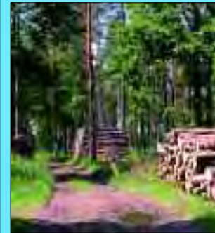
Waldweg bei der Osterquelle

Preußenkönig Friedrich II. schenkte seinem verdienstvollen Hauptmann Winkelmann Ländereien bei Fürstenwalde zur Urbarmachung dieser „Sandschelle“, das Bauern aus Alt Golm und Neu Golm abtreten müssten. Lange suchte der Ausgezeichnete nach einem rechten Platz für den Bau seines Hauses, um das sich um 1750 weitere 22 Familien beiderseits der