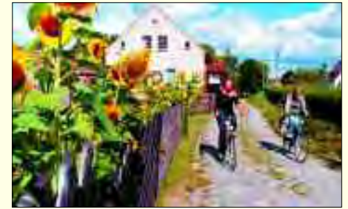
Rund um den idyllischen See auf Fontanes Spuren

Doch Fontane spazierte von der Nordspitze des Sees zum heutigen Dorf Saarow und war überwältigt: „Ein wundervoller Weg; über dem blauen Wasser wölbte sich der