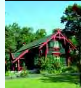
Das so genannte „Gorkihaus“

kern ist einen Bummel wert. Von hier aus führt ein gut ausgebautes Radwegenetz rund um die Seen. Für Radler ist die Schau der Radkuriostäten von Tourteufel und Konstrukteur