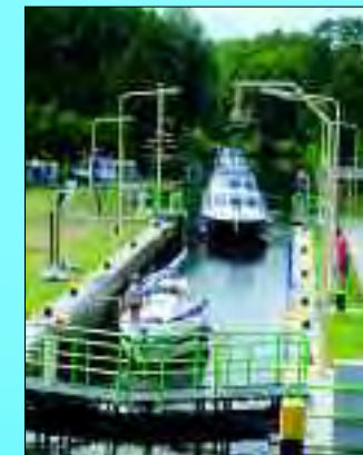
Die Große Schleuse, das Tor zum „Märkischen Meer“

Fisch, Steuerrad und Zapfen im Wappen von Wendisch Rietz haben nichts von ihrer Bedeutung verloren. Von hier verkehren Ausflugsboote zu Seenrundfahrten, liegen im Segelclub stattliche Yachten vertäut und sind auch die Fischer vom Scharmützelsee zu Hause. Das frisch angelandete Silber des Meeres bieten originelle, riedgedeckte Restaurants an. Auch Angler können ihr Glück in den fischreichen Gewässern versuchen, in denen Aal und Hecht, Schleie, Karpfen, Barsch und Rotfeder schwimmen. Die fast endlosen Wälder mit ihrem harzigen Kiefernduft sind nicht nur eine wahre Fundgrube für Pilzsammler, sondern empfehlen sich für wunderschöne Radtouren.