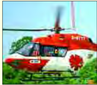
Schnelle Hilfeleistung mit dem Rettungshubschrauber

Das ist man hier wenn es um Leben oder Tod geht. Das Humaine Klinikum bietet mit umfangreicher Akutmedizin auf allen Gebieten und mit hoch effizienter Rettungsmedizin einschließlich Rettungshubschrauber schnelle medizinische Hilfe. Mit dem Herzkatheterlabor,