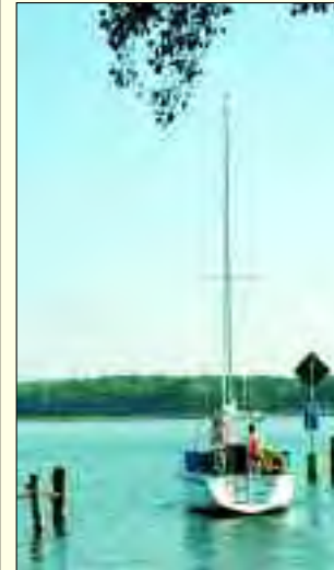
Ein fast olympisches Segelrevier

Aber der fischreiche See, das „märkische Meer“ und die Seenkette zogen schon viel früher in der Jungsteinzeit erste Siedler an, Fischer, Ackerbauern und Viehzüchter. Funde belegen Siedlungen germanischer Stämme,