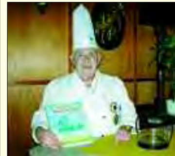
Mitautor zahlreicher Kochbücher

Die gut drei dutzend Vereinsmitglieder, vom Lehrling bis zum Meisterkoch und