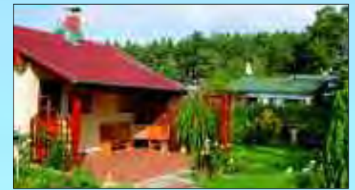
Schmucke Waldsiedlung in Dahmsdorf

im Dreißigjährigen Krieg zerstört und auf den Grundmauern stilgerecht aufgebaut. Auf dem alten Friedhof fallen die Grabsteine königlicher Forstmeister auf, denn das von Wald umarmte