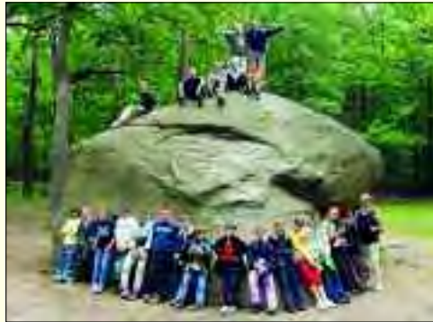
Noch 3,70 Meter ragt der „Kleine Markgrafenstein“ aus dem Waldboden bei dem Dorf Rauhen

Im November 1828 traf der Transport mit einem speziell gebauten Schiff in Berlin ein. Zum Schleifen der Schale wurde eine eigene Schleiferei errichtet. Diese Arbeit dauerte bis 1831. Erst 1834 erfolgte die Aufstellung der roten Granitschale vor dem Alten Museum im Lustgarten. Liebevoll wie