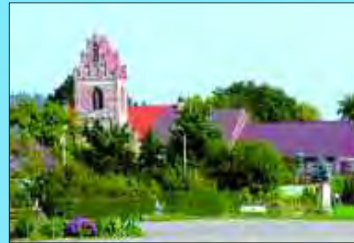
Blick auf das Zentrum des Ortsteils Neu Golm

und mit ihrem Mann, dem Boxweltmeister Max Schmeling die schöne Anny Ondra. Hier kurierte auch der russische Schriftsteller Maxim Gorki sein Lungenleiden und schrieb „Die erste Liebe“ und „Erinnerungen“. Nach dem zweiten Weltkrieg nutzte die Rote Armee das Sa-