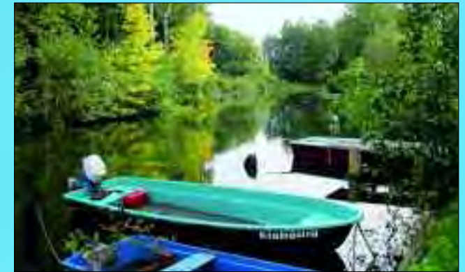
Die romantische Spree bei Streitberg ist Geheimtipp für Angler

Langgestreckt zieht sich der Ort in waldreicher Gegend zwischen der Spree und den Dubrower Bergen in Nähe der Stadt Fürstenwalde hin. Das typische märkische Straßendorf wurde 1752/53 erstmals erwähnt, doch archäologische Funde von Steinbeilen, Spitzen und Klingen aus Feuerstein lassen den Schluss zu, dass dieser Ort schon vor etwa 5.000 Jahren besiedelt war.