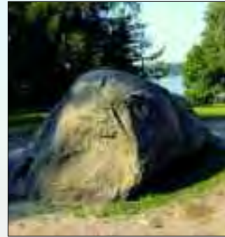
Findling am Markgrafenplatz

Das Oder-Spree-Seengebiet rund um den Scharmützelsee zieht jährlich Millionen Urlauber und Ausflügler an. Es ist die meistbesuchte Tourismusregion Brandenburgs. Nur eine knappe Autostunde von der Hauptstadt und dennoch fern von Überfülle, Hektik und großstädtischem Smog. Hier hat die Eiszeit eine Landschaft gestaltet, die ihresgleichen sucht. Herrliche Wälder, in denen heute noch bei vorsichtiger Pirsch Reh und Hirsch, Wildschwein, Fuchs und Dachs zu beobachten sind. Über den Rauenschen und Dubrower Bergen kreisen Seeadler und Roter Milan und an den verwunschenen Waldseen stochern Reiher und Storch im Ufermo- rast, jagen Kormoran und Eisvogel in geduldeter