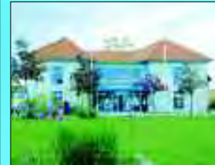
Die Adresse: Haus des Gastes

Der seit 2001 auch staatlich anerkannte Erholungsort am Südufer des Scharmützelsees bietet besonders Familien aus halb Europa einen erholsamen und abwechslungsreichen Urlaub. Dabei stützen sich die 1.441 Einwohner von Wendisch Rietz auf über zweihundertjährige Tradition als Gastgeber. Denn seit das märkische Meer über den Storkower See, den Kanal und die Dahme mit Berlins