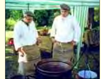
Vereinsköche, die Sieger in Altranft

tete Lehrgänge zur brandenburgischen Küche, popularisierte das Kochen mit heimischen Produkten, die vor der Haustür wachsen. So zaubern sie fantasievolle Gaumenfreuden mit Fisch, Waldpilzen und natürlich Kartoffeln. Vom lebhaften Erfahrungsaustausch profitieren die Köche und vor allem ihre Gäste. Das bunte Vereinsleben reicht vom Muschelessen in vielen Variationen, dem Test von Grund-