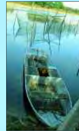
Fischeridyll am Kolpiner See