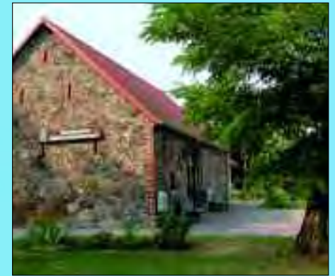
Für diese schicke Heimatstube haben viele fleißige Hände des Dorfes kräftig angepackt

entstand, das klimatisch günstige Dorf zog Wassersportler und Urlauber an. Seit 1961 als Doppelort zusammengelagert, entwickelten sich die beiden Ortsteile zu Zentren des sanften Tourismus mit gepflegten Pensionen und kleinen Hotels, entfernt vom lebhafteren Saarow. Das Storchennest auf dem Schornstein