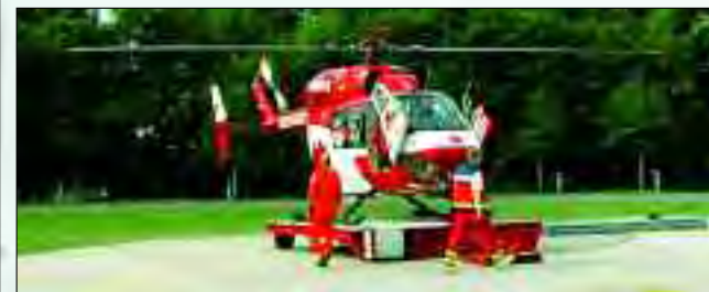
Alarm für Christoph 49, Pilot und Rettungsarzt gehen an Bord

Deutsche Rettungsflugwacht e.V. German Air Rescue Luftrettungszentrum Bad Saarow „Christoph 49“ c/o Humaine-Klinikum 15 526 Bad Saarow E-Mail LRZ-BadSaarow@drf.de DRF-Spendenkonto: Volksbank Winnenden BLZ 602 915 10 Konto 701 070 170