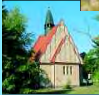
In der Kirche von Bad Saarow heiratete Boxweltmeister Max Schmeling Filmstar Anny Ondra

für Berlins neue Fabriken und Mietskasernen. Beim Erschließen neuer Felder stieß man auf Braunkohle in den Ortsteilen Silberberg und in Petersdorf. Um Ziegel und Kohle in die preußische Residenz zu schiffen, wurde 1862-65 der Rietzer Graben zum Storkower Kanal ausgebaut.