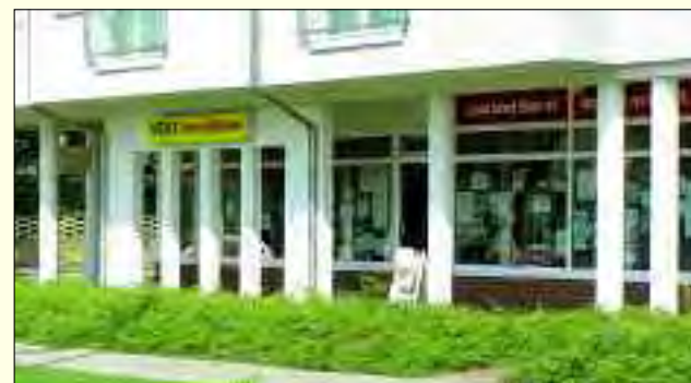
Die Geschäftsräume von Vent-Immobilien in Bad Saarow

gemacht. Nun schon seit 1993 lebt er in Bad Saarow und hat sich als selbständiger Immobilienmakler in Vertrauen und Anerkennung seiner Kunden erworben. „My home is my castle“ – darum geht es und um mehr. Eigenheime, Baugrundstücke, Gewerbeimmobilien sind die gewichtigen Gegenstände seiner Tätigkeit. Fehler in diesem Gewerbe sind teuer und schwer zu korrigieren. Vertrauen, Beratung, Verantwortung darauf kommt es an.