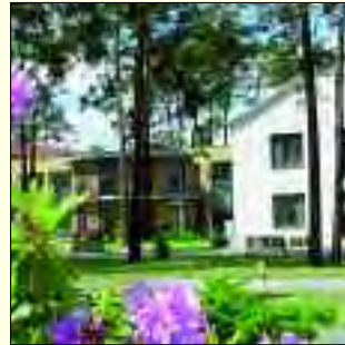
Im Humaine Klinikum ist man in guten und umsorgenden Händen

der Onkologie mit Stammzell- und Strahlentherapie, dem Schlaflabor, dem Kompetenzzentrum für Gefäßmedizin und weiteren Fachabteilungen steht dem durchweg hochqualifizierten und motivierten Personal zukunftsweisende Ausstattung zur Verfügung. Führend in Brandenburg und als einziges zertifiziert ist das Mammazentrum. Der Einsatz der Vakuumbiopsie ermöglicht eine extrem frühe sichere Diagnose von Brustkrebs und damit häufiger die Möglichkeit der schonenden brusterhaltenden Operation. Die hier angebotene Teilnahme am interdisziplinären Disease-Management-Programm ermöglicht betroffenen Frauen eine beispielhafte umfas-