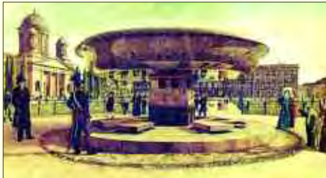
Berlin hat ein neues „Weltwunder“: Historisches Ölgemälde der Granitschale im Lustgarten von J. E. Hummel aus dem Jahre 1831

respektlos nannten die Berliner sie „Suppensüssel“. Die Herkunft des Gesteins, war lange Zeit umstritten. Goethe erklärte: »Mir mache man aber nicht weis, dass die in den Oderbrüchen liegenden Gesteine, dass der Markgrafenstein bei Fürstenwalde weit hergekommen sei; an Ort und Stelle sind sie liegen geblieben, als Reste großer, in sich selbst zerfallender Felsmassen.« 1925 ergab eine genauere geologische Untersuchung, dass der Block aus südschwedischen Karlskamm-Granit stammt. Durch mächtige Eiszeitströme wurde der schätzungsweise 780 Tonnen Granit bis ins märkische Land gespült und ist eines der beliebtesten Ausflugsziele des Umlandes.