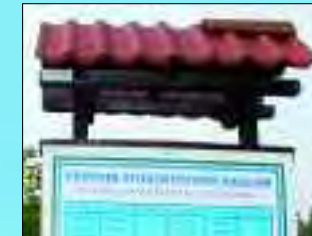
Storchenchronik in Radlow

am ehemaligen Gutsschloss, das heute sanierte moderne Wohnungen beherbergt, ist ein weiterer Beleg für die Idylle des Ortes, mit heute 562 Einwohnern. Nur wenige Meter entfernt öffnet sich der Schilfgürtel am Strandbad Radlow mit seiner modernen Steganlage und einem Abenteuerspielplatz und gibt den Blick auf den See