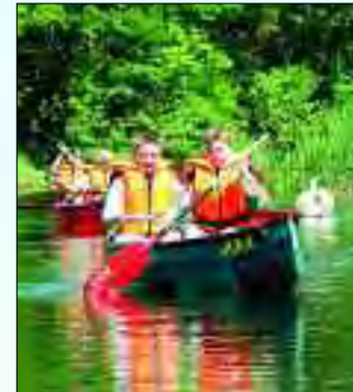
Kanuspaß am Glubigsee

Konkurrenz zu den Berufsfischern fischreiche Beute. Auch in der Spree bei Beeskow oder in Groß Schauen, wo das Fischereimuseum der Fischerei Köllnitz einlädt und auch der Hobbyangler Gerät und gute Tipps bekommt: