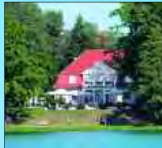
Bäderarchitektur, das Parkcafé

zium-Solequelle in 175 Metern Tiefe, die ein Wüschelrutengänger gefunden haben soll. Seit 1996 sprudelt aus 457 Metern eine zweite Solequelle. In den „Goldenen Zwanzigern“ suchte Prominenz aus Politik, Kunst und Sport am See Ruhe und Entspannung vom quirligen Berlin, zu jener Zeit die aufregendste Metro- pole Europas. Unter ihnen die UFA-Stars Käthe Dorsch, Victor de Kowa, Harry Liedke