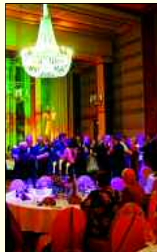
Perfekt für jedes Event: Das Kulturhaus – hier der Opernball.

originalgetreu erhalten ist. Wer also den Charme der Aufbaujahre der DDR hautnah erleben möchte, ist im Kulturhaus goldrichtig. Ob Firmenevent mit Ostrock-Party, Familienfeier oder Ihre eigene Musik-Veranstaltung: Die Palette im historischen Kulturpalast reicht vom großen Saal mit großer Bühne über das Vestibül mit Bar und Küche bis hin zu Clubräumen und Ballettsaal.