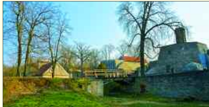
Dient häufig als Kulisse für historische Filme: Die alten Gemäuer der Industriedenkmale, wie die Rumford-Öfen oder die Schachofenbatterie.

an mit seinen verborgenen Winkeln, überraschenden Blickachsen und seiner geschichtsträchtigen Industriearchitektur. Der ganze Ort atmet Geschichte. Ob Schachofenbatterie, Steigerhaus oder Rumford-Öfen – es gibt zahlreiche traumhafte Orte für Konzerte, Familienfeiern, Tagungen und vieles mehr. Für Besucher von außerhalb haben wir auch Übernachtungsmöglichkeiten im Jugendherbergs-Standard.