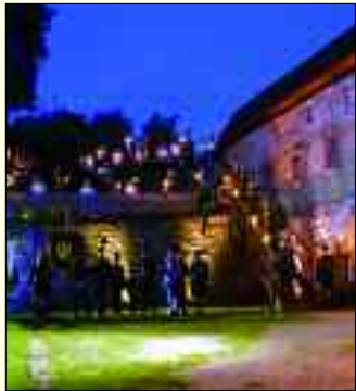
Die Bergbautradition wird jedes Jahr in Rüdersdorf gefeiert.

Am noch aktiven Kalksteingebau ist der größte Museumspark für Industriegeschichte entstanden. Er zieht Jahr für Jahr viele Besucher von nah und fern