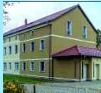
Herzfelde, Lindenstraße 1

Wohnen in Rüdersdorf und Hennickendorf gut und bezahlbar – natürlich in Wohnungen der WBG Rüdersdorf GmbH und der Kommunalen Wohnungsverwaltungsgesellschaft Hennickendorf mbH. Diesen Leitgedanken haben sich die Mitarbeiterinnen und Mitarbeiter der Wohnungsgesellschaft zu Eigen gemacht. Die Lebensqualität für die Bürgerinnen und Bürger stetig zu verbessern ist der Ansporn der Belegschaft. Hierbei stehen der zuvorkommende Service und die kompetente Betreuung der Kunden im Vordergrund. In den vergangenen Jahren wurden viele Wohnungen in der Gemeinde Rüdersdorf saniert und altersgerecht umgebaut.