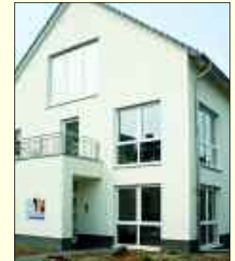
Die neue und moderne Praxis in der Hermannstraße.

Aber das Allerwichtigste ist die fröhliche und lockere Atmosphäre, sorgt die doch dafür, dass selbst die größten Angsthäsen bei der Behandlung entspannen können. Die Zahnärztin Constanze Lange sichert eine moderne und qualitativ hohe zahnmedizinische und kieferorthopädische Versorgung durch kontinuierliche Weiterbildung und lange Berufserfahrung. Behandlungsschwerpunkt und große Lei-