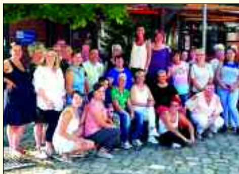
Das freundliche Team von medimobil® geht einfühlsam auf die Wünsche ihrer Klienten ein.