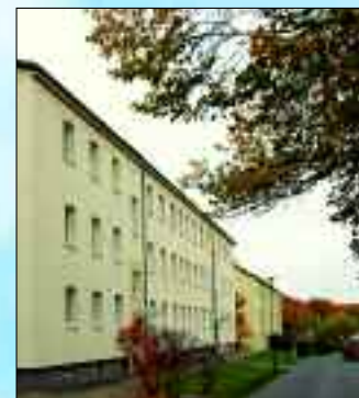
Sehr beliebt: Die Wohnungen in der Puschkinstraße in Rüdersdorf

verständlich sind beide Häuser dann mit Aufzügen ausgestattet. Zur Belebung des Ortskernes werden darüber hinaus in den Erdgeschossen mehrere Gewerbeeinheiten entstehen.