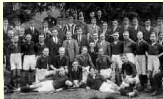
Die Rüdersdorfer Fußballer in den Zwanzigern des letzten Jahrhunderts.

Es soll auf jeden Fall im Jahr 2019 eine große Fußballparty geben. In Vorbereitung dazu wurde schon ein Organisationsteam gegründet. Als zentraler Termin der Feierlichkeiten steht der 21. bis 23. Juni