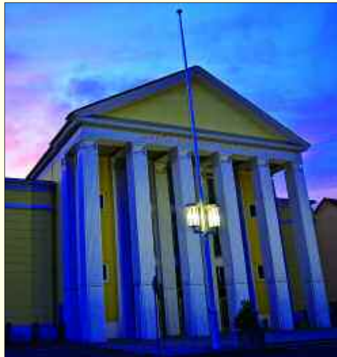
Das Kulturhaus Rüdersdorf besticht durch seine Einmaligkeit.

imposante Kulturhaus. Es wurde jüngst zum einzigen Gebäude seiner Art erklärt, das innen wie außen noch so