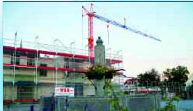
Große Herausforderung für die WBG: Neue Gebäude am Marktplatz.

Dass trotz hoher Investitionskosten die Mieten weiterhin sozial verträglich bleiben, wird in Rüdersdorf immer wieder lobend erwähnt. Bei beiden Wohnungsgesellschaften findet