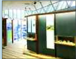
Ausstellung zur Geschichte des Kalksteins im Otto-Torell-Haus.

Der Museumspark ist längst zum Begriff geworden und lockt jährlich viele Besucher in die Gemeinde, die im Freiluftmuseum eine Reise durch die Zeit unternehmen können. Auf einem Areal, das etwa 17 Hektar umfasst, können große und kleine Besucher die beeindruckenden Industriedenkmäler der Baustoffindustrie entdecken. Der Besuch im Museumspark wird zu einer Reise, bei der man die Gewinnung und Verarbeitung von Kalkstein kennen lernt. Von den Anfängen der Kalkgewinnung, der Nutzbar-