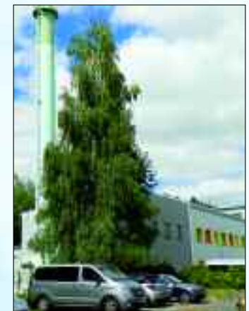
Wärmeerzeugungsanlage Friedrich-Engels-Ring 26

Die Wärmeversorgungsgesellschaft Rüdersdorf sorgt als Tochtergesellschaft der WBG Rüdersdorf in diesem Zusammenhang vor allem für den kontinuierlichen Ausbau der Fernwärmeversorgung in eigenen und fremden Wohnungsbeständen und Einrichtungen. Dafür betreibt sie in Rüdersdorf die mit neuester Technik ausgerüstete Wärmeerzeugungsanlage im Bereich des Friedrich-Engels-Ringes.