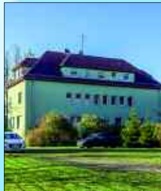
Gemütlich wohnen im Grünen: Hennickendorf, Stienitzstraße 15

Mit großem finanziellen Aufwand gelang es, in Hennickendorf den Leerstand weiter zu senken und damit das Wohngebiet attraktiver zu gestalten. Bei all ihren Aufgaben sehen sich die WBG Rüdersdorf mbH und die KWVG Hennickendorf mbH als serviceorientierte Dienstleister für ihre Mieter.