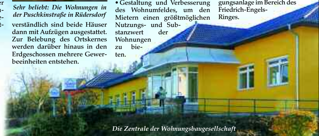
Die Zentrale der Wohnungsbaugesellschaft

Die Wärmeversorgungsgesellschaft Rüdersdorf sorgt als Tochtergesellschaft der WBG Rüdersdorf in diesem Zusammenhang vor allem für den kontinuierlichen Ausbau der Fernwärmeversorgung in eigenen und fremden Wohnungsbeständen und Einrichtungen. Dafür betreibt sie in Rüdersdorf die mit neuester Technik ausgerüstete Wärmeerzeugungsanlage im Bereich des Friedrich-Engels-Ringes.