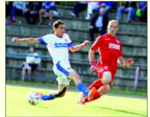
Spielszene aus dem legendären Spiel MSV Rüdersdorf gegen Energie Cottbus 2015.

2008 wurde das erste Rüdersdorfer Stadionfest begangen, eine Art sportliches Volksfest für Jung und Alt. Im Jahre 2009 wurde ein lang geplantes Pro-