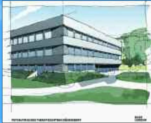
Bauzeichnung des Psychiatricanbaus.

Willkommen in der Immanuel Klinik Rüdersdorf und der Poliklinik Rüdersdorf. Wir geben täglich unser Bestes für unsere kleinen und großen Patientinnen und Patienten sowie Mitarbeitenden. Unser großes internes und externes, regionales und überregionales Netzwerk hilft uns dabei. In der Poliklinik Rüdersdorf versorgen deshalb 15 Haus- und Fachärzte gemeinsam die Patientinnen und Patienten mit einem breit gefächerten medizinischen Leistungsangebot unter einem Dach. Moderne Behandlungsmethoden zeichnen die