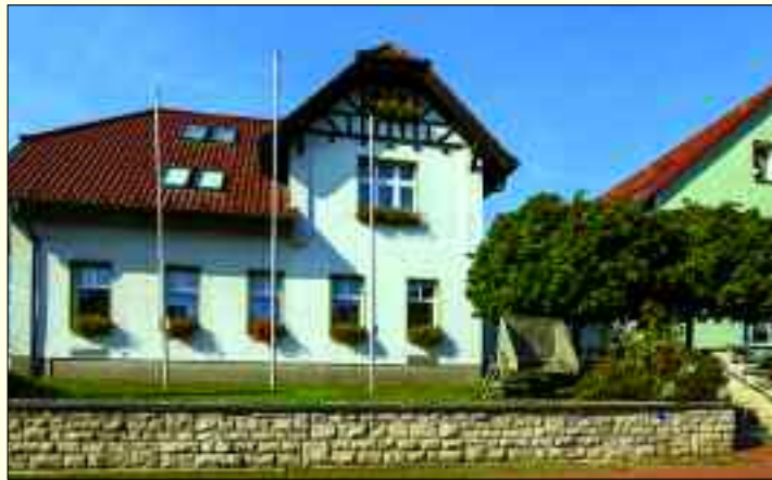
Das Rathaus von Hennickendorf beherbergt auch das Heimatmuseum.