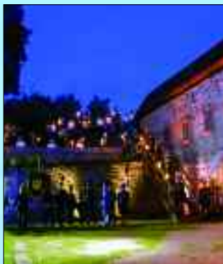
Die Bergbautradition wird jedes Jahr in Rüdersdorf gefeiert.

Tel. 03 36 38/79 97 97 kasse@museumspark-kulturhaus.de