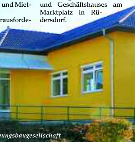
Die Zentrale der Wohnungsbaugesellschaft

Errichtung eines neuen Wohn- und Geschäftshauses am Marktplatz in Rüdersdorf.