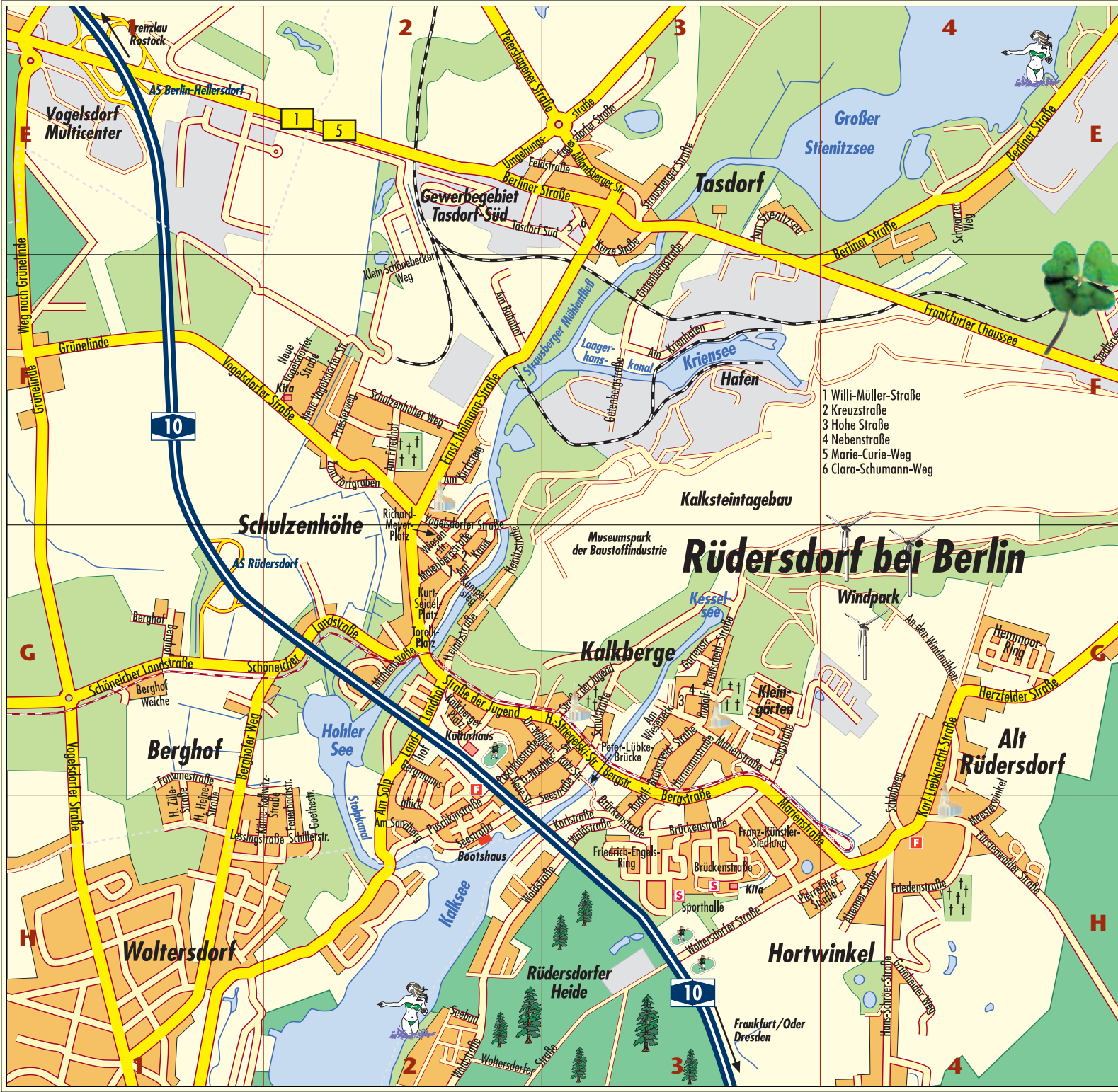
Eingang zum Museumspark Rüdersdorf