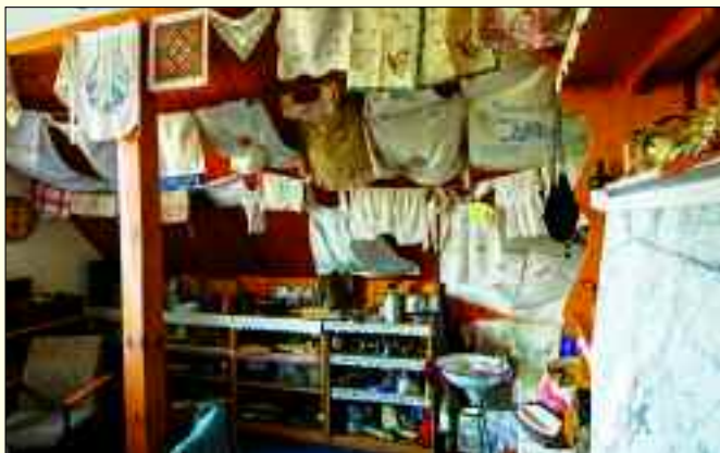
Liebevoll zusammengetragen: Alltagsgegenstände vergangener Zeiten.

Im Heimatbuch des Kreises Niederbarnim „Zwischen Schorfheide und Spree“, Ausgabe 1940, ist der Ursprung von Hennickendorf so beschrieben: „Hennickendorf wurde zwischen 1231 und 1258 vom Kloster Zinna erworben. In dieser Zeit schenkten die Markgrafen Johann I. und Otto III. dem Kloster laut einer Urkunde das Dorf Ponatendorf, den See zu Studenitz und die Mühle Kalksee.“ Aus dem See zu Studenitz ist heute der bekannte Stienitzsee geworden.