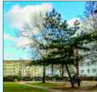
Liebevoll gestalteter Innenhof in der Brückenstraße.

stehenden Wohnraum und Mietpreise erkundigen. Eine der größten Herausforderungen für die Wohnungsbaugesellschaft im Jahr 2018 ist die