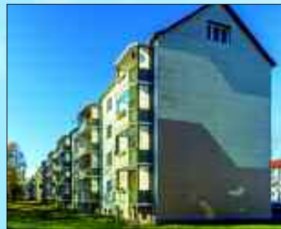
Hennickendorf, WBG Albrecht Thaer

Kunden im Vordergrund. Die Bautätigkeiten der Gesellschaften sind imponierend. In den vergangenen Jahren wurden viele Wohnungen in der Gemeinde Rüdersdorf saniert und altersgerecht umgebaut. Mit großem finanziellen Aufwand gelang es, in Hennickendorf das Wohnge-