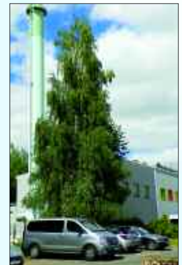
Wärmeerzeugungsanlage Friedrich-Engels-Ring 26

• Gestaltung und Verschönerung des Wohnumfeldes, um den Mietern einen größtmöglichen Nutzungs- und Substanzwert der Wohnungen zu bieten. Die Wärmeversorgungsgesellschaft Rüdersdorf sorgt als Tochtergesellschaft der WBG Rüders-