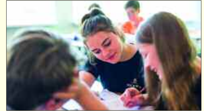
In familiärer Lernatmosphäre Begabungen entdecken.

Die Docemus Privatschulen betreiben im grünen Berliner Umland drei Campus-Standorte mit weiterführenden Schulen in Grünheide, Neu Zittau und Blumberg. An den Gymnasien und Oberschulen sowie der Fachoberschule wird viel Wert auf eine individuelle Entfaltung und hohe Allgemeinbildung gelegt. Zahlreiche Ganztagsangebote sowie ein optimales Lernumfeld sorgen für vielfältige Bildungs- und Entwicklungsmöglichkeiten. Durch die gute Anbindung an den öffentlichen Nahverkehr ist eine Anfahrt aus der gesamten Region zwischen Berlin und Frankfurt (Oder) möglich. Die Schulen folgen einem ganzheitlichen und humanistischen Bildungskonzept, welches aktuell um die Gesund-