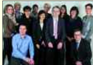
Das kompetente Meyer-Team

Neben gutem Sehen und Aussehen bietet Firma Meyer auch gutes Hören und Verstehen an. Eine beginnende Hörmindernung wird nur selten bewusst wahrgenommen. Ein kostenloser Hörtest schafft rasch Klarheit. Die Mitarbeiter nehmen sich viel Zeit, um Wünsche und Vorstellungen umzusetzen. Die Anpassung erfolgt mittels neuester Hörgeräte-technologien und beinhaltet ein kostenloses Probetragen mehrerer geeigneter Hörgeräte im persönlichen Umfeld vom eigenanteilsfreien bis zum diskreten und komfortablen Hörgerät. Stets besonderen Service bietet Firma Meyer für die dauer-