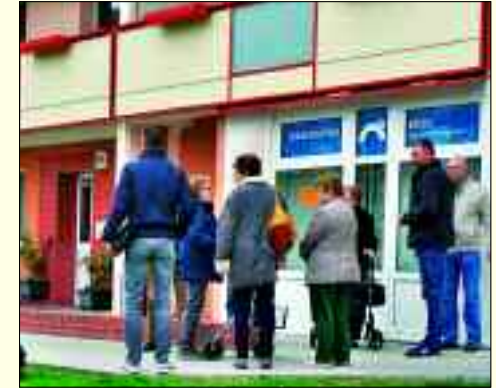
Seit zehn Jahren unverzichtbarer Bestandteil des gesellschaftlichen Lebens in Rüdersdorf: Bürgerzentrum „Brücke“

Übrigens: Die Zeitung kann während der Öffnungszeiten des Bürgerzentrums Brücke Mo. 9 – 16 Uhr, Di. 9 – 18 Uhr, Mi. 9 – 16 Uhr, Do. 9 – 17 Uhr, Fr. 9 – 14 Uhr abgeholt werden