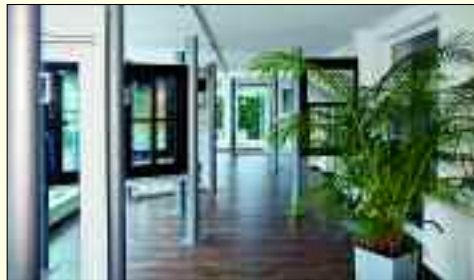
DAKU – Fenster und Türen zu fairen Preisen.

Moderne Fenster sparen nicht nur viel Energie, sie erhöhen zugleich die Wohnqualität des Gebäudes dank komfortabler Bedienung, höherer Sicherheit und einfacherer Pflege sowie dem verbessertem Schallschutz. Einen leistungsstarken Partner für neue Fenster und Türen findet man in Herzfelde bei der Firma DAKU Fensterbau GmbH. Dank der langjährigen Erfahrungen seit der Gründung 1992 besitzt sie das nötige Know-How in der Produktion und Montage von Bauelementen. Geschäftskunden und private Hauslebauer profitieren von der Qualität der DAKU-Bauelemente zu Top-Preisen. Ob per Telefon, Mail oder persönlich im neuen DAKU-Ausstellungsraum – eine fachgerechte und ausführliche Beratung ist bei DAKU selbstverständlich und wichtig zur Entscheidung über Anforderungen und Ausstattungen neuer Fenster und Türen. Unter www.daku-fenster.de kann man bequem online im neuen, modernen DAKU-Shop Fenster und Türen konfigurieren und sich gleich von den günstigen Preisen von DAKU überzeugen. In weni-