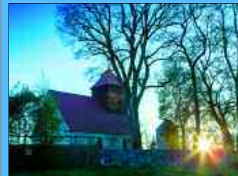
Die Dorfkirche stammt aus dem 15. Jahrhundert.

Die Dorfkirche stammt etwa aus dem Jahre 1499 und steht heute unter Denkmalschutz. Im Bereich des Dorfkerns befindet sich auch das älteste Wohnhaus des Ortes, ein Doppelstübchenhaus aus Feldstein. Das Spritzenhaus wurde unter Mithilfe der Bevölkerung 1993 völlig saniert und ist heute Zentrum für das jährlich im Juli stattfindende Dorffest.