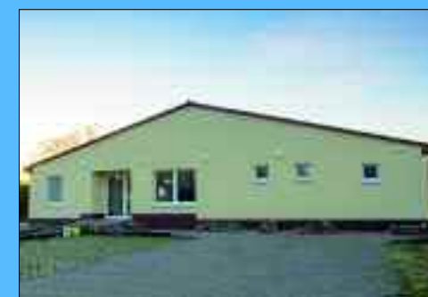
Schandfleck beseitigt – der alte Dorf-Konsum.

Durch Lichtenow führt die Bundesstraße B1/5 und direkt an der viel befahrenen Straße steht ein ganz besonderes Baudenkmal. Viele Jahre schon fast in Vergessenheit geraten, lohnt es sich durchaus hier einmal kurz Rast zu machen. Auf Schautafeln kann man eine regelrechte Zeitreise unternehmen und erfährt dabei, dass mit der Produktion von Ziegeln im Jahr 1910 begonnen wurde. Die Produktion wurde allerdings dann 1941 eingestellt. Hatte man nach dem Zweiten Weltkrieg noch versucht, den Ringbrennofen weiter zu nutzen, um hier Betonfertigteile herzustellen, wurde der Betrieb des einstigen Unternehmens „Ziegelwerk Lichtenow Alfred E. Albrecht“ später völlig eingestellt.