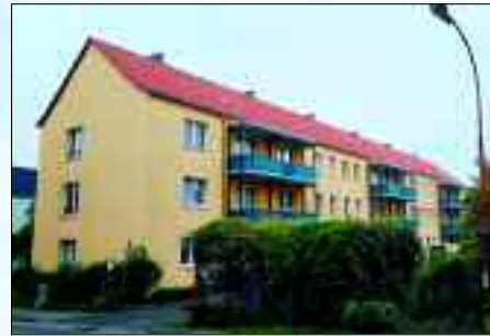
Die Mieter am Kalkberger Platz freuen sich über die neuen Balkone.

biet Albrecht Thaer zu einem beliebten Wohlfühlort in der Gemeinde zu entwickeln. Der Abriss beziehungsweise der Rückbau von Wohnblöcken in Hennickendorf wird fortgesetzt. Bereits heute ist hier altersgerechtes Wohnen möglich. Dass trotz hoher Investitionskosten die Mieten weiterhin