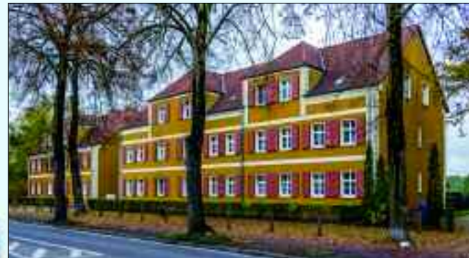
Gemütlich wohnen in Herzfelde, Möllenstraße

dorf in diesem Zusammenhang vorrangig für die weitere Verbesserung der Fernwärmeversorgung in eigenen und fremden Wohnungsbeständen und Einrichtungen unter besonderer Beachtung des Umweltschutzes. Dafür betreibt sie in Rüdersdorf die mit neuester Technik ausgestattete Wärmeerzeugungsanlage im Bereich des Friedrich-Engels-Ringes.