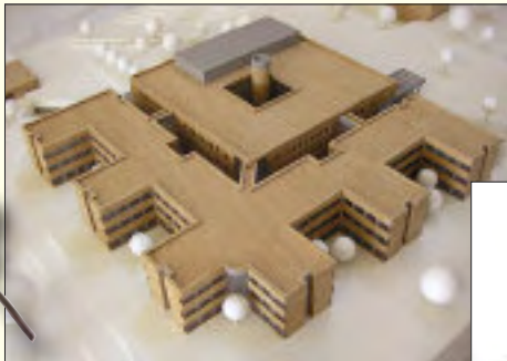
Modell des neuen Krankenhauses

Das Evangelisch-Freikirchliche Krankenhaus Rüdersdorf hat den Versorgungsauftrag als Krankenhaus der Regelversorgung. Es ist eine Einrichtung der Krankenhaus und Poliklinik Rüdersdorf GmbH und diese ist eine Gesellschaft der Immanuel Diakonie Group.