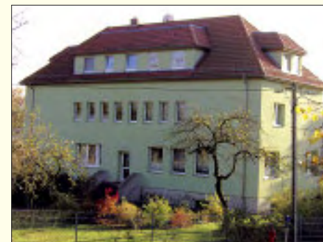
Wohneinheiten in Hennickendorf

Auch in anderen Wohnbereichen in Hennickendorf wurde investiert und das Wohnen für viele Hennickendorfer Bürger attraktiver gestaltet. Einige Beispiele belegen die eindrucksvolle Bilanz des Unternehmens. Es gibt aber auch noch viel zu tun in Hennickendorf und Rüdersdorf. Der demografische Wandel macht leider vor den Toren der Großgemeinde nicht halt, so dass sich alle Entscheidungsträger zukünftig etwas einfallen lassen müssen, um den unliebsamen Randerscheinungen, wie Bevölkerungsrückgang oder Wohnungsleerstand, entgegenzuwirken. Anknüpfend an die bishe-