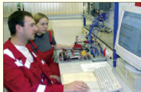
Elektroniker im Betriebspraktikum

geben den Azubis Lernziele und -programme vor und werten gemeinsam die Ergebnisse aus. Doch oftmals sieht die Praxis etwas anders aus. Lückenhaftes Basiswissen aus der Schule muss durch zeitaufwendige, zusätzliche Lerneinheiten ergänzt beziehungsweise wiederholt