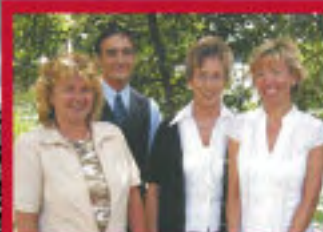
Geschäftsstelle Hennickendorf 15378 Hennickendorf Berliner Straße 3 Tel.: 033434 409-0

Nähe ist bei uns kein Zufall, sondern Absicht.