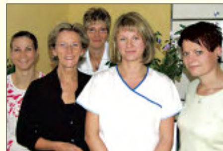
Freundlich, kompetent und zuverlässig – das ist das Team der Gemeinschaftspraxis Wirthwein in Rüdersdorf

Zahnarztpraxis Wirthwein Woltersdorfer Straße 39 15 562 Rüdersdorf Tel. 03 36 38/22 50 Sprechzeiten Mo-Do 8-20 Uhr Fr 8-12 Uhr