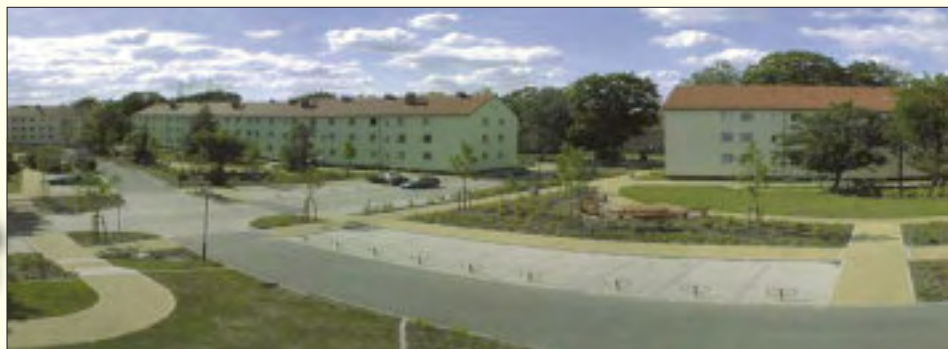
Das Wohngebiet Puschkinstraße hat sich zu einem schönen lebenswerten Wohnbereich entwickelt

rigen Ergebnisse bei der Ausgestaltung und Prägung der Großgemeinde werden die Unternehmen WBG Rüdersdorf mbH und Kommunale Wohnungsverwaltungsgesellschaft Hennickendorf mbH auch zukünftig an dieser doch sehr honorigen Aufgabe intensiv mitwirken.