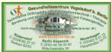
Vier Orte zum Leben 5. Auflage/ Firmenportraits

Kopfschmerzen, steifer Nacken, Verspannung, und Rückenschmerzen sind oftmals die Folgen einer schlechten Schlafhaltung. Auf Matratzen und Kissen aus TEMPUR® können Wirbelsäule und Gelenke in ihrer natürlichen Position ruhen. TEMPUR® ist ein spezieller Schaumstoff, der eine nachweisbar bessere Druckentlastung, sowohl bei geringer als auch bei starker Gewichtsbelastung bietet. Kompetent beraten wird auch rund um Orthopädie, Technische Hilfen, Rehabilitation, Gesundheit, Schönheit, Fitness und Lebensqualität.