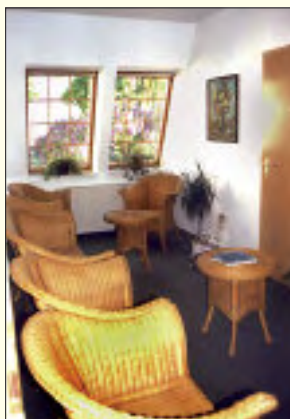
Das gemütliche und beruhigend wirkende Wartezimmer

Da sich die Praxis direkt am Wohnhaus befindet wird in Notfällen auch am Wochenende behandelt. Hausbesuche und die täglichen Sprechzeiten von 8 bis 20 Uhr garantieren die sehr gute Rundumbetreuung der Patienten.