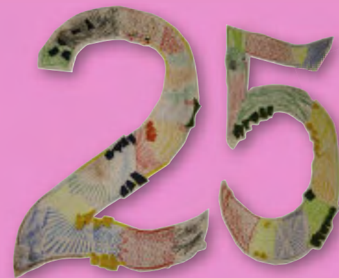
Diese Zahl wurde von den Sprösslingen gestaltet und schmückte die Tür zur Kita