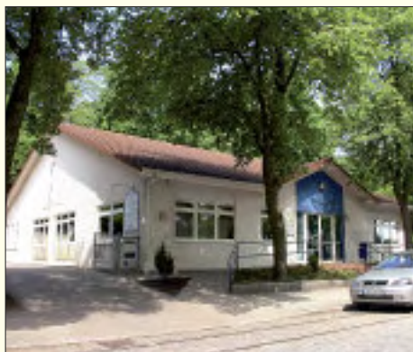
In der Geschäftsstelle der WBG in Rüdersdorf finden Mieter immer einen freundlichen Ansprechpartner für ihre Fragen

Getreu dem Spruch Goethes: „Es ist nicht genug zu wissen, man muss es auch anwenden, es ist nicht genug zu wollen, man muss es auch tun“, stellen die Mitarbeiter und Mitarbeiterinnen mit ihrem Wirken ihren gesellschaftspolitischen Auftrag Wohnraum mit sozial verträglichen Mieten bereit. Man bietet hier auf Grund jahrelanger Erfahrungen kompetent und zukunftsorientiert Sicherheit in allen Fragen bei der Bewirtschaftung von Wohnräumen. Die Wohnungsgesellschaften wollen mit ihren Angeboten auch in Zukunft die Position der kommunalen Gesellschaften im Wohnungsmarkt behaupten und auf Dauer festigen. Mit den Dienstleistungen der Gesellschaften sind sie ihren Kunden ein moderner und leistungsstarker Partner in allen Fragen rund um die Immobilie. Mit ihren Dienstleistungsangeboten sind die Wohnungsgesellschaften in Rüdersdorf und Hennickendorf leistungsstarker Partner rund um die kommunalen Immobilien der Gemeinde Rüdersdorf bei Berlin. Seit nunmehr 16 und 13 Jahren sind