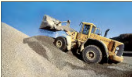
Kie- und Splitt bilden die Grundlage für hochwertiges und natürliches Bauen

In ihren Werken gewinnt die Cemex Kies und Splitt GmbH das wertvolle Baumaterial und bereitet es kundengerecht auf. Es bildet die Grundlage für hochwertiges, natürliches Bauen im Hoch-, Tief- und Straßenbau. Deshalb hat die Cemex Kies und Splitt GmbH einen zufriedenen Kundestamm im Raum Berlin und Brandenburg. Denn egal ob Großbaustelle oder für den Bau des privaten Eigenheims – die Cemex GmbH ist dafür genau der richtige Ansprechpartner. Kompetent geschultes Personal steht gern direkt vor Ort oder telefonisch zur Verfügung.