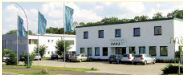
Die DAKU Fensterbau GmbH ist mit ihrem Sitz an der B1 in Herzfelde, leicht zu finden

Energiekosten steigen und steigen, daran kann man nichts ändern. Aber an den eigenen Fenstern, denn diese sind häufig wahre Energiekiller. Hier verpufft die teuer bezahlte Wärme oft durch undichte Rahmen, Einfachverglasung oder veraltetem, unbeschichtetem Isolierglas in die Atmosphäre. Der Einbau neuer wärmegeämmter Fenster ist also die vordringlichste Investition zum Energiesparen am Haus und wird durch staatliche Förderprogramme unterstützt. Die DAKU Fensterbau GmbH aus Herzfelde ist ein kompetenter Partner, wenn es um den Austausch alter Fenster geht. Bei einer ausführlichen Fachberatung wird man über Fenster aus Holz, Aluminium und Kunststoff sowie über Haustüren und Türen