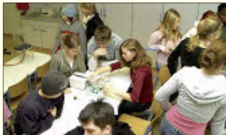
Das Rüdersdorfer Gymnasium gehört zu den 100 Besten in Deutschland

Das Heinitz-Gymnasium setzt die über 50jährige Tradition der Abiturausbildung in Rüdersdorf fort – in einem sanierten Gebäude in gut eingerichteten Fachräumen, die mit modernster Technik ausgestattet sind. Die Schule bietet ein breites Angebot an Fremdsprachen. Schüler und Lehrer arbeiten auch im offenen Ganztagsprogramm zusammen. Neben fundiertem Fachwissen werden so auch Lerntechniken, Problemlösungsstrategien und soziale Kompetenzen entwickelt und geschult. Begabungen werden gefördert, Niveauunterschiede ausgeglichen, und die Schüler können in Arbeitsgemeinschaften ihren Interessen und Neigungen nachgehen. Das freundliche, aufgeschlossene Klima an der Schule weckt die Leistungsbereitschaft und motiviert die Schüler. Bei überschulischen Wettbewerben wie „Jugend forscht“, dem Bundesfremdsprachenwettbewerb oder dem Wettbewerb „Jugend trainiert für Olympia“ belegen die Schüler des Heinitz-Gymnasiums die vorderen Plätze. Neben drei siebten Klassen wurde in diesem Jahr eine Leistungs- und Begabungsklasse mit fremdsprachlichem Profil eingerichtet. Kinder mit besonders guten Leistungen lernen bereits ab der