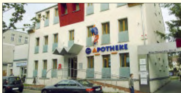
Die Pohl-Apotheke in der Rüdersdorfer City

Pohl-Apotheke Otto-Nuschke-Straße 2 15 562 Rüdersdorf Tel. 03 36 38/48 09 90 Fax 03 36 38/48 09 91 www.pohl-apotheke.de