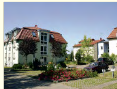
Das Wohngebiet „Zum Seeblick“ bietet solventen Mietern einen attraktiven Wohnbestand in einer Eigentumsanlage mit 18 Wohneinheiten.