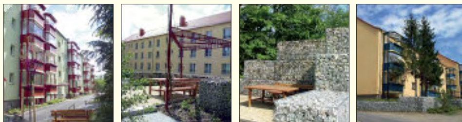
Unter Einbeziehung des Rüdersdorfer Kalksteines wurde am Kalkberger Platz durch die Gesellschaft ein Kleinod an architektonischer und landschaftsgärtnerischer Gestaltung geschaffen.

Wohnungsbaugesellschaft Rüdersdorf mbH Straße der Jugend 32 • 15 562 Rüdersdorf bei Berlin Tel. 03 36 38/75 70 • Fax 03 36 38/7 57 28