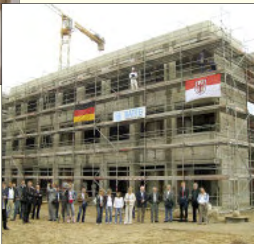
Richtfest am 13. Juli 2007

Ein von Hebammen geführter Kreißsaal begleitet die werdenden Eltern in angenehmer, entspannter Atmosphäre individuell, familienorientiert, diskret und doch mit der notwendigen medizinischen Sicherheit. Eine Betreuung der Geburt nach den Empfindungen der Mutter hat Priorität. Auf der Wochenstation werden Mütter und Neugeborene vom Pflegeteam der Station und ihrer Hebamme umsorgt, erhalten Unterstützung bei der Versorgung des Kindes und Hilfestellung beim Stillen.