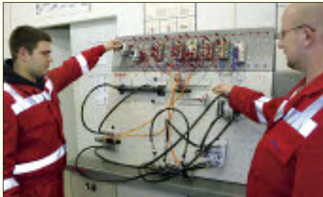
...sind Garant für einen guten Start in das spätere Berufsleben

Durch das duale Ausbildungssystem werden die Lernorte Schule und Praxis miteinander verknüpft und tragen so entscheidend zur beruflichen Qualifikation bei. Die Ausbildung ist praxisorientiert und die Auszubildenden werden dabei in reale Arbeitsprozesse eingebunden, übernehmen Mitverantwortung und sammeln wichtige Erkenntnisse für ihre spätere Tätigkeit. Die Übertragung von Projektarbeiten soll die Teamfähigkeit und den positiven Umgang mit Konflikten schulen. Durch die Einführung neuer Berufsbilder in die Ausbildung soll eine Anpassung an den technischen Fortschritt erfolgen. Seit Jahren stellt man sich dieser Aufgabe mit Erfolg. Dabei ist der Einsatz neuer Ausbildungsmedien selbstverständlich. Neben dem selbständigen Lernen in Gruppen hält auch das interaktive Lernen Einzug in die Ausbildung. So können Lernsequenzen am Computer vom Azubi im Selbststudium genutzt werden. Die Ausbilder sollen die Ausbildungscoaches der Auszubildenden sein. Sie