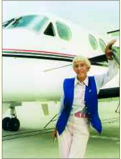
Unternehmerin und Freizeitpilotin

Es folgte die Ausbildung zur Kunstfliegerin. Ihr Lehrer war ein gewisser Hans-Jürgen Uhse. Er wurde später ihr Ehemann.