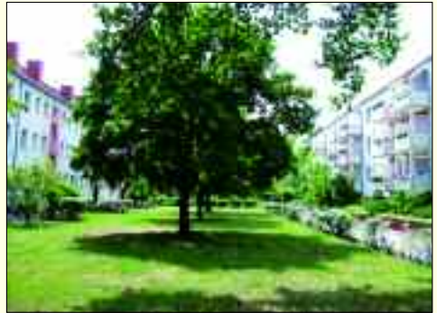
Gut wohnen & leben bei der Wohnungsgenossenschaft „Funk“ eG

Die 1957 gegründete Wohnungsgenossenschaft hat ihren Sitz in Rangsdorf. Im Zentrum der Geschäftstätigkeit stehen die Verwaltung der 353 eigenen Wohnungen und deren Mieter in Rangsdorf und Blankenfelde sowie die Betreuung der rund 470 Mitglieder. Das grundlegende Prinzip einer Genossenschaft beruht darauf, dass Ziele oft gemeinsam besser zu erreichen sind als im Alleingang. Dabei werden die traditionell genossenschaftlichen Prinzipien wie Selbstbestimmung, Selbstverantwortung, Selbsthilfe und Selbstverwaltung gepflegt. Die WG sieht sich als modernen Dienstleister, in dessen Mittelpunkt der Mensch mit seinen Wohnbedürfnissen steht. Die Wohnungsgenossenschaft verbindet die Flexibilität einer Mietwohnung mit der Sicherheit von Wohneigentum. Man ist praktisch Mieter im eigenen Haus und genießt als wohnendes Mitglied ein lebenslanges Wohn- und Nutzungsrecht. Neben dem Eigenbestand betreut die WG Wohnungen, Gewerbeeinheiten, Häuser und Pachtgrundstücke der Gemeinde Rangsdorf. Darüber