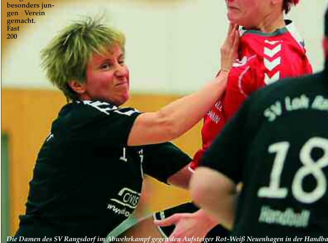
Die Damen des SV Rangsdorf im Abwehrkampf gegen den Aufsteiger Rot-Weiß Neuenhagen in der Handball

hat Lokomotive Rangsdorf für sie Wichtiges zu bieten. Denn in einer Mannschaft entwickeln Kinder und Jugendliche Teamgeist,