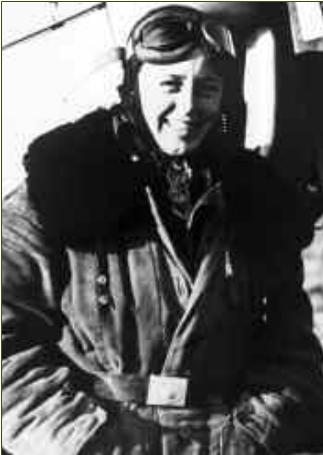
Beate Uhse als Kunstfliegerin

In der Fliegerschule Rangsdorf hatte die zierliche Beate Köstlin – wie sie damals noch hieß – auch ihre Grundausbildung genossen. Sie war eine gelehrige Schülerin. Schon drei Wochen nachdem sie an der Seite ihres Fluglehrers zum ersten Mal am Steuerknüppel saß, startete sie zu ihrem ersten Alleinflug. Und weitere drei Wochen später schloss sie mit einem Solo-Überlandflug von Rangsdorf über Magdeburg, Halle und Leipzig zurück nach Rangsdorf ihre Ausbildung ab. An ihrem 18. Geburtstag wurde ihr der Flugzeugführerschein überreicht.