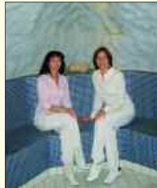
Verwöhnprogramm auf ganzer Linie – garantiert

was dem Körper gut tut. Darüber hinaus berät sie bei Hautproblemen und bietet Farb- und Typberatungen an.