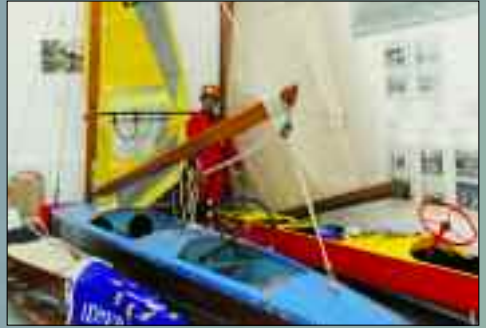
Diese und mehr Exponate sind zu entdecken

Ein unbedingtes Muss für die Besucher von Rangsdorf ist das Bucker-Luftfahrt-Museum. Es befindet sich am Eingang zum Strandbad am Rangsdorfer See. Das Museum gibt einen umfassenden und sehr informativen Über- und Einblick in die Luftfahrtgeschichte, die zu einem wesentlichen Kapitel in Rangsdorf mitgeschrieben wurde. Das Museum wurde am 1. April 2001 eröffnet und wird heute durch den Förderverein Bucker-Museum gepflegt und betreut. Der Verein bietet auch Führungen nicht nur für Fachbesucher an. Wer Interesse hat, kann sich an den 1. Vorsitzenden Knut Hentzschel wenden. Er ist unter der Rangsdorfer Telefonnummer 03 37 08/92 00 66 oder via E-Mail Knut.Hentzschel@buecker-museum zu erreichen. Inzwischen bietet das Museum auch Informationen zur Heimatgeschichte von Rangsdorf. So ist eine Dauerausstellung mit dem Titel „Rangsdorfer Geschichte“ eingerichtet, zu der Dr. sc.phil. Siegfried Wietstruck ein Begleitbuch vorbereitet hat. Interessant ist bei der Betrachtung der Geschichte der Bucker-Werke in Rangsdorf auch die Tatsache, dass viele Zwangsarbeiter während des Zweiten Weltkrieges in den Flugzeugwerken arbeiten mussten. So erzählt eine Schautafel vom Schicksal des Ukrainers Berl (Boris) Kostinski, der von September 1942 bis Juli 1944 in den Werken als Kriegsgefangener arbeitete.