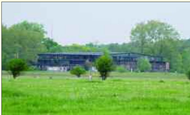
Alte Werkshallen stehen heut unter Denkmalschutz und ...

fers in einem Buch mit dem Untertitel „Vom Marineflieger zum Flugzeugkonstrukteur“ aufgeschrieben und veröffentlicht. Am 11. Februar wurde Carl Clemens Bucker in Ehrenbreitsein (Ehrenbreit-