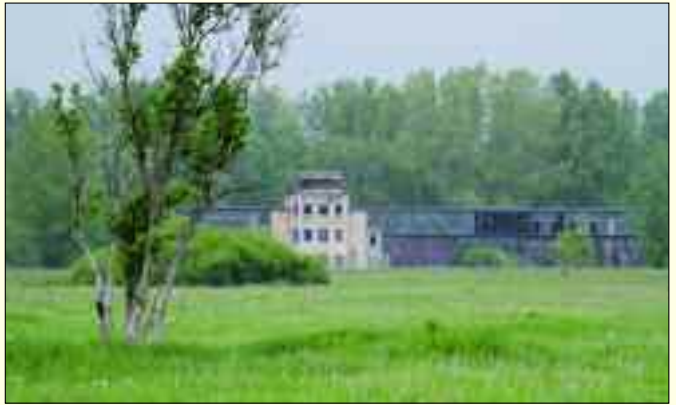
... stellen ein Stück Industriegeschichte Rangsdorfs dar