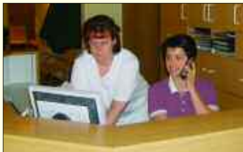
Das freundliche Praxis-Team

D rei Zahnärzte, eine Kieferorthopädin, zwei Prophylaxehelferinnen, eine Zahntechnikerin und sieben zahnmedizinische Fachangestellte betreuen seit 1991 in der Praxis in der Fichtestraße 3 ihre Patienten mit einem umfassenden Service.