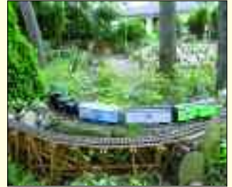
Leise dampft es in seinem Garten – Runde um Runde

der bremsenden S-Bahn fasziniert. Naja und dann kam ich doch zur Bahn“. Betriebs- und Verkehrseisenbahner hatte er gelernt und später als Lokschlosser umgesetzt.