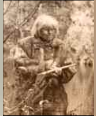
Anregung und Ideen fand sie auch in der Natur