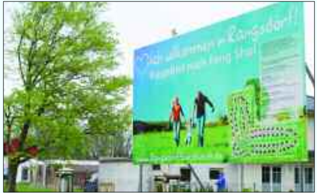
Leben in Harmonie – Leben in Rangsdorf

F eng-Shui (ausgesprochen fang-schuei), das Muster von Wind und Wasser, ist die Kunst und Wissenschaft vom Leben in Harmonie mit der Umgebung. Seit Jahrhunderten bauen die Chinesen auf Feng-Shui, wenn es darum geht, Städte zu entwerfen, Häuser zu bauen. Nach der chinesischen Philosophie beruht alles Leben auf Energie, Qi (oder Chi, A.d.R.) genannt. Diese Qi-Energie durchströmt uns Menschen, genauso aber Häuser, Gärten und Landschaften. Im Feng-Shui, das wesentlich auf der Lehre vom Qi-Fluß beruht, geht es darum, Wohlbefinden und Wohlstand zu fördern, anders gesagt: für so viel positive Energie wie möglich zu sorgen. Und genau diese Grundsätze einer jahrhundertalten Philosophie flossen in die Planung eines ganzen Gemeindeteils in Rangsdorf mit ein. Die Feng-Shui Siedlung ist heute ein echtes Schmuckstück: Nicht nur Grundstücks-Interessenten finden sich hier ein, sondern auch Schaulustige und Feng-