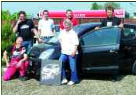
Das Team der Guhde Kfz-Technik ist stets mit viel Kompetenz für seine Kunden da