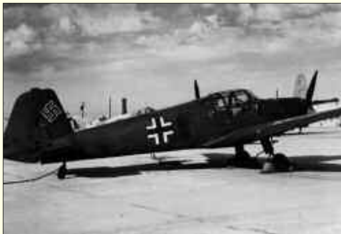
Im Zuge der Rüstungsproduktion wurden auch Kampfflugzeuge gebaut