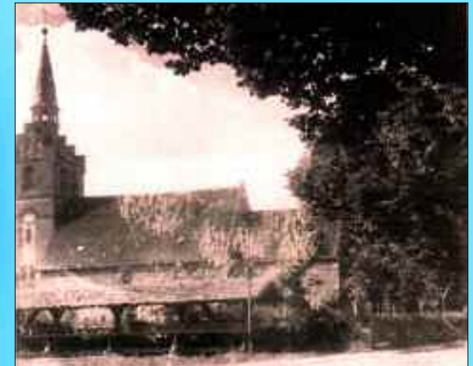
Historische Aufnahme der Kirche in Schwanebeck