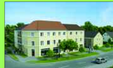
Aktuelles Projekt: Alt-Zepernick 18/19