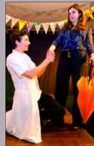
Unschuld vom Lande trifft Heiratschwindler.

Alles in allem: Auch die sogenannten „anderen“ Darsteller überzeugen mit einer witzig-frischen und temperamentvollen Inszenierung. Egal ob als sportbegeisterter und schnitzelbrötchenliebender Sportlehrer oder als gelassen-humorvolle Deutsch-Lehrerin – ganz offensichtlich haben die jungen Mimen die Unterrichtszeit für genaue Studien genutzt.