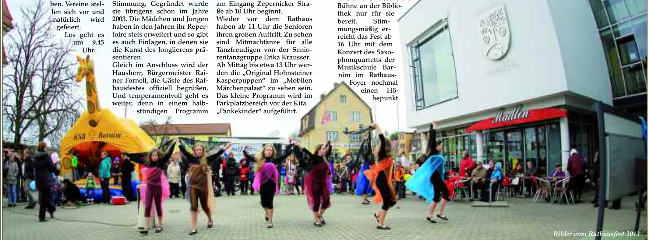
Bilder vom Rathausfest 2013

Also, wer den 26. April am Rathaus verpasst, der darf sicher sein, er hat etwas verpasst!