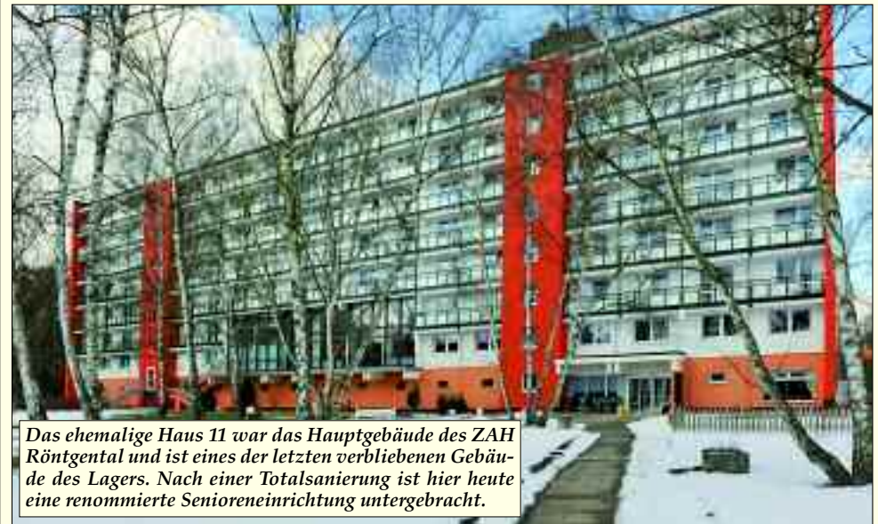
Das ehemalige Haus 11 war das Hauptgebäude des ZAH Röntgental und ist eines der letzten verbliebenen Gebäude des Lagers. Nach einer Totalsanierung ist hier heute eine renommierte Senioreneinrichtung untergebracht.