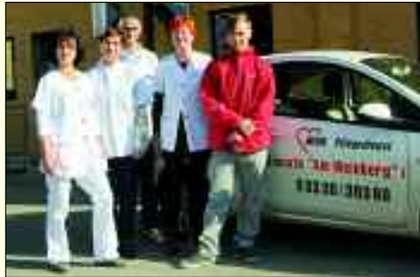
Das freundliche Team des ambulanten Pflegedienstes setzt sich für die Pflegebedürftigen ein.