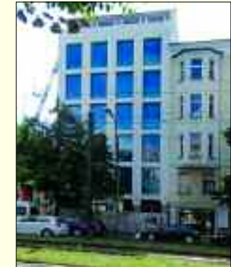
Dämmarbeiten in der Berliner Torstraße