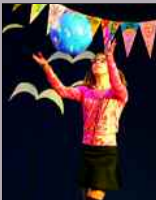
Die Welt ist ein Bermudadreieck und Panketal mittendrin.

Unter dem Titel „Bermudadreieck“ der Panketaler Gymnasialen geht es allerdings sehr humorvoll zu. „Scheidungsdrohungen, Hochwasser, Fische