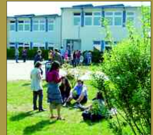
Gymnasium Panketal – erfolgreich Lernen in grüner Umgebung.

Das Gymnasium Panketal bereitet seine Schüler umfassend auf Studium und Beruf vor. Dazu gehören nicht nur Praktika in Klasse 9 und 10, praktischer Unterricht, Exkursionen und Hochschulbesuche, sondern vor allem ein ausgewogenes Profil. Neben Englisch stehen Spanisch, Latein und Französisch als Fremdsprachen zur Auswahl, ab Klasse 10 auch Informatik für alle Schüler. Das naturwissenschaftliche Profil wird schon ab Klasse 5 durch fachübergreifenden Unterricht geschärft. Aber auch regelmäßiges Experimentieren und Projektwochen, die naturwissenschaftliches Arbeiten einüben, tragen dazu bei.