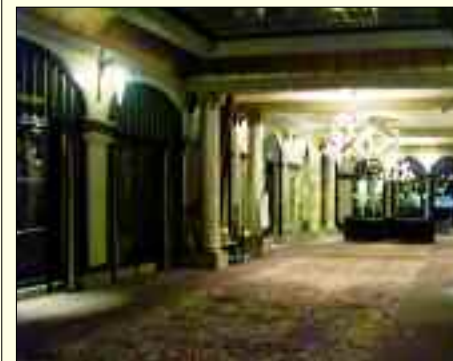
Das Marriott Hotel in Paris im Januar 2014 vor der Renovierung ...