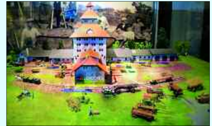
Modell des Stadtgutes Hobrechtsfelde im alten Speicher

Auf dem Gutshof gibt es neben Streichelgehege mit Ziegen und der Gelegenheit zum Ponyreiten, ein großes Schaugehege in dem die eingesetzten Weidetiere hautnah erlebbar sind. Für Kinder ist ein Themenspielplatz eingerichtet. Im Mittelpunkt steht ein Nachbau des Speichers. Hier können die Kleinen klettern, sich auf einem wippenden Wildpferd, Holzrind und einer Vogelnestschaukel vergnügen. Und damit auch die Eltern sich wohl fühlen und eine gemütliche Pause machen können, sind attrakti-