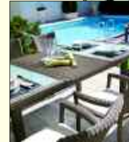
Voller Service für Freizeit und Erholung: Freizeitmarkt Oehlmann

Schlauchboote und Bootszubehör, Caravan- und Campingzubehör, eine 24 Stunden geöffnete Autogas Abfüll- und Tauschservice.