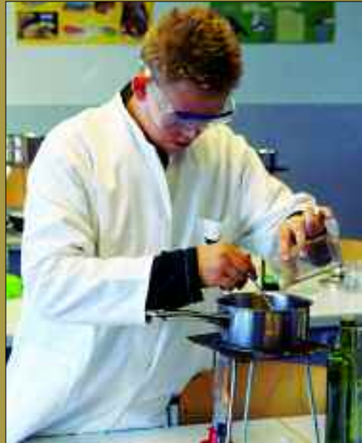
Gymnasium Panketal – Experimentieren gehört dazu

Eine überschaubare Schülerzahl und kleine Klassen, ein durchdachtes Schulkonzept, moderne Räumlichkeiten und eine sinnstiftende Umgebung: Das Gymnasium Panketal ist nicht irgendeine Lehranstalt. Hier finden bis zu 220 Schüler eine fast familiäre Atmosphäre vor, Leh-