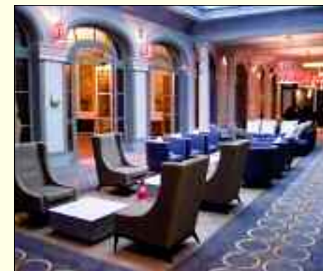
... und im Februar 2014, nach Abschluss der Arbeiten von Wentzel & Belling

Wentzel & Belling wird immer mit dem gleichen hohen Anspruch gearbeitet. Noch bevor der erste Pinsel schwingt, steht eine umfangreiche Beratung an. „Uns ist