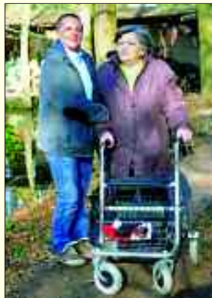
Gern übernimmt der Häusliche Pflegedienst R&S auch den Begleitservice.