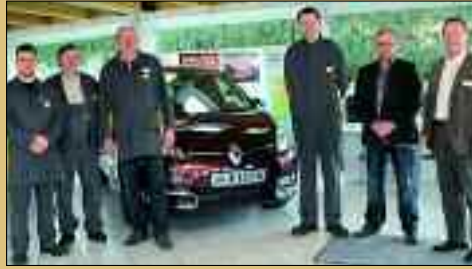
Das Team vom Renault-Autohaus in Karo