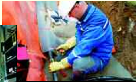
Ob Netzwerk- oder Erdverkabelung – die Spezialisten der Elektroanlagen Zepernick GmbH sind dafür die Richtigen.

KNX-Anlagen. Bei Störungen ist der Bereitschaftsdienst – auch an Sonn- und Feiertagen – zu erreichen unter: 01 73/6 10 50 60.