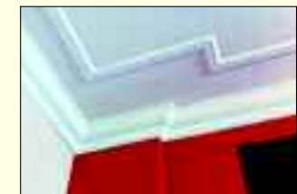
Handwerklich: Feine Stuckarbeiten in einer Altbauwohnung

lösungsmittelfreien Farben, sondern auch Lackier- und Tapezierarbeiten, Putz- und Stuckarbeiten, Schimmelbeseitigung, das Verlegen von Bodenbelägen und der Einbau von Brandschutzverkleidungen. Immer öfter werden die Handwerker in letzter Zeit auch zu energetischen Sanierungen hinzugezogen. Dabei