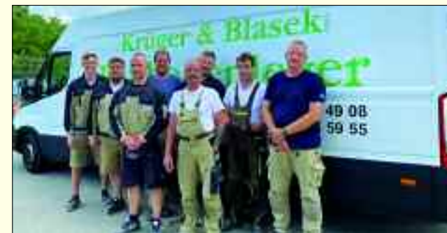
Das Power-Team der Krüger & Blasek GmbH steht für höchste Kompetenz und Qualität.