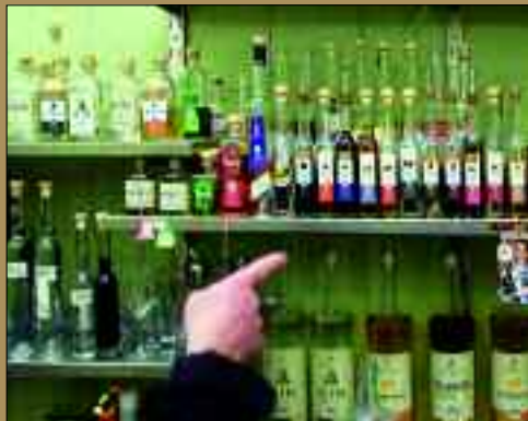
Schier unerschöpfliche Auswahl edler Getränke.

Eine breite Palette von Likören mit edlen und natürlichen Zutaten für den süßen Genießer werden hier mit größter Sorgfalt hergestellt. Egal ob Himbeere, Bratapfel, Schokolade, heimische Kräuter – wahre Schätze für den bewussten Genuss oder zum Mixen. Ein high-light ist der Schwarzbierlikör mit Zutaten aus der eigenen Brauerei. Höher prozentige Brände und Geiste vervollkommen das Angebot. Vom Himbeergeist bis zum Bierbrand, Gin und sogar Whisky ist die Auswahl schier unerschöpflich. Der Geheim-