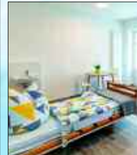
Helle und modern eingerichtete Zimmer für ein selbstbestimmtes Leben.

Der Aufenthalt in einem Pflegeheim, ohne ständige pflegerische Überwachung, wäre für die Betroffenen nicht realisierbar – schließlich gibt es oft nur drei Pflegekräfte für 25 bis 35 Patienten. Der Aufenthalt in einer Klinik wäre zwar geeignet, aber wer möchte schon dauerhaft in einem Akutkrankenhaus auf der Intensivstation leben? Die Vorteile, sich für eine Wohngemeinschaft zu