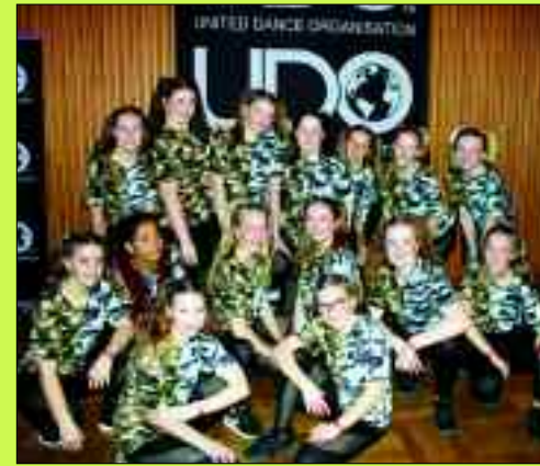
„Blue Angels“ bei der Norddeutschen Meisterschaft der United Dance Organisation UDO 2019.

Die Anstrengungen lohnten sich aber. „Swans Delight“ qualifizierte sich bei der Ostdeutschen Meisterschaft für die Deutsche Meisterschaft in Barleben und die Schwäne nahmen an der Berliner Streetdance Meisterschaft im Rahmen der