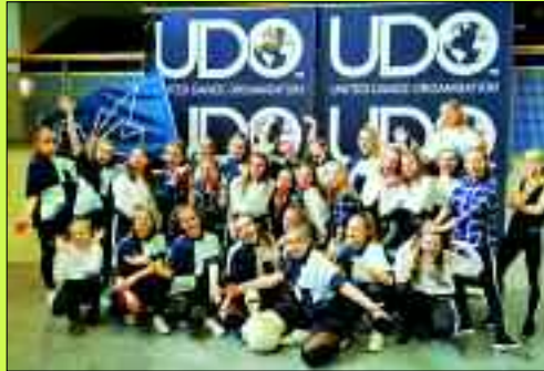
Die „Swans Delight“ und die...

Festes. Für das jüngste Team „United Swans“ war es der erste öffentliche Auftritt. Super gemacht!