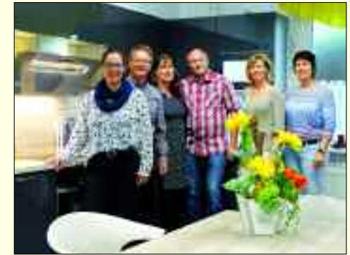
Das Korbicki-Team im 30. Jubiläumsjahr.

Tel. 030/9444605 • Fax 030/94414880 • neue.kueche@korbicki.de • www.korbicki.de