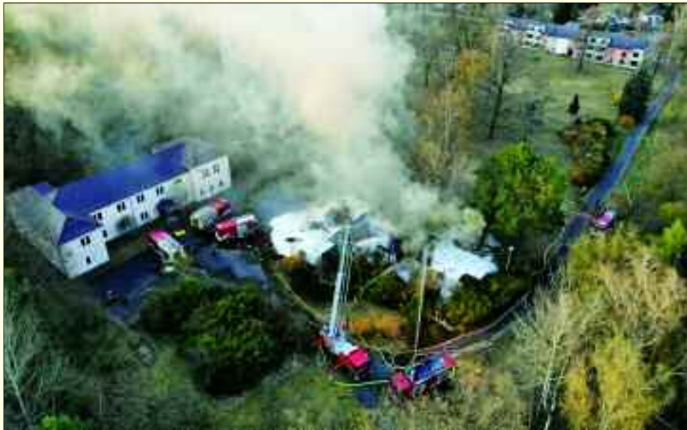
Brand einer Baracke hinter dem Seniorenheim in der Schönerlinder Straße in Zepernick am 11. April 2020. Ein Foto ist mit einer Drohne entstanden, die bei manchen Einsätzen genutzt wird, um sich wie hier einen Überblick über die aktuelle Lage zu verschaffen.

Aber es gibt auch Probleme, die gar nichts mit Feuer oder Unfällen zu tun haben. Fast jedes Mal, wenn ausgerückt wird, müssen zuerst einmal zugeparkte Straßen überwunden werden. Das kostet Zeit und die ist nun einmal knapp, wenn es darum geht, Menschenleben zu retten oder noch größeren Schaden abzuwenden. „Wir kommen mit großen Lkw-Fahrzeugen, sind in Eile und müssen uns durch zugestellte Straßen in den Wohngebieten schlängeln“, sagen die Kameraden.