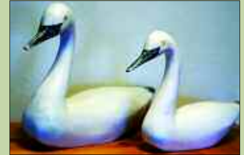
Schon seit Jahren nehmen die beliebten Maskottchen des Schwanezahnhauses die Angst.