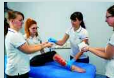
Regelmäßige Weiterbildungen und Übungen sind Grundlagen für den Therapieerfolg.

Für das TÜV-zertifizierte Unternehmen ist die Umsetzung der Verbandswchsel von enormer Wichtigkeit. Daher nehmen sich die Wundmanager viel Zeit um den Patienten, den Angehörigen sowie das durchführende Pflegefachpersonal anzuleiten. Alle Schritte der Wundversorgung werden erläutert und gegebenenfalls vorge-