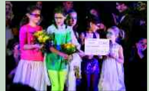
Mehr als Lernen: gelungene Kombination – Benefizgala und Theaterstück.

Aber das Gymnasium Panketal war vor 20 Jahren nicht angetreten, um „nur“ ein weiteres Gymnasium im Landkreis Barnim zu sein. Den Panketaler Schülern und Schülerinnen bietet sich seit der Schulgründung die Möglichkeit ein Gymnasium ganz in der Nähe zu besuchen und Eltern finden eine Ganztagschule, die ein verlässlicher Partner