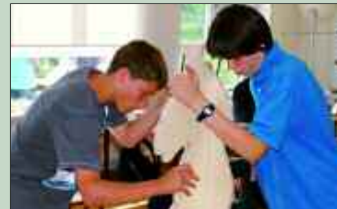
Gemeinschaft wird bei der Arbeit groß geschrieben.

Mittlerweile haben sich viele Traditionen entwickelt, die für eine gute Schulgemeinschaft sorgen und Körper und Geist ansprechen: Projektwochen, in denen geklettert, gesegelt, geradelt oder auch Ski gefahren wird. Ganz offensichtlich ist das Gymnasium Panketal eine Schule in Bewegung – und so wird es auch bleiben.