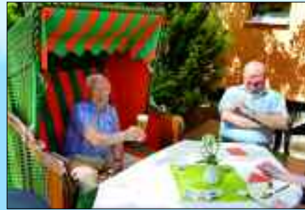
Trotz Hygieneregeln voll im Leben.

einfacher geworden. So können die ehrenamtlichen Helfer vom Eichenkränzchen nicht mehr zu Besuch kommen. Recht spontan sprangen aber Schüler ein: In Briefen und schriftlichen Grüßen an die Bewohner schildern sie, wie sie selbst die schwierige Zeit wahrnehmen. Außerdem errei-