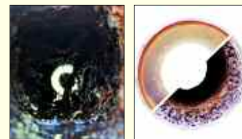
Bei TV-Inspektion gefundener Wurzeleinwuchs (li.) Vor und nach der Sanierung (re.)

Verstopfungen und Schäden in Rohrleitungen sind der Albtraum eines jeden Eigenheimbesitzers, denn Stemm- und Abbrucharbeiten zur Schadensbehebung sind nicht nur aufwändig, sondern auch kostenintensiv. Die PolyLine Umwelttechnik GmbH hat für solche Fälle die richtige Lösung parat: RohrInnensanierung mittels SchlauchLiner-Verfahren! Spezialisiert auf die Instandsetzung von Schmutz- und Regenwasserleitungen gehören die Rohrreinigung und das Entfernen von Ablagerungen und Inkrustationen, die Rohrinspektion mittels Kamertechnik und die Auswertung des aufgenommenen Videomaterials zur Erstellung eines individuellen Sanierungskonzeptes zu den Kerntätigkeiten des Wandlitzer Unternehmens. Für Privatkunden sowie Unternehmen und öffentliche Einrichtungen ist die PolyLine GmbH bereits seit 1998 bundesweit im Einsatz und bietet ihren Kunden die ideale Alternative zur RohrInstandsetzung in offener Bauweise. Für die Sanierung kommt ein Rohr-Im-Rohr-System zum Einsatz, welches alle Schadstellen vollständig abdichtet.