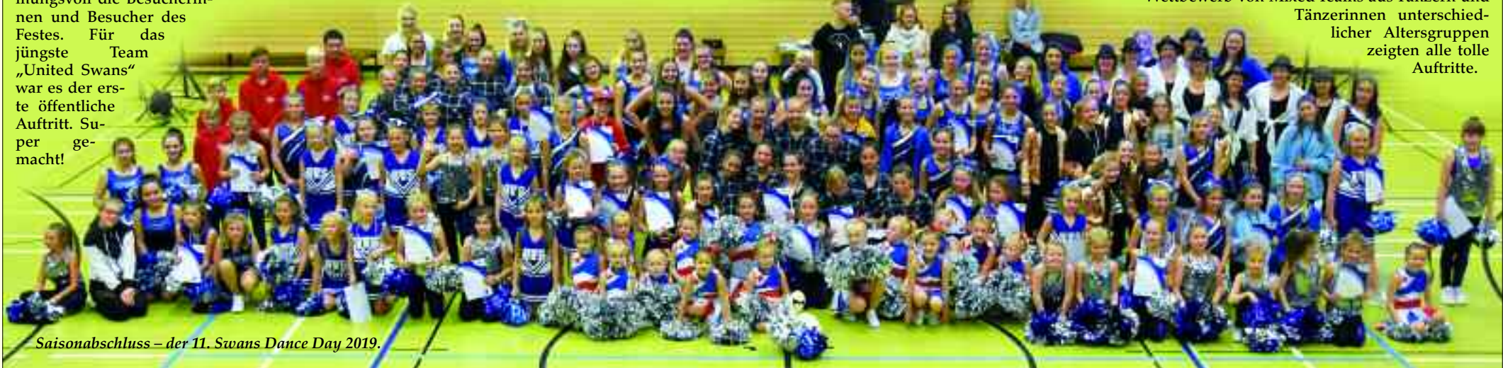
Saisonabschluss – der 11. Swans Dance Day 2019.

Tänzerinnen unterschiedlicher Altersgruppen zeigten alle tolle Auftritte.