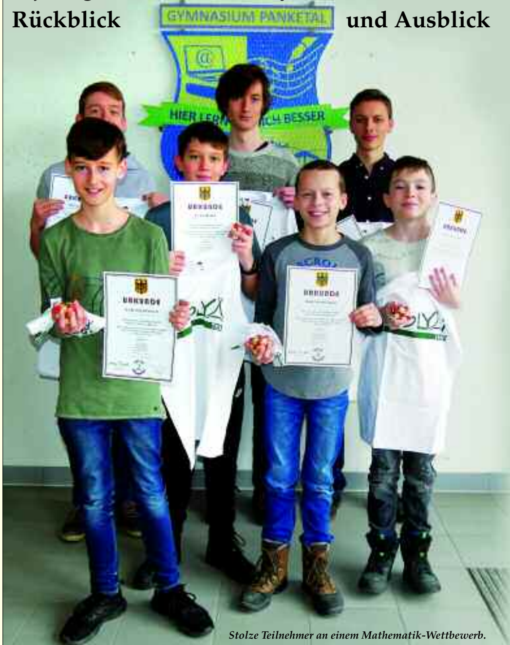
Stolze Teilnehmer an einem Mathematik-Wettbewerb.

„Hier lernt es sich besser!“ – Mit diesem Satz trat das Gymnasium Panketal vor gut 20 Jahren an. An diesem Motto und Anspruch hat sich bis heute nichts geändert und der Erfolg der Freien Schule gibt ihren Gründern recht.