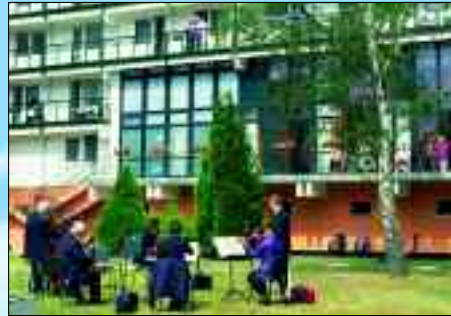
Live-Musik mit Abstand – Balkonkonzert.

chen die Einrichtungen kleine Geschenke und sogar selbst gebastelte Spiele. Die Schüler haben sogar extra einen Blumenkasten in Regenbogenfarben gepflanzt. Und selbst gemalte Bilder er-