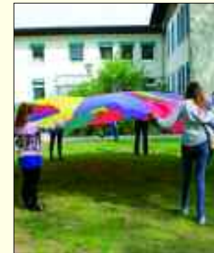
Die Tür steht offen – für Kinder und Jugendliche mit Problemen.

In Ludwigsfelde gründete 1991 der Märkisches Kinderdorf e.V., auf einem eigenem, 14.000 Quadratmeter großen Gelände, ein kleines Kinderdorf, in dem Kinder und Jugendliche ein zu Hause auf Zeit finden können. Insgesamt verfügt die Einrichtung über 53 Plätze, fünf familienanaloge Wohngruppen, drei Jugendwohngemeinschaften und einen Trainingswohnbereich. Jedes der einzelnen Häuser ist eine abgeschlossene Erziehungseinheit und beherbergt jeweils eine Gruppe, in der Kinder oder Jugendliche die entsprechende Zuwendung, Geborgenheit und Hilfe von sozialpädagogischen Fachkräften erhalten. Aufgenommen werden Kinder und Jugendliche, die aufgrund familiärer