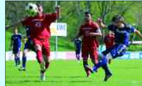
Spiel der 1. Männer gegen den FC Strausberg

G- bis zur A-Jugend gut aufgestellt ist, die auf Landesebene in den höchsten Spielklassen recht leistungsbezogen spielen, wird das wunderbare Waldstadion in Zukunft wie-