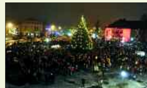
Begeisterte Kulisse – Turmblasen vom Rathaus

hen, dem Wertungsspiel unterzogen. Wenn die großen Gruppen Mittagspause hatten, dann begeisterten die Ludwigsfelder die Massen. Das gefiel allen so sehr, dass viele mit Familie noch heute die Musiktage in Rastede als kompetente Zuhörer besuchen. Auf Qualität legen sie immer noch großen Wert, das wöchentliche Proben gehört dazu wie auch fachlicher Rat und Betreuung durch einen Profi des Potsdamer Polizeiorchesters.