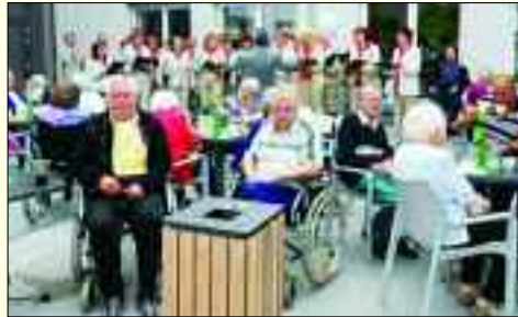
Im FONTANEHOF wird viel für die kulturelle Betreuung der Bewohner getan.

Seit Oktober 2012 ist nun auch ein Senioren- pflegeheim der CASA REHA Unterneh- mensgruppe in Ludwigsfelde vor Ort. In der modernen und zentral gelegenen Pflegeein- richtung FONTANEHOF an der Hauptstraße finden pflegebedürftige Bewohner ein neues Zuhause, das ein hohes Maß an Lebensqualität bietet. Ein elegantes, liches Foyer empfängt jeden Bewohner und Gast freundlichst, eine Cafeteria ist im Haus integriert und die großzü- gige gestaltete Gartenanlage ermöglicht einen geschützten Aufenthalt an frischer Luft. Das umfangreiche, betreute Wochenprogramm mit vielfältigen therapeutischen und Freizeitange- boten, wie Ausflügen, Festen, Literaturkursen und anderem gehören ebenso selbstverständ- lich zum Angebot der Einrichtung wie die indi- viduelle Ausrichtung der Pflegebedürfnisse auf den Einzelnen. In 121 Einzel- und 13 Doppel- zimmern mit eigenem Bad, Radio- und TV- Anschluss und integriertem Notrufsystem kann jeder Bewohner selbstständig sein und sich wohlfühlen. Die komplett barrierefreie Ausstattung im gesamten Haus mit mehreren