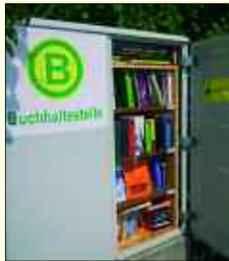
Die kleinste Ludwigsfelder Bücherei gibt es in Ahrensdorf

entleihen, natürlich kostenlos. So bereichern sie das Leben des Ludwigsfelder Ortsteils und nicht nur die Ahrensdorfer sind gespannt, was den „Iron Moms“ noch so alles einfällt.