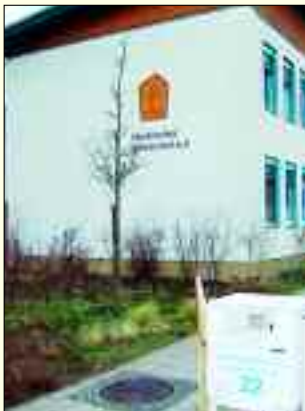
Die Tür steht offen – für Kinder und Jugendliche mit Problemen.

In Ludwigsfelde gründete 1991 der Märkisches Kinderdorf e.V., auf einem eigenem, 14.000 Quadratmeter großen Gelände, ein kleines Kinderdorf, in dem Kinder und Jugendliche ein zu Hause auf Zeit finden können. Insgesamt verfügt die Einrichtung über 50 Plätze. Jedes der einzelnen Häuser ist eine abgeschlossene Erziehungseinheit und beherbergt jeweils eine Gruppe, in der Kinder oder Jugendliche die entsprechende Zuwendung, Geborgenheit und Hilfe von sozialpädagogischen Fachkräften erhalten. Aufgenommen werden Kinder und Jugendliche, die aufgrund familiärer Belastungs- und Konfliktsituationen vorübergehend nicht bei ihren Eltern leben können. Dabei ist