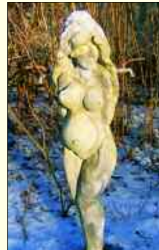
Venus im Winter – überraschende Fotomotive am Mellensee

durch und durch surrealistisch romantisch barocker Künstler, ja so bin ich.“ Dabei blickt er listig verstohlen über seine