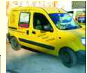
Wo der gelbe Fiat des Vereins anrollt, ist Hilfe stets gefragt