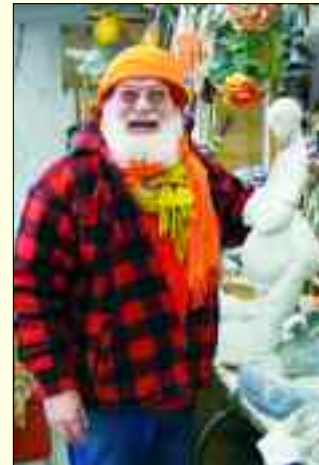
Der Bildhauer mit seiner Nachbildung der etwa 25.000 Jahre alten „Venus von Lespugue“

Familienfreizeit, im Winter. „Im Sommer bin ich auf Tour“, schmunzelt der Tausendsassa in Sachen Kunst und Design, „da unterrichte ich zwei Monate lang auf Burg Fürsteneck, treibe mich auf Plainairs herum.“ Er hat Drehbücher und ein Büchlein für Attac geschrieben, den Zossener Kraut & Rüben Markt begründet, mit aufsehend erregenden