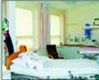
Helle, modern eingerichtete Zimmer sorgen für angenehme Atmosphäre während der Geburt