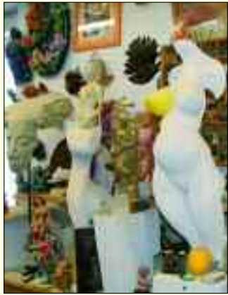
Ein Blick in das Atelier des Bildhauers mit der „Citronella“

Das ist ein Wahlspruch der drei Dutzend Mitglieder des Kunstvereins von Ludwigsfelde, der am 30. Mai sein 15. Jubiläum feiert. Und seit