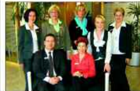
Das Team der Sparkasse in der Potsdamer Straße

So kann man am Ende eigentlich nur eine Empfehlung aussprechen, ein weiteres Zitat aus der Werbung: „Wenn's um Geld geht – Sparkasse.“