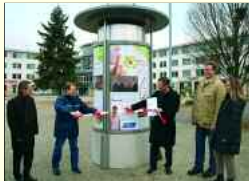
Bürgermeister und Gewerbeverein weihen die erste Litfaßsäule in der Innenstadt ein

Beides! Fluch und Segen in einem. Auf die Herausforderungen und Chancen der Zukunft sehen wir uns gut vorbereitet. Der neue Hauptstadt-Airport BER erweist sich zunehmend als Jobmaschine mit vielen neuen Arbeitsplätzen. Dafür entwickeln wir derzeit Flächen als Vorsor-