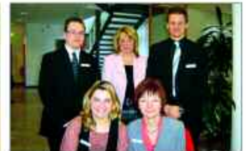
Die Kollegen der Geschäftsstelle in der Straße der Jugend

Die Mittelbrandenburgische Sparkasse findet man gleich drei Mal in Ludwigsfelde: