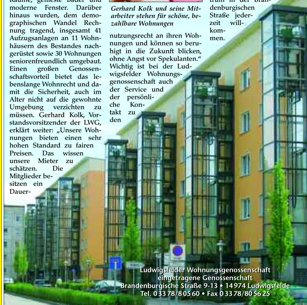
Ludwigsfelder Wohnungsgenossenschaft eingetragene Genossenschaft Brandenburgische Straße 9-13 • 14974 Ludwigsfelde Tel. 0 33 78/8 05 60 • Fax 0 33 78/80 56 25

Bewohnern der Häuser. Die freundlichen Mitarbeiter haben jederzeit ein offenes Ohr für ihre Mieter bei allen anstehenden Fragen von der Betriebskostenabrechnung bis hin zu besonderen Wünschen bei notwendigen Sanierungsmaßnahmen. Übrigens: Auch Kaufinteressenten für Wohnungen sind im Kundenzentrum in der Brandenburgischen Straße jederzeit willkommen.