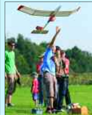
Der Start eines ferngesteuerten Segelflugmodells – ein Erlebnis

Modellflugclub 90 e.V. Ludwigsfelde (MFC 90) Kirchring 8 • 14959 Trebbin OT Märkisch Wilmersdorf Tel. 03 37 31/3 23 90 www.modellflugclub-90.de