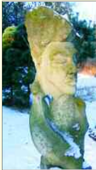
„Hummelshorn des Mondes“ – nur eine Skulptur des Bildhauers Sam C. in seinem Garten

lange gelernt, unter anderem mit dem Studium der Bildhauerei von 1990 bis 1996 bei den Professoren Fujiwara und