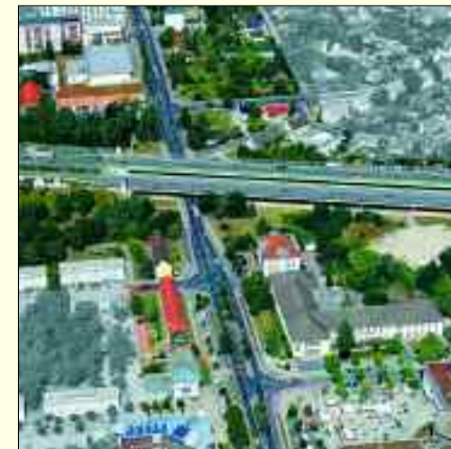
Planungsbereich „Neue Mitte“ – Beitrag zur Belebung der Innenstadt

Euro Fördermittel für die Entwicklung einer neuen Stadtmitte bewilligt bekommen. Bis 2019 stehen weitere Mittel in Millionenhöhe zur Verfügung. Für alle sichtbar ist schon jetzt die Sanierung des Kulturhauses. Im Herbst 2013 planen wir die große „Licht-an-Party“, mit der wollen wir dann den Ludwigsfeldern ihr Kultur- und Bürgerhaus in neuer Schönheit und mit modernster Technik wiedergeben. Die Entwicklung des Zentrums entlang der Potsdamer Straße werden wir besonders nördlich der Autobahn vorantreiben. Auch hier tut sich schon einiges. So werden derzeit das neue Seniorenpflegeheim „Fontanehof“