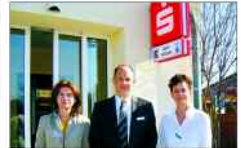
Klein aber fein: die Sparkassenfiliale in der Rudolf-Breitscheid-Straße

Besonders interessant ist auch der Immobilien-Service: Durch ihre regionale Marktkenntnis