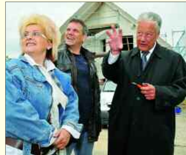
Das 20jährige Jubiläum der Bau & Ausbau GmbH Zahna wurde beim 700. Richtfest eines schlüsselfertigen Hauses gefeiert, in Anwesenheit von Björn Engholm, Vorstand des Vereins „Das Europäische Markenhaus“ e.V.

Chancen sehen und nutzen – die Maxime der Bau und Ausbau GmbH Zahna. Das war am 1. Juli 1990 schon so, als sich die Firma in turbulenten Wendezeiten gründete. Seit dem Jahre 2000 ist das Zahnaer Unternehmen in der Hauptsache auf die Erstellung und den Verkauf von schlüsselfertigen Ein- und Mehrfamilienhäusern ausgerichtet. Wie die Referenzen belegen, ist es auch für jegliche Form des Umbaus und der Sanierung von Altimmobilen ein kompetenter Partner. Einen Namen hat sich die Bau und Ausbau GmbH Zahna ebenso im Denkmalschutz mit so spektakulären Objekten wie dem Cranachhaus und der Hundertwasserschule in der Lutherstadt Wittenberg, gemacht. Die Firma Bau & Ausbau GmbH Zahna, von ihren Bauherren liebevoll „Zahnabau“ genannt, ist ein klassischer, eingetragener Handwerksbetrieb. Viele Außenstellen, beispielsweise das Büro Ludwigsfelde, Nuthedamm 4, stehen den Kunden zur ortsnahen Betreuung, auch nach Fertigstellung, zur Verfügung. Seit dem 1. August 2003 gehört das Unternehmen, als eine der ersten Firmen in den neuen Bundesländern, dem Qualitätsverband Wohnsiegel – „Das Europäische Markenhaus“ e.V., an. Ein umfangreiches Prüfungsverfahren in den Punkten Qualität, Innovation, Bonität, Liquidität und Bauherrenzufriedenheit ging der Aufnahme voraus. Der Verband selbst versteht sich bundesweit als Schutzpatron aller Häuslebauer. In-