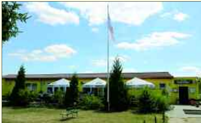
Die „Petersilie“ ist Mittelpunkt der Kleingärtner.

Erholung der irrt. Für das Leben im Kleingarten und einer solchen Kolonie gelten das Bundeskleingartengesetz und andere Regeln. Voraussetzung für die Vergabe eines Gartens ist die Mitgliedschaft in einem gemeinnützigen Kleingartenverein. Der Verein erhebt zum Beispiel Mitgliedsbeiträge und legt die regelmäßigen Arbeitsansätze fest. Dann werden unter anderem die Gemeinschaftsflächen gepflegt. Wer sich für einen Kleingarten interessiert, sollte deshalb neben einem so genannten „Grünen Daumen“ auch eine gewisse Affinität zum Vereinsleben mitbringen! Mit dem Kreisverband, dem der Verein angeschlossen ist, wird der eigentliche Pachtvertrag geschlossen, in dem unter anderem die Höhe der Pacht vereinbart wird. „Bei uns beträgt sie pro Quadratmeter 6,2 Cent. Und damit sind wir sehr günstig. Es gibt Anlagen, beispielsweise in Berlin, da beträgt eine Jahrespacht teilweise bis an die 1.000 Euro.“