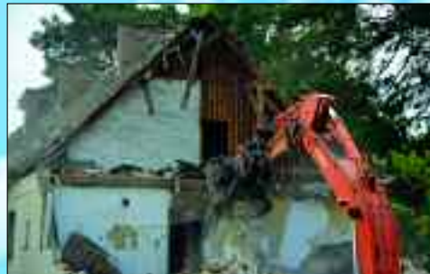
Abriss der alten Gebäude an der Potsdamer Straße im Oktober 2015.

der Treppe auch mit dem Personenaufzug barrierefrei erreichbar. Selbstverständlich gehören zum modernen Wohnen auch kurze Wege – und das bietet das Objekt Potsdamer Straße 11-27 allemal: Nähe zum Bahnhof, Bushaltestelle vor der Tür und die Nähe zum Zentrum sind ideal. So ist das Rathaus auf der anderen Straßenseite und die Ende 2016 eröffneten Ludwig-Arkaden sind kaum 200 Meter entfernt. Dass die Mieter äußerst zufrieden sind, kann Martina Zander, die verantwortlich für die Vermietung ist, bestätigen: „Ich höre immer wieder, die Wohnungen seien schön hell, modern geschnitten und haben großzügige Treppenhäuser sowie geräumige Bäder. Alles in allem lebt es sich hier richtig gut!“