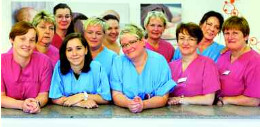
Mittels modernster Diagnostik werden Therapien festgelegt, um gut- oder bösartige Erkrankungen der Brust erfolgreich zu behandeln.