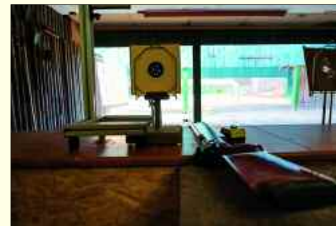
Auch der Schießstand für Langwaffen ist mit einer Seilzuganlage ausgerüstet, die das Heranholen der Scheiben ermöglicht.

Auf der Schießanlage sind sechs 25-Meter-Bahnen und sieben 50-Meter-Bahnen eingerichtet. Sie sind mit Seilzuganlagen ausgestattet mit denen dann die Scheiben herangeholt werden können. In-