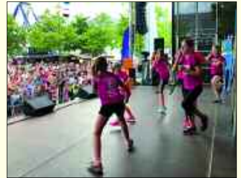
Inzwischen macht die Tanzschule Hueber sich auch mit einzelnen Auftritten einen Namen, wie hier die „Hip-Hop-Kids“ beim Lufest 2018.