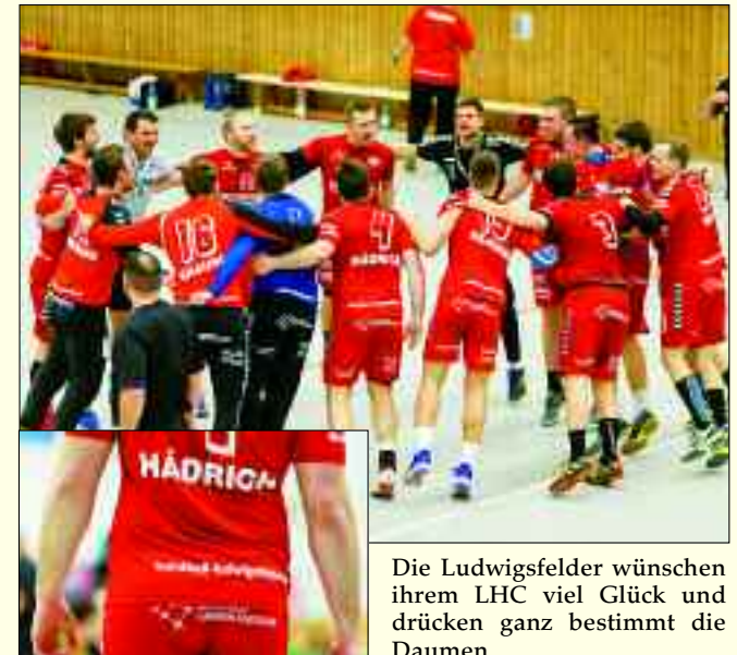
Die Ludwigsfelder wünschen ihrem LHC viel Glück und drücken ganz bestimmt die Daumen.

Am Ende der Saison 2017/18 waren die Ludwigsfelder Tabellenstehster. 13 Siege errangen sie. Elfmal mussten sie sich ihrem Gegner geschlagen geben und ein Remis steht in der Statistik, die in der neuen Saison deutlich verbessert werden sollen.