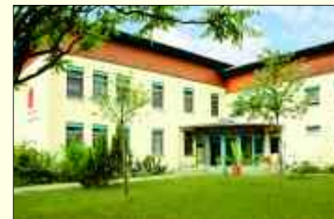
Das Märkische Kinderdorf hilft Kindern und Jugendlichen in Not.

Mitten im Zentrum von Ludwigsfelde und doch im Grünen bietet das Märkische Kinderdorf bis zu fünfzig Kindern und Jugendlichen ein Zuhause auf Zeit. Insgesamt verfügt die Einrichtung über fünf familienartige Wohngruppen, zwei Jugendwohngemeinschaften und einen Trainingswohnbereich. Jedes der einzelnen Häuser ist eine abgeschlossene Erziehungseinheit und beherbergt jeweils eine Gruppe, in der Kinder und Jugendliche die entsprechende Zuwendung, Geborgenheit und Hilfe von sozialpädagogischen und therapeutischen Fachkräften erhalten. Aufgenommen werden Jungen und Mädchen, die aufgrund von familiären Belastungs- und Konfliktsituationen vorübergehend nicht bei ihren Eltern leben können. Der Erhalt des Elternhauses und die Rückführung der Kinder und Jugendlichen ist dabei erklärtes Ziel. Die Vermittlung von eigenem Wohnraum ist die