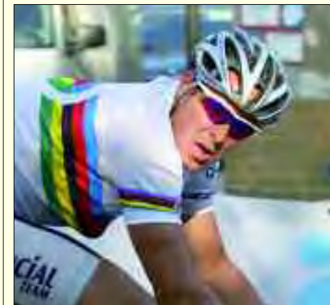
So kennt man den schnellen Ludwigsfelder – hoch motiviert und konzentriert