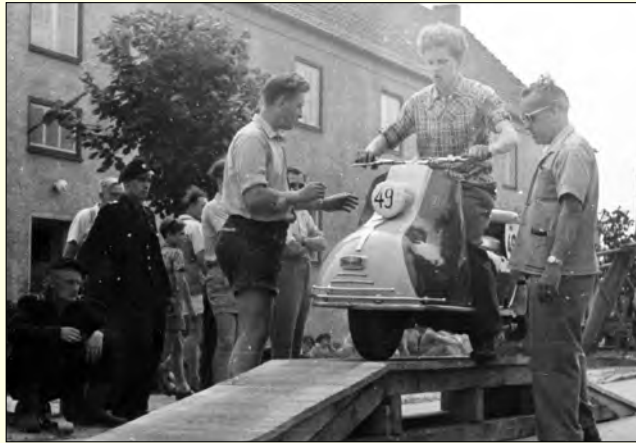
Der „Pitty“ in jungen Jahren