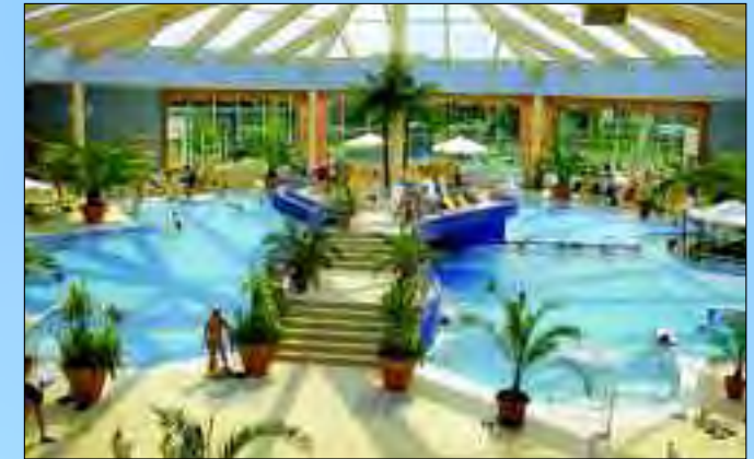
Die Kristall-Therme begrüßte im Juni den millionsten Gast

mehr zu einer gemeinsamen Stadt heran. Die „Lokale Agenda 21 – Initiative Ludwigsfelde“ hilft dabei, dass alle in dieser Stadt ihren Platz finden und sie noch lebens- und liebenswerter wird. Aber auch wirtschaftlich läuft es in der Boomtown an der A10. Die Daimler AG plant den Aufbau