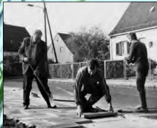
Schon damals legte man Wert auf ein schönes Äußeres der Stadt

A utomobilbauerstadt – Boomtown – Mittelstandszentrum. Ludwigsfelde hat viele Namen, doch passt grüne Stadt vielleicht noch am besten zu den 110 Quadratkilometern am Rande Berlins. Denn auch wenn die Industrie und Gewerbe den Ruf Ludwigsfeldes prägen, sind es die Ruhe und das Grün auf den Ortsteilen, die den Charme dieser Industriemetropole bestimmen. Nicht gewachsen son-