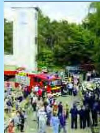
Weit über 50.000 Euro spendeten die Ludwigsfelder aller Ortsteile für den im Frühjahr eingeweihten Feuerturm

entwickeln kann und wollen mit der Agenda 21 Bürger und Verwaltung an einen Tisch bringen, um gemeinsam zu entscheiden, wie sich Ludwigsfelde in der Zukunft entwickeln soll. A10, Anhalter Bahn und die Schönefelder Einflugschneise sind gleichzeitig Hauptprobleme und wichtigste Standortfaktoren der Stadt. Denn nicht nur