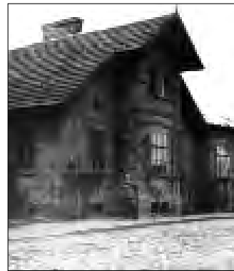
Das Chausseehaus wurde um 1892 erbaut