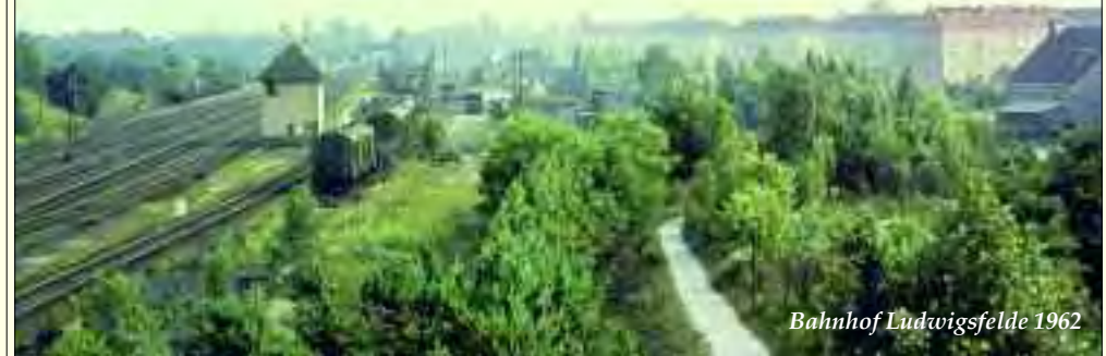
Bahnhof Ludwigsfelde 1962