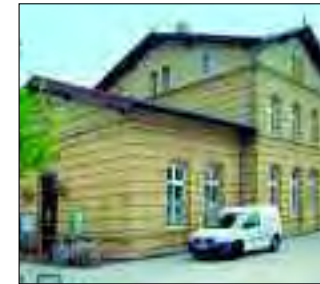
Heute befindet sich das Stadtmuseum im restaurierten Bahnhofsgebäude

Durch die Besiedlungspolitik zwischen 1750 und 1753 entstand die Kolonie Ludwigsfelde. Dieser Ortsname (eine Wortneuschöpfung) ist auf Ludwig von Groeben zurückzuführen. Zunächst lebten „sechs ausländische kleine Wirthe“ in Ludwigsfelde. 1751 entstand ein Krug, ehemals „Goldener Hirsch“ genannt, heute „Alter Krug“, der 1753