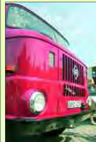
Die erste Baureihe des legendären W50

der Ludwigsfelder. Die allerdings sind lieber mit dem Fahrrad unterwegs und machen Ludwigsfelde auch heute noch zur Stadt der Radfahrer. Dank der Benzinpreise wird dieser Status sicher auch noch ausgebaut werden.