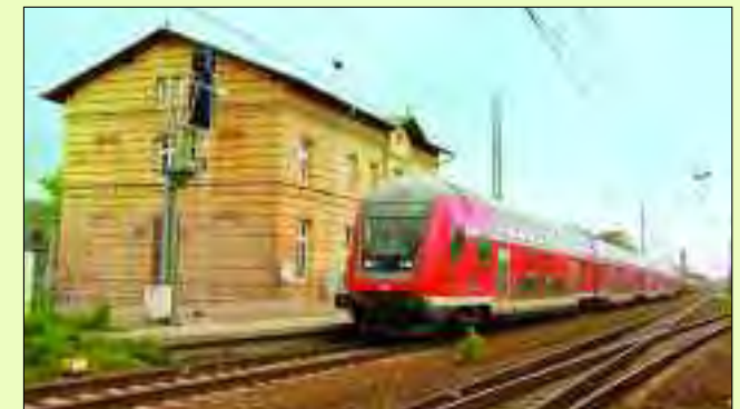
Modern, stündlich und in wenigen Minuten in der Hauptstadt

Erstmals selbstständig wurde Ludwigsfelde im Jahre 1928 durch die damalige Gemeindegebietsreform. Doch nannte man den Ort anfangs noch Damsdorf, obwohl Ludwigsfelde das größere der beiden zusammengeschlossenen Vorwerke war. Ein Jahr später setzten sich die Bürger aber mit Hinweis auf den Bahnhof endlich durch und die Gemeinde an der Bahnstation Ludwigsfelde erhielt den gleichen Namen. Der Bahnhof hieß schon bei seiner Entstehung im Jahre 1886 Ludwigsfelde und nur ihm ist