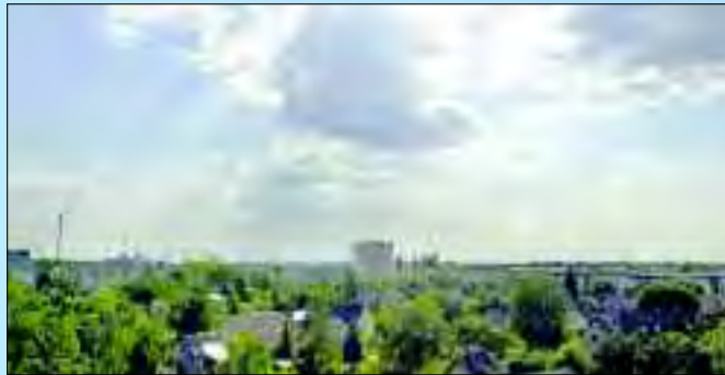
Soweit das Auge blicken kann – Gebäude umgeben von Grün

A utomobilbauerstadt – Boomtown – Mittelstandszentrum. Ludwigsfelde hat viele Namen, doch passt grüne Stadt vielleicht noch am besten zu den 110 Quadratkilometern am Rande Berlins. Denn auch wenn die Industrie und Gewerbe den Ruf Ludwigsfeldes prägen, sind es die Ruhe und das Grün auf den Ortsteilen, die den Charme dieser Industriemetropole bestimmen. Nicht gewachsen son-