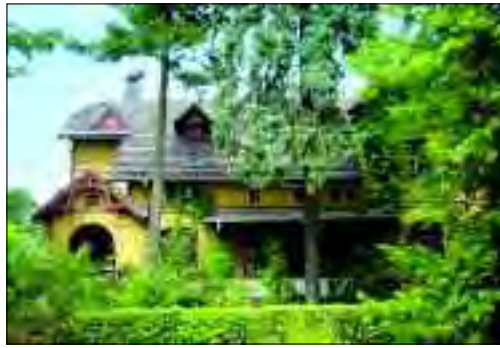
Die Gelbe Villa ist nach wie vor ein echter Hingucker, wenn es um historische Gebäude geht

auch, dass die Ortsbezeichnung Ludwigsfelde sich bereits in den Kursbüchern der Bahn durchgesetzt hatte. Die Poststation, 1843 eingerichtet, trug ebenfalls den Namen. Der Getreidehändler Robert Menzel wurde vom Landrat des Kreises Teltow zum kommissarischen Gemeindevorsteher ernannt, also am 1. Oktober 1928. Eine Gemeindevertretung wurde am 2. Dezember 1928 auf Anraten