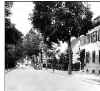
Alte Post – erbaut 1904