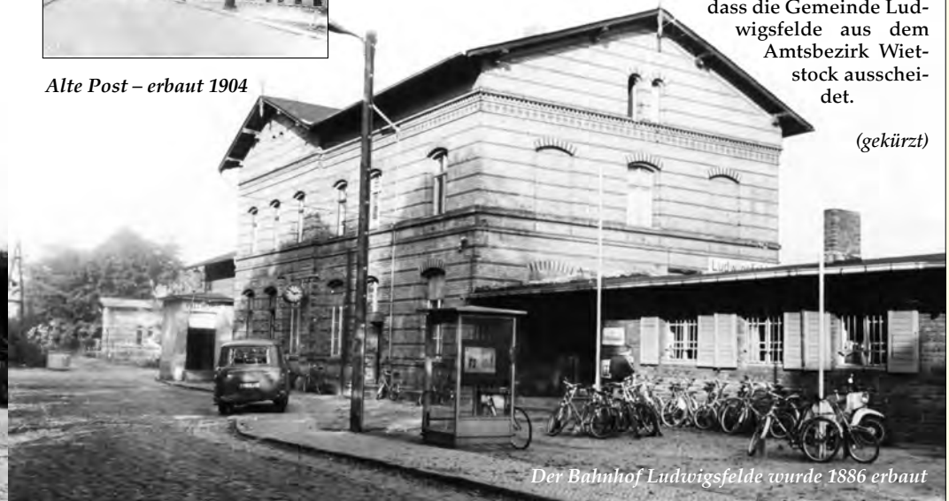
Der Bahnhof Ludwigsfelde wurde 1886 erbaut