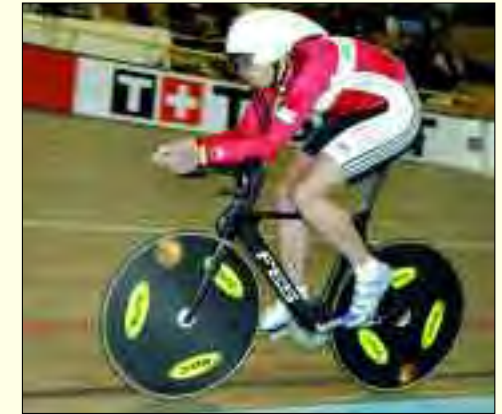
Schnell unterwegs, egal auf welchem Untergrund