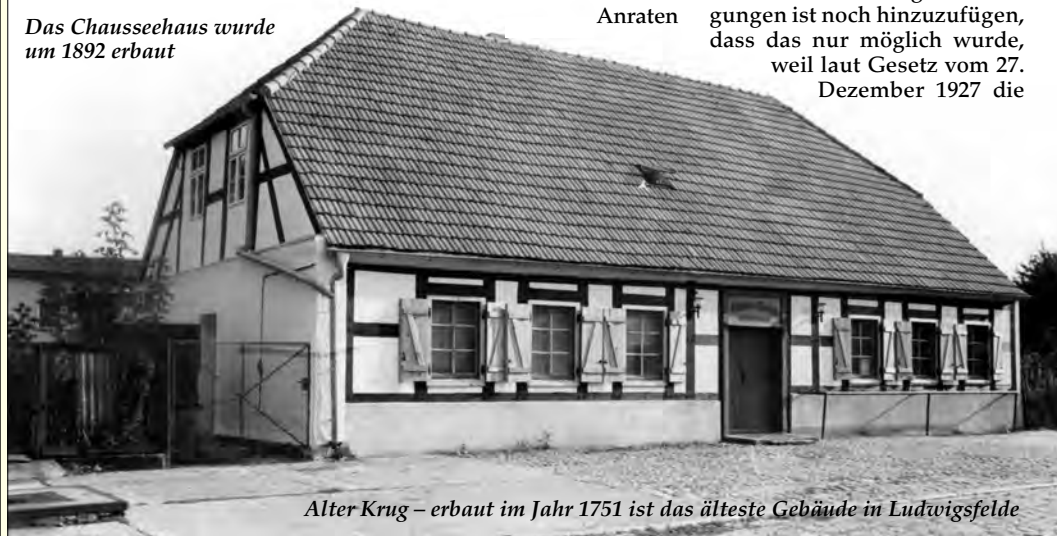
Alter Krug – erbaut im Jahr 1751 ist das älteste Gebäude in Ludwigsfelde