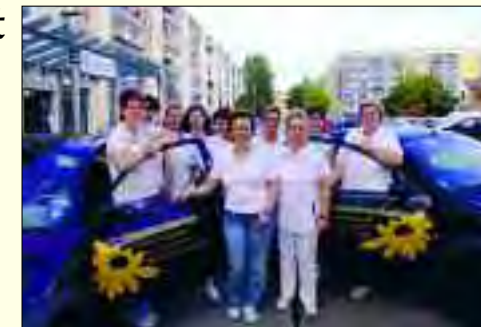
Das Team der Sozialstation ist rund um die Uhr in der Stadt unterwegs. Gut zu erkennen am Sonnenblumen-Symbol