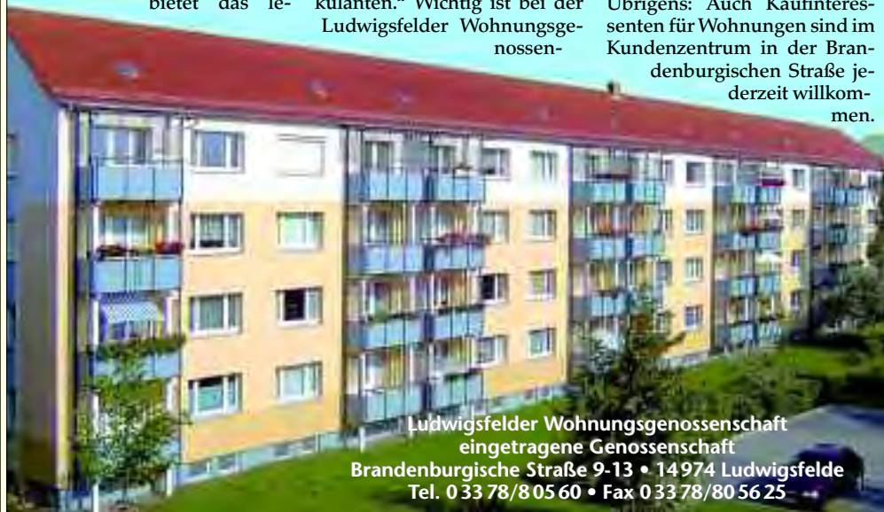
Ludwigsfelder Wohnungsgenossenschaft eingetragene Genossenschaft Brandenburgische Straße 9-13 • 14974 Ludwigsfelde Tel. 0 33 78/805 60 • Fax 0 33 78/80 56 25

Übrigens: Auch Kaufinteressenten für Wohnungen sind im Kundenzentrum in der Brandenburgischen Straße jederzeit willkommen.