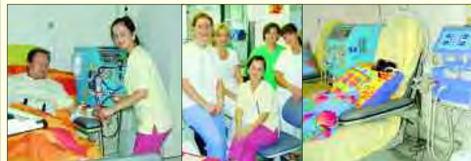
Die Patienten fühlen sich in den Händen vom Team der Dialysepraxis rund um gut betreut

parat, der „künstlichen Niere“, eine Blutwäsche (Hämodialyse) durchgeführt. Als Krankheitsursache, die zur Dialysetherapie führt, steht zur Zeit der Diabetes mellitus mit 34 Prozent an erster Stelle, gefolgt von Gefäßkrankheiten der Niere, zum Beispiel als Folge eines langjährig bestehenden Bluthochdrucks. Bei zwölf Prozent der Patienten ist eine Entzündung der Nierenkörperchen (Glomerulonephritis) für den Ausfall der Nierenfunktion verantwortlich. Eine Dialysebehandlung kann nur teilweise die Funktion der Niere ersetzen. Dies bedeutet,