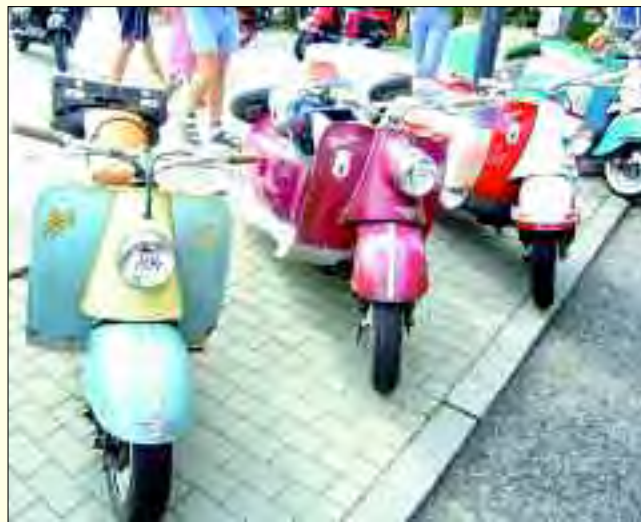
Das diese Roller teilweise älter als 50 Jahre sind, lässt sich auf den ersten Blick nur erahnen

1956 gefertigte Motorroller-typ SR56 der Industrierwerke. Ein Geschicklichkeitsturnier und ein Stadtkorso rundeten den Veranstaltungstag ab. Von nun an fand bis einschließlich 1964 jährlich ein derartiges Treffen statt. In den Jahren 1959 bis 1963 sogar mit internationaler Beteiligung. Die Einstellung der Motorrollerproduktion Ende 1964 wegen Aufnahme der Lastkraftwagenfertigung bedeutete das Aus für die Rollertreffen. So dauerte es bis zum Jahr 2000, dass aus Ludwigsfelde erneut der Aufruf zu einem Treffen kam. Die oldtimerbesessene Familie Both initiierte mit der Stadtverwaltung Ludwigsfelde eine derartige Veranstaltung. Und alle staunten, wie viele Motorroller aus dem Ludwigsfelder Werk noch am Leben waren. Alle zwei Jahre folgen die Rollerfreunde nun wieder dem Ruf nach Ludwigsfelde, nach 2008 das nächste Mal im Jahr 2010.