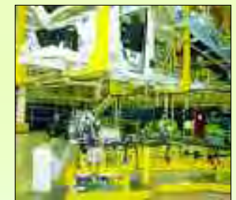
Produktion im Mercedes-Benz Werk Ludwigsfelde