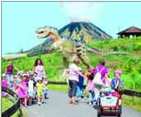
Brandenburgs einziger tätiger Vulkan