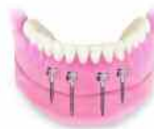
Sofort belastbare Implantate zur Prothesenstabilisierung

Die Praxis orientiert sich am neuesten Stand der Technik. Unter anderem wird ein modernes digitales und damit strahlungsarmes Groß- und Kleinröntgengerät eingesetzt.