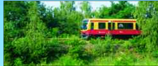
Hennigsdorf ist aus Berlin bequem mit der S-Bahn zu erreichen

geschaffen haben. Zur Landschaftstour gehört es auch, die einstigen Industriebrachen des Stahl- und Walzwerkes zu sehen, jetzt noch grüne Wiese und zugleich großzügige Angebote für Investoren. Dort wo Technopark, Schienenfahrzeugbau, Biotechnologie und die Post mit einem eindrucksvollen Briefverteilungszentrum tau-