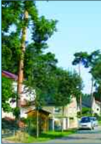
Grünes Wohnen in Stolpe Süd

Enten und Graugänse, Reiher und Kraniche, Seeadler, Biber und Ringelnattern Besitz ergriffen haben.