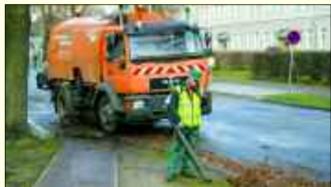
Engagierte Mitarbeiter kümmern sich um das Erscheinungsbild der Stadt Hennigsdorf