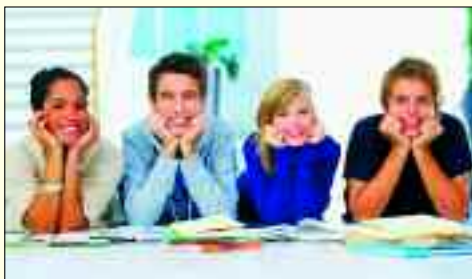
Motivierte Schüler durch angenehme Atmosphäre

Das Gymnasium bietet seinen Schülern bereits ab der 5. Klasse die Möglichkeit hier zu lernen. 250 Schüler können in hellen Räumen und weitflächigen Grünanlagen ihre Talente entfalten. Die Klassenstärke liegt bei maximal 20 Schülern. Demzufolge ist das Bildungs- und Erziehungssystem so angelegt, dass auf