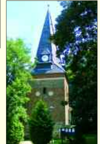
Pilgerstation – die evangelische Kirche in Nieder Neuendorf

Erste Station in Hennigsdorf ist die Kirche in Nieder Neuendorf, die aus einer kleinen Kapelle aus Backsteinen aus dem 13. Jahrhundert entstand. Der wehrhafte Turm wurde später errichtet, anderthalb Meter dicke Mauern mit Schießscharten zum Schutz