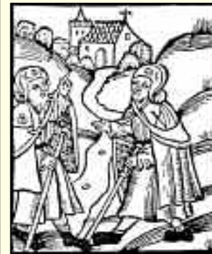
Pilgerdarstellung im 15. Jhd.

Am 20. August 2011 war in Bad Wilsnack Pilgerfest im Goethepark. Der Pilgerweg erlebt heute eine wahrhafte Renaissance, nachdem Wilsnack bis ins 16. Jahrhundert das wichtigste Pilgerziel Nordeuropas war. Und das kam so: Im Jahr 1383 brannte der Raubritter Heinrich von Bülow das Dorf Wilsnack nieder. In den