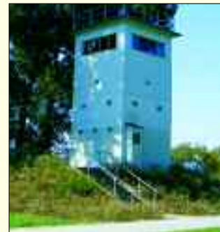
Das Grenzturmmuseum Nieder Neuendorf – ein beliebtes Fotomotiv auf dem Radfernweg

Sie bitten, bevor sie wieder in die Pedale steigen, einen