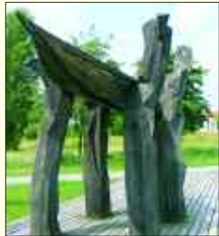
Holzskulptur „Von Ufer zu Ufer“ von Lothar Oertel an der neu gestalteten Uferpromenade

Gut 630 Kilometer ist der Radfernweg lang, der Berlin und Kopenhagen verbindet. Vor Jahren noch eine Tour für durchtrainierte Radwanderspezialisten, herrscht heute ein reger Betrieb auf einem der schönsten Abschnitte der Euro-Velo-Route 7, die vom Nordkap bis nach Malta führt.