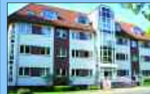
Geschäftshaus in der Parkstraße 60

Wer ein schönes Zuhause sucht, ist bei der Wohnungsgenossenschaft „Einheit“ Hennigsdorf eG genau richtig. Mit 4672 Wohnungen ist die WGH das größte Wohnungsunternehmen in Hennigsdorf und kann somit eine große Vielfalt an Wohnraum anbieten. Neben Wohnungen verwaltet die Genossenschaft auch Gewerbeflächen, Pkw-Stellplätze, zwei Klubräume, drei Gästewohnungen und privates Wohneigentum. Der