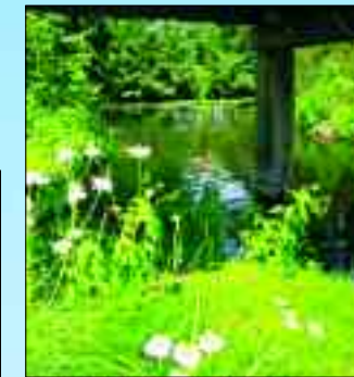
Umweltpreis für renaturierte Havelauen am Stadtzentrum

sende moderne Arbeitsplätze anbieten, verschwinden ihre Gebäude und Hallen oft hinter Hecken und uralten oder neu gepflanzten Bäumen.