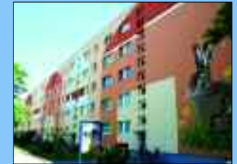
Neugestaltung der Fassade in der Rigaer Straße 7-21

Nachdem in den vergangenen Jahren die Außenanlagen der Wohngebiete LEW, Stahlwerk, Post und Hennigsdorf-Nord neu gestaltet wurden, startete im März 2010 die Erneuerung des Wohnumfeldes im Wohngebiet Paul Schreier. Neu angelegte Gehwege und Rabatten trugen zur Verschönerung bei. Ein Bewegungsparcours, besonders für ältere Mitmenschen, ist ebenfalls in Planung. In Hennigsdorf-Nord haben die Fassaden der Rigaer Straße und der Choysyle-Roi-Straße eine neue