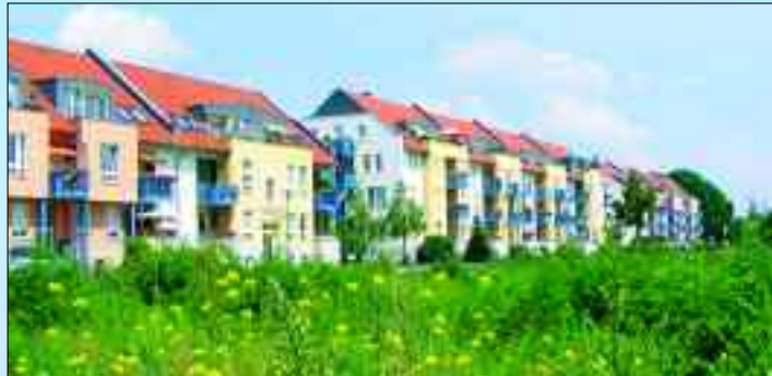
Gefragte Wohnadresse mit dem Blick auf den Nieder Neuendorfer See

Die zweite Erlebnistour bietet die Stadtinformation mit einer Landschaftstour an, wo vor allem die innerstädtischen grünen Oasen auf dem Programm stehen, wie der Uferwanderweg Nieder Neuendorf, der Havelauenpark mit seinen 29 Hektar und vielen Teichen, den Wald- und Rathenaupark, den Eichenpark und den Stadtpark Konradsberg. Ein Picknick in den Havelauen lässt Besucher und auch Hennigsdorfer staunen, was Planer und Stadtverwaltung hier umweltbewusst und ideenreich in den letzten