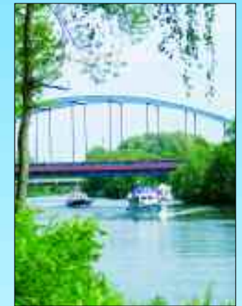
Holländische Freizeitkapitäne an der neuen Eisenbahnbrücke

nie Papenberge, über die Uferpromenade, Am Alten Strom, Über die Kanalbrücke und auf dem Berliner Mauerweg entlang mit Abstechern zum Stadthafen, ins vorbei am alten Rat-