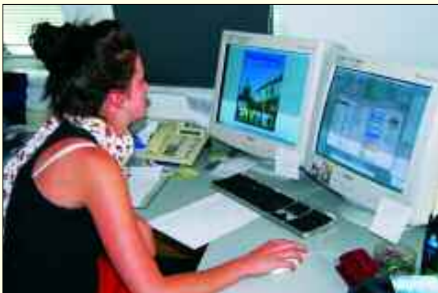
Hier entstehen die beliebten Stadtmagazine

Keine „Anzeigenfriedhöfe“ oder „Bleiwüsten“, sondern durchgehend redaktionelle Gestaltung auch im gewerblichen Teil sowie viele Informationen über den Ort und die örtliche Wirtschaft machen das Konzept der Ortsmagazine aus. Finanziert werden die Hefte durch die kommerziellen Beiträge. Nur sind diese keine Anzeigen, sondern konsequente journalistische Firmenvorstellungen. Es werden immer so viele Magazine gedruckt, dass alle Haushalte ein Exemplar erhalten und eine ausreichende Anzahl an die Verwaltung geliefert werden kann. Journalistische Mitstreiter sind jederzeit willkommen. Sie sollten belastbar sein und neben der Recherche auch das Verkaufsgespräch beherrschen.